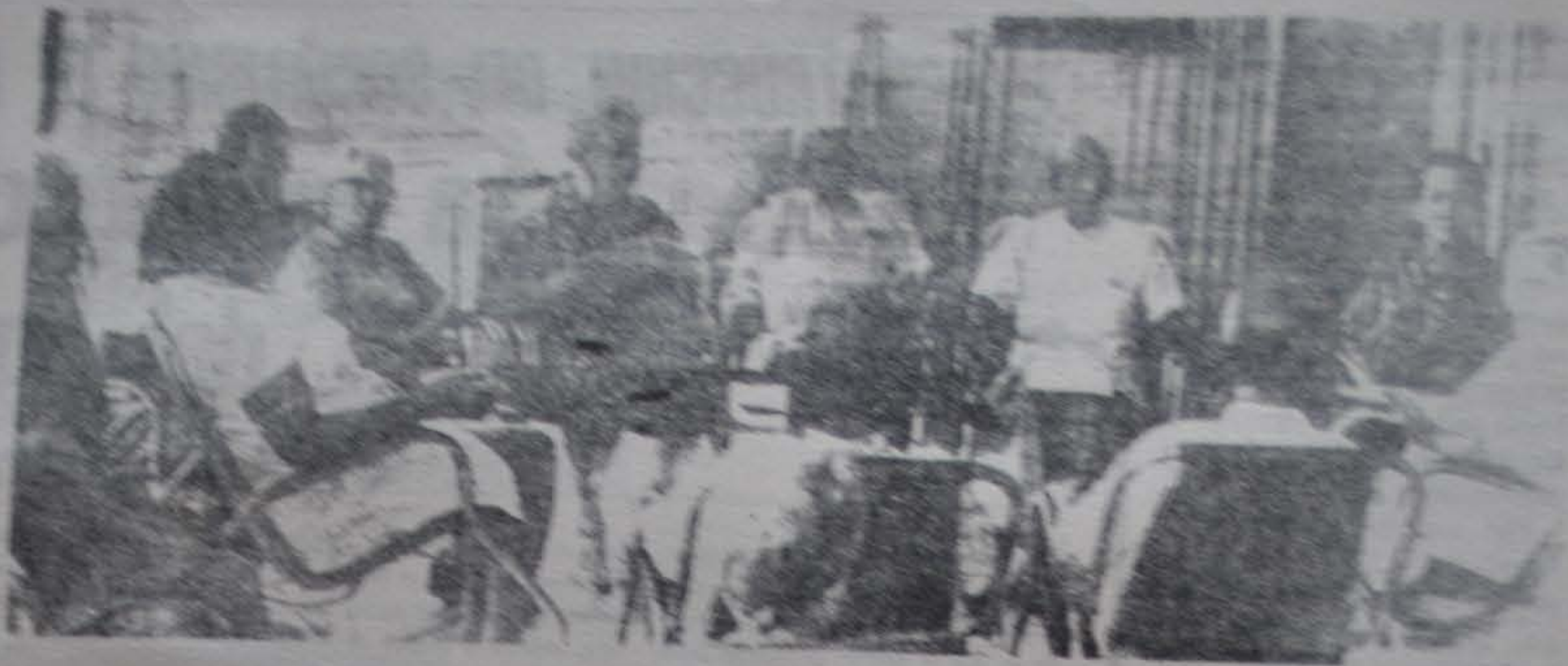
Los nuevos hogares de ancianos en el gobierno de Hager.

le servían los alimentos de manera que con la ayuda de los platos en cantidad suficiente para todos los abuelos. Y a este hombre que ayudó a hacer la República no se le servía nunca si no era en ese recipiente tan poco adecuado para comer con dignidad.