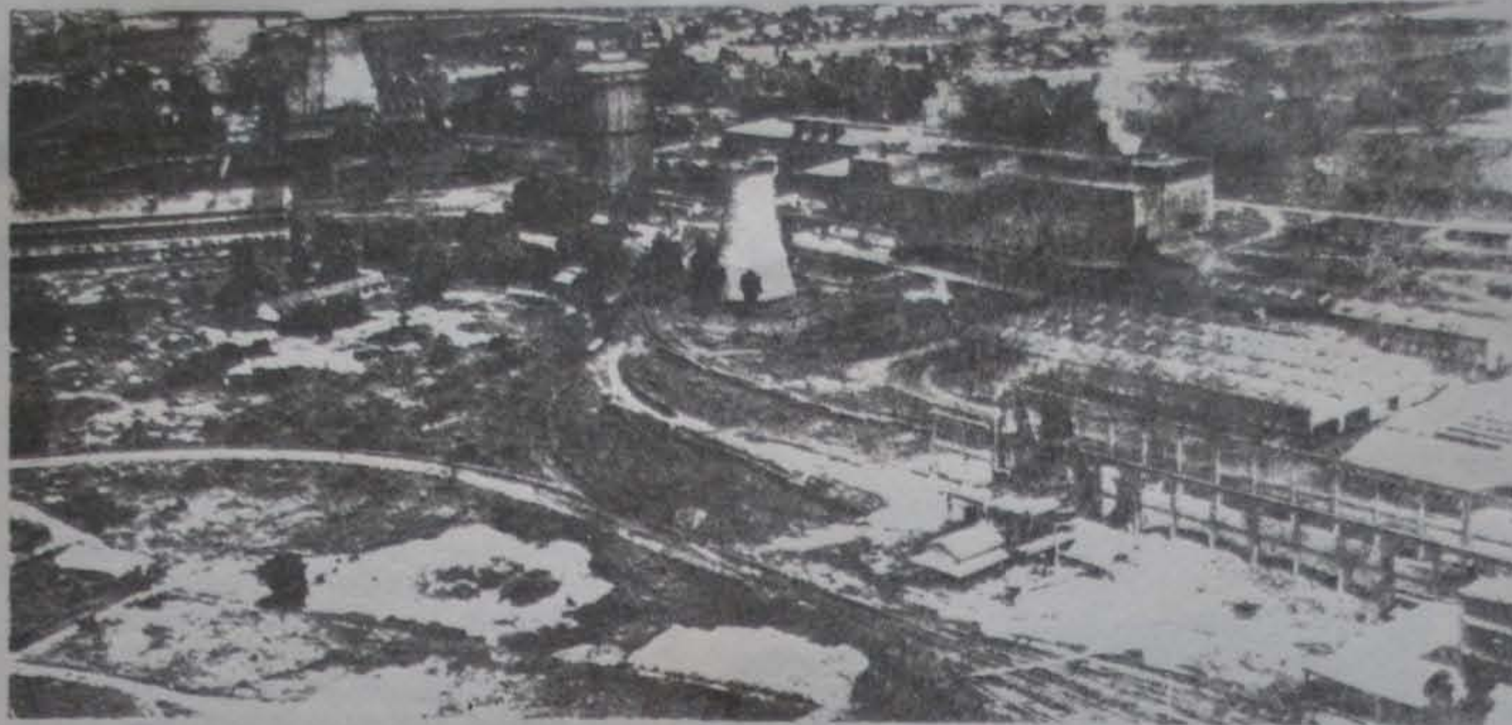
Las obsoletas instalaciones de los Altos Hornos de Zapla.

desapareció y sólo quedó la segunda" resume Ramil Cepeda en la obra citada.