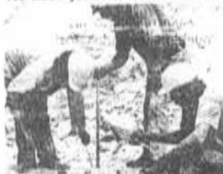
Mineros: se organiza la defensa.