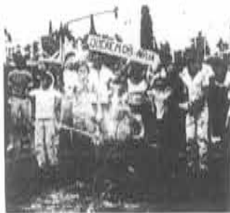
Y en Quilmes no hubo agua

Entretanto, la bronca generalizada que ha ganado a nuestro pueblo y que cada día se hace mayor ante el desquiciamiento capitalista de la patria, se expresa en una nueva ola de movilizaciones obreras y populares. Las huelgas de Sierra Grande y Río Turbio en la Patagonia aplastadas momentáneamente por la bota militar, la huelga de Salto Grande en el Litoral, la movilización nacional de los obreros mecánicos del SMATA, luchas de calles como la de los abnegados y combativos vecinos de Quilmes cuya justa movilización por el problema del agua fue baleada a mansalva por la policía e infinidad de luchas sectoriales como las de YPF, Gas del Estado, Petroleros Privados, Transportistas de Nafta, etc., etc., presentan el alentador panorama de un aguerido pueblo que lejos de amilanarse por la brutal represión militar-policía y paramilitar, pone en movimiento nuevas fuerzas y continúa jaqueando sin pausa a