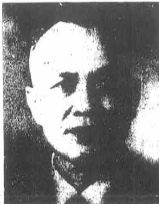
Presidente del Frente Nacional de Liberación Nguyen Huu Tho

La creación de Comités del Frente en las comunas, distritos, provincias y regiones dió lugar a grandes manifestaciones populares que sumaron millones de participantes. Así hacia el fin de 1961 estos últimos habían sido elegidos en todas las comunas y en todos los distritos de las zonas liberadas y disputadas, en 38 de las 41 provincias y ciudades existentes en aquella época, en las 6 regiones del país: Trung Bo central, Trung Bo meridional, Altas Planicies, Nam Bo oriental, Nam Bo central, Nam Bo occidental, así como en la zona especial de Saigón-Giá Dinh. A diferencia de los frentes políticos que, según la concepción clásica, consisten esencialmente en realizar una unión por arriba, el FNL constituyó desde los primeros