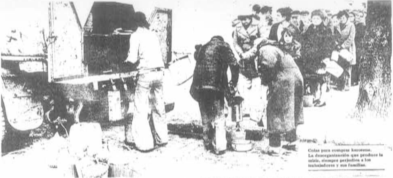
Colas para comprar leonense. La desorganización que produce la crisis, siempre perjudica a los trabajadores y sus familias.

pecuaria exportable requiere también como exigencia de la burguesía terrateniente, un alto nivel de precios para dichos productos. Este objetivo ha sido parcialmente asegurado con los nuevos precios para la nueva cosecha cerealera y la garantía de aumentar los mismos si los "costos", deterioran la "rentabilidad", las ganancias, buscada.