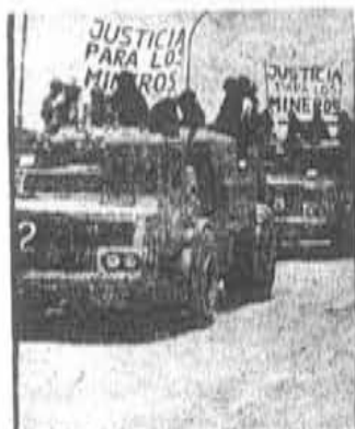
No hubo justicia: sólo lo cárcel.