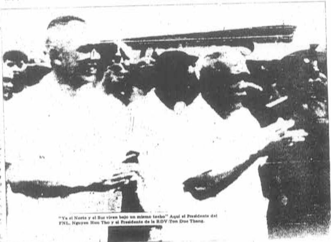
"Ya el Norte y el Sur viven bajo un mismo techo" Aquí el Presidente del FNL, Nguyen Huu Tho y el Presidente de la RDV (Ton Duc Thang).