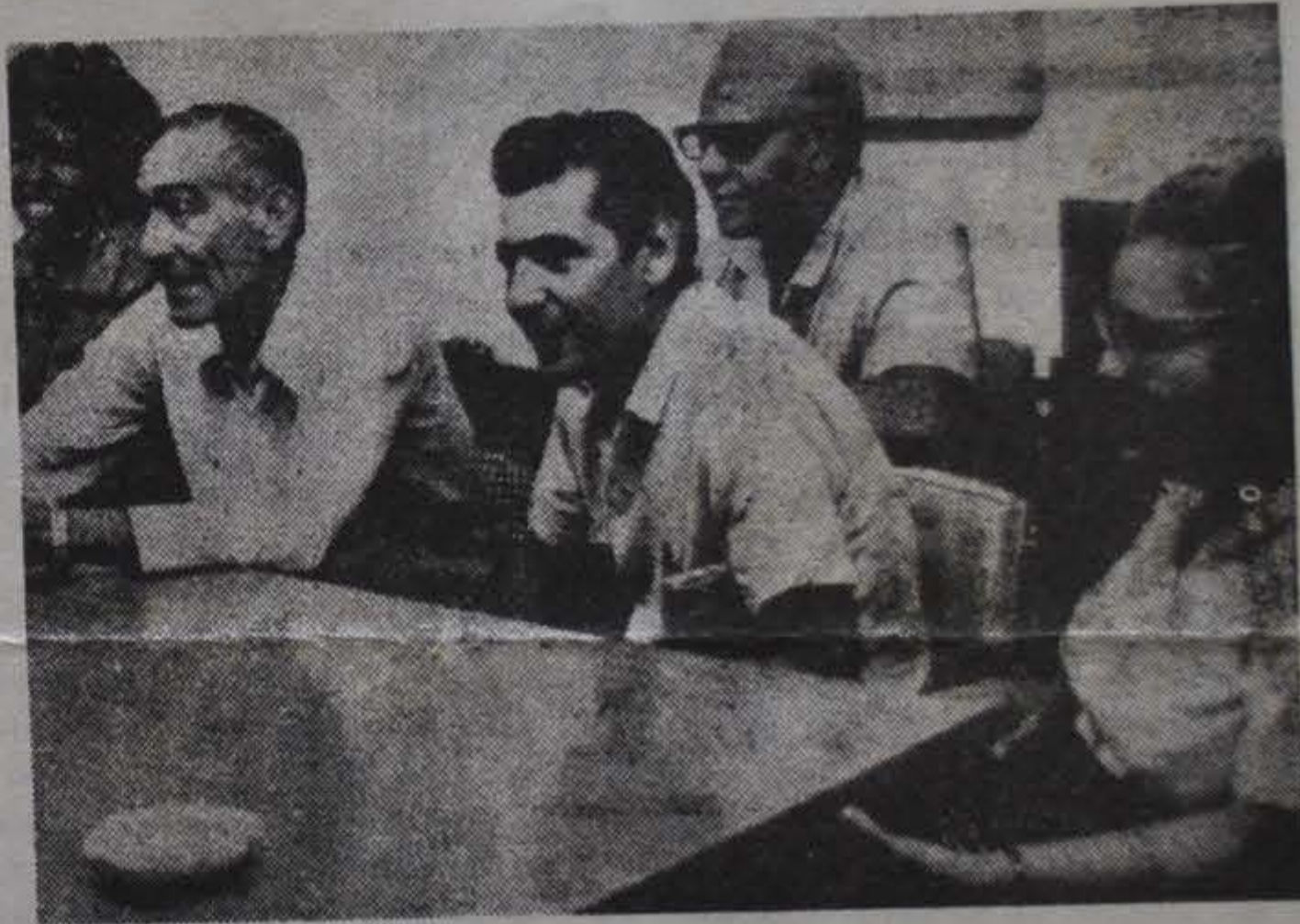
Dos obreros revolucionarios delegados a la Asamblea Provincial

Con motivo de la próxima reunión plenaria del I Congreso del Partido Comunista de Cuba, publicamos en el número anterior de EL COMBATIENTE un artículo a través del cual hicimos conocer a nuestros lectores cómo se van desarrollando en la Isla Socialista los preparativos de tan trascendental e histórico acontecimiento y la reciente realización de las Asambleas Provinciales de Balance, Renovación y/o Ratificación de Mandatos del Partido. Dichas Asambleas Provinciales, las más importantes de los últimos años fueron la culminación de un significativo proceso democrático que partió desde la base del PCC y prosiguió en escala ascendente a las instancias municipales y regionales hasta conformar la candidatura provincial. Allí los delegados partidarios de la clase obrera y el pueblo cubano eligieron a las nuevas direcciones provinciales del Partido, a los precandidatos al Comité Central y a los delegados al Congreso. Para que los militantes de nuestro Partido y nuestros lectores puedan ver más de cerca las características de las Asambleas y por ende del Congreso del PCC, reproducimos en este número, la palabra de algunas de los delegados a las Asambleas, publicadas en los diarios cubanos "GRANMA" y "JUVENTUD REBELDE".