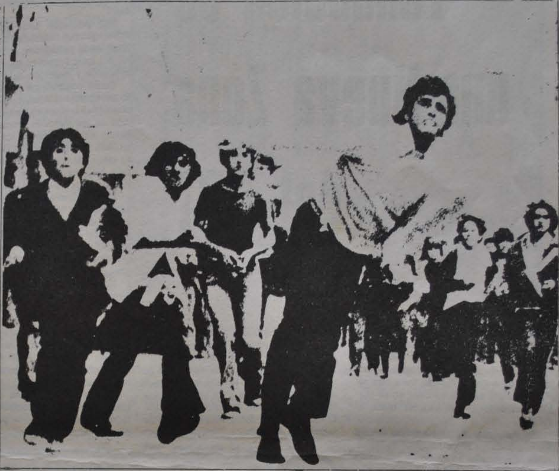
LA RESISTENCIA CHILENA VENCERA

Sobre la sangre de miles de patriotas en la que se cebó el odio de la gran burguesía reaccionaria, la Junta Militar surgida del golpe creó las condiciones para que los monopolios imperialistas y sus socios nativos acentuaran su explotación, para que los grandes intereses monopólicos volvieran a amasar enormes fortunas a costa de la miseria y el sufrimiento de los trabajadores.