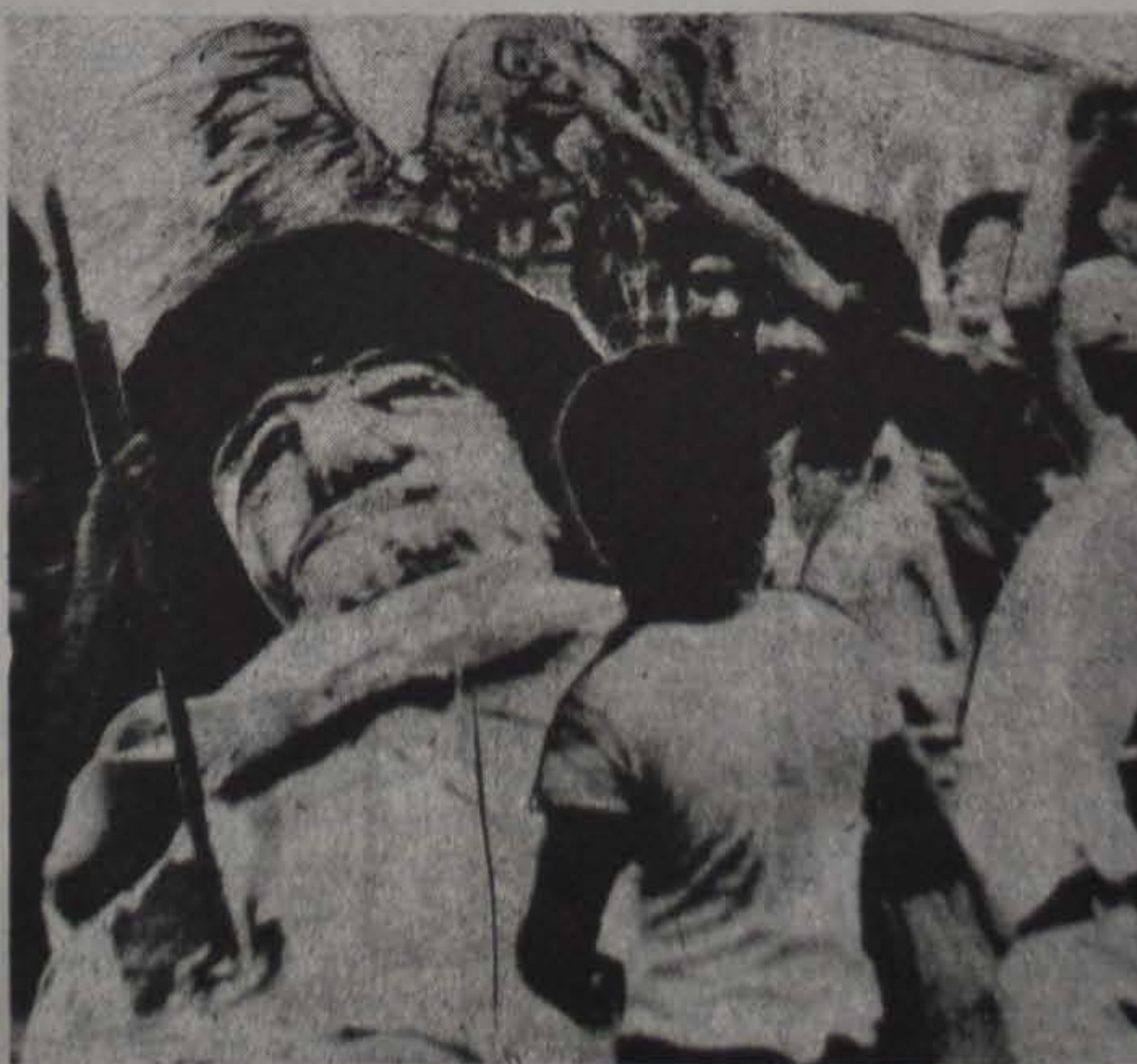
Thailandia. Manifestación popular quemando la imagen simbólica del imperialismo.

Cientos de personas protagonizaron disturbios en el radio céntrico de Nueva York, luego de que se pusieron en vigencia los aumentos en los transportes, medida que forma parte del plan municipal para evitar la bancarrota fiscal de la importante comuna estadounidense. Los indignados ciudadanos paralizaron el tránsito durante horas, voltearon autobuses, y manifestaron en protesta por los agudos aumentos en las tarifas de los subterráneos y los ómnibus. En las estaciones de trenes y subtes, numerosos grupos organizaban el boicót a la medida, indicando a los pasajeros que pasaran por debajo de los molinetes, en lugar de pagar el pasaje. Finalmente, la policía desbarató la protesta popular, mientras procedía a detener a más de 50 rebeldes.