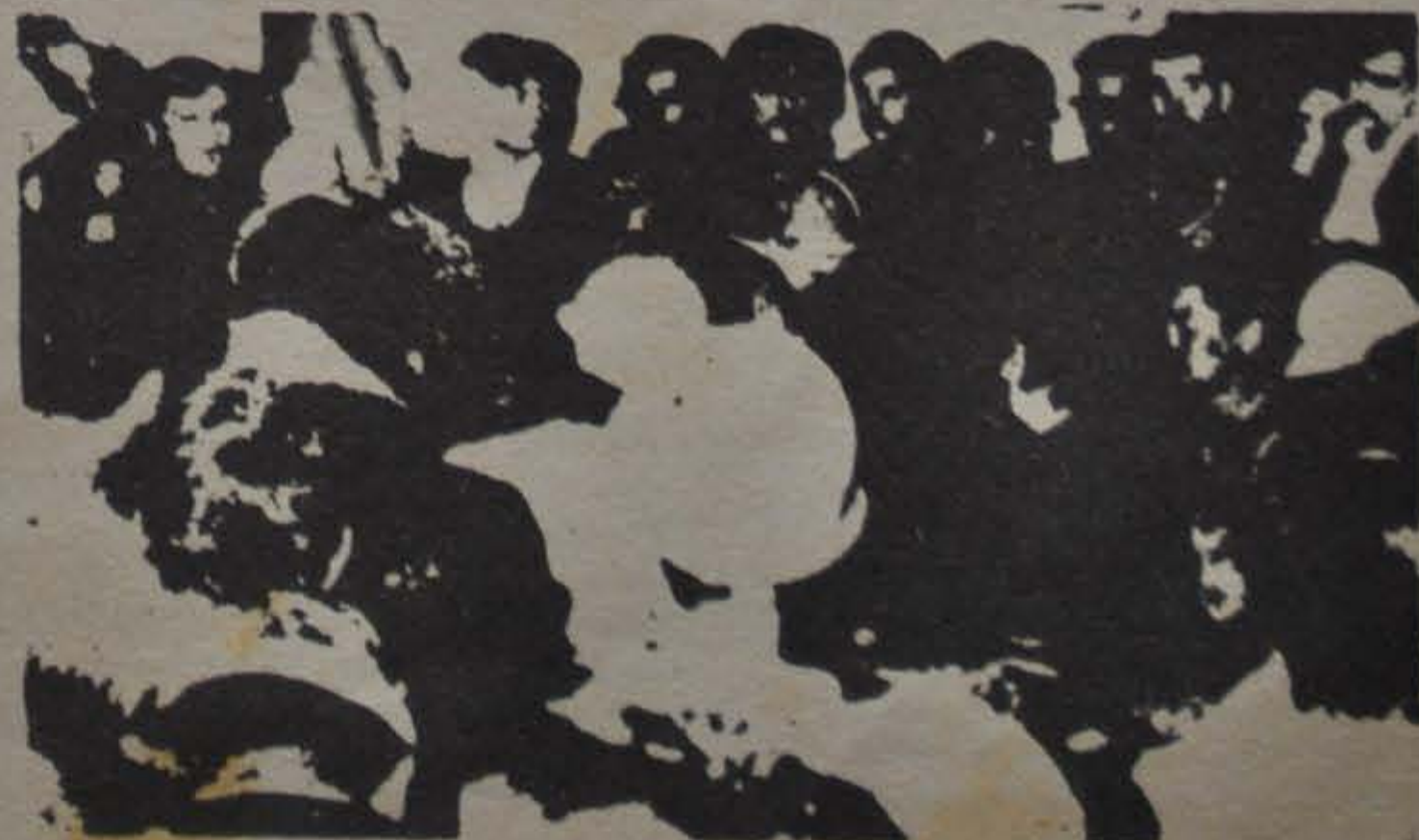
Durante una asamblea cuando se decide pedir mejoras salariales y declarar persona no grata al burócrata del Turco.

Cuando los obreros se enteran de esto exigieron explicaciones y les pidieron la renuncia; quisieron explicar pero fue tal la indignación que tuvo que sacarlos la cana para evitar que la gente los masacre. A pesar de eso, en los 7 días de paro siguen haciendo lo mismo. Van a Salto y obligan a trabajar a la gente, intentando restar fuerzas a la huelga y dividir a los obreros, pero nada han logrado; la unidad férrea y en el transcurso de la lucha se fue consiguiendo primero, el pago del retroactivo y del aumento en la quincena de agosto. Mediante movilizaciones frente al Ministerio de Trabajo se consiguió la reincorporación de los compañeros que habían sido despedidos durante el conflicto. Y finalmente la legalidad del paro y la intimación del Ministerio a que la empresa pague los días caídos, la asistencia perfecta y el porcentual de aguinaldo. En estos momentos se plantea la expulsión deshonorosa de los traidores miembros de la comisión interna.