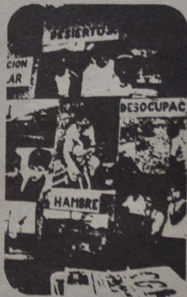
Las consecuencias de la política económica del gobierno.

¿Cuál sería la salida que efectivamente se traduciría en un alivio de la situación, que abriría perspectivas ciertas para superar la crisis económica, por lo menos en el sector externo? ¿Desconocer la deuda externa, romper los lazos que nos atan a los organismos financieros internacionales? Una medida de esa naturaleza, propia de un régimen verdaderamente antimperialista, que busque la independencia económica y política respecto a las metrópolis imperialistas, no puede ser tomada por un gobierno que representa los intereses de la burguesía dependiente.