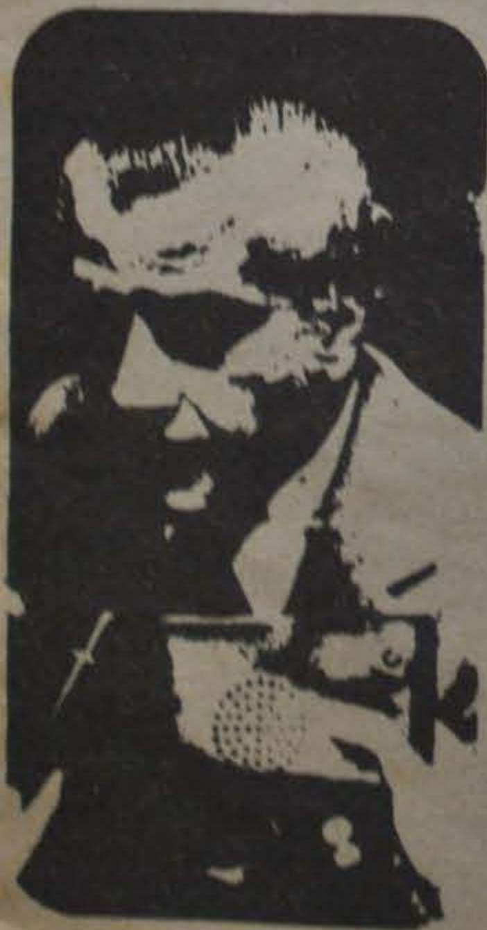
Cafiero a la caza de los dólares.