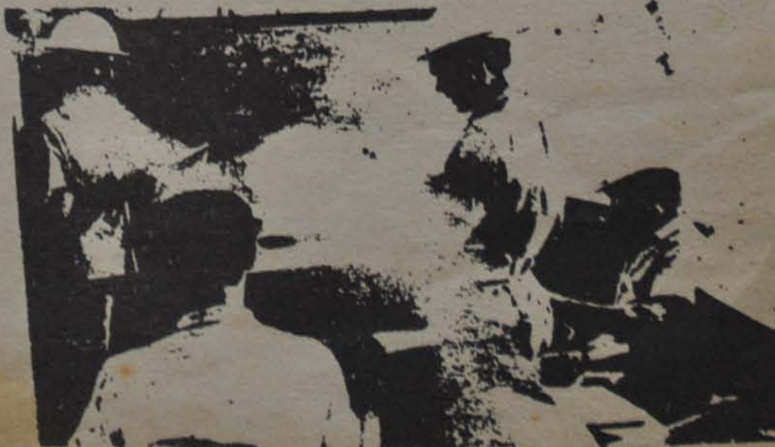
UNA CLASE DE LECTURA ORAL. TRABAJADORES DE LA MICROBRIGADA 'RAUL LUGIOYO' DEL MINAZ

Al basar la educación y la enseñanza en el principio marxista de la combinación del estudio teórico con su aplicación práctica en la producción, la Revolución Cubana va progresivamente eliminando la contradicción entre trabajo manual e intelectual, base de la explotación capitalista. Cuba Socialista da importantes avances en el más significativo campo de la educación de su joven clase obrera, piedra de acero sobre la cual se asienta el pleno desarrollo del Hombre Nuevo y de la Nueva Sociedad.