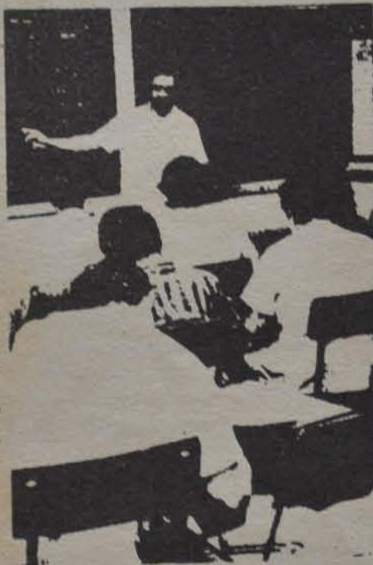
ALUMNOS DE LA FACULTAD OBRERA DE 'CUBANA DE ACERO' ASISTEN A UNA CLASE DE MATEMATICAS

Con ese objetivo funcionan las Escuelas Politécnicas. Un ejemplo de ellas es el Politécnico LUIS PASTEUR, recientemente creado, anexo al Complejo Lácteo de La Habana. Sus 500 alumnos estudian Tecnología General de la Leche, Equipos de la Industria Láctea Hidráulica, Biología y Conocimientos de