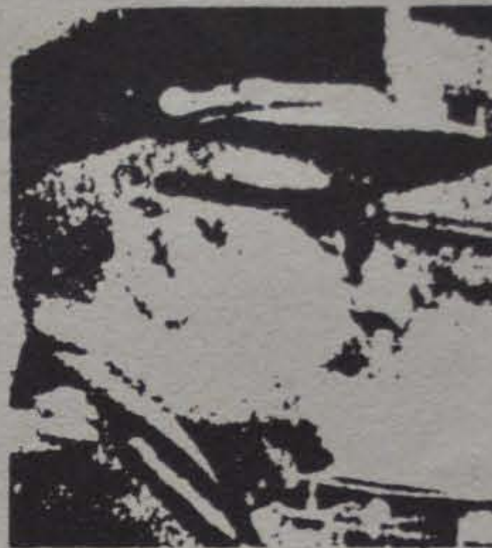
Gral. Numa Laplane

Pero luego de los hechos conocidos, no cabe duda que es sobre el gobierno donde se harán sentir los efectos. Lejos de poder superar la crisis en que se debate desde hace tres meses, la última reorganización ministerial solo ha servido para crearle más dificultades.