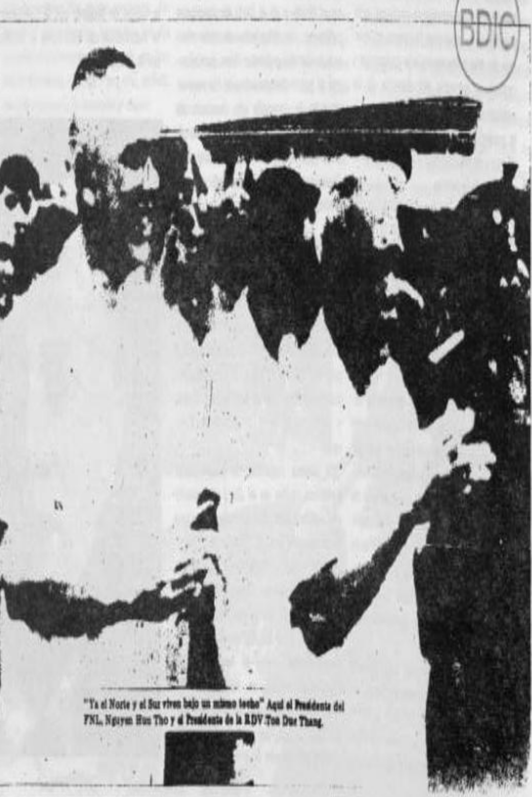
"Ya el Norte y el Sur viven bajo un mismo techo" Aquí el Presidente del FNL, Nguyen Huu Tho y el Presidente de la RVN Ton Duc Thang.