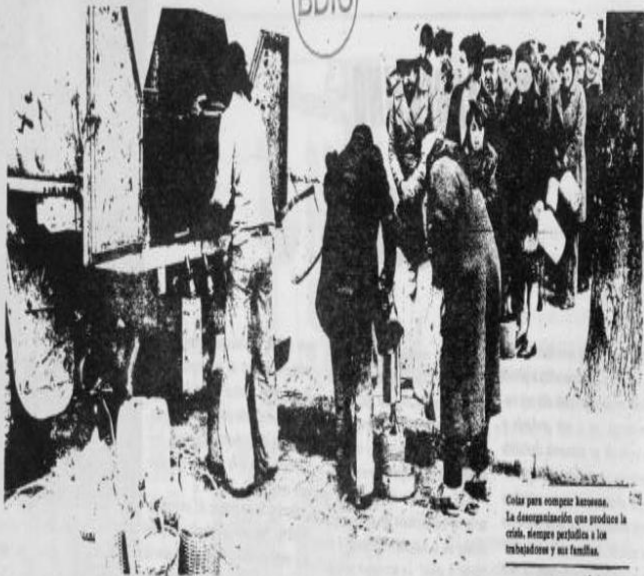
Cozas para empezar kasovna. La desorganización que produce la crisis, siempre perjudica a los trabajadores y sus familias.

pecuaria exportable requiere también como exigencia de la burguesía terrateniente, un alto nivel de precios para dichos productos. Este objetivo ha sido parcialmente asegurado con los nuevos precios para la nueva cosecha cerealera y la garantía de aumentar los mismos si los "costos", deterioran la "rentabilidad", las ganancias, buscada.