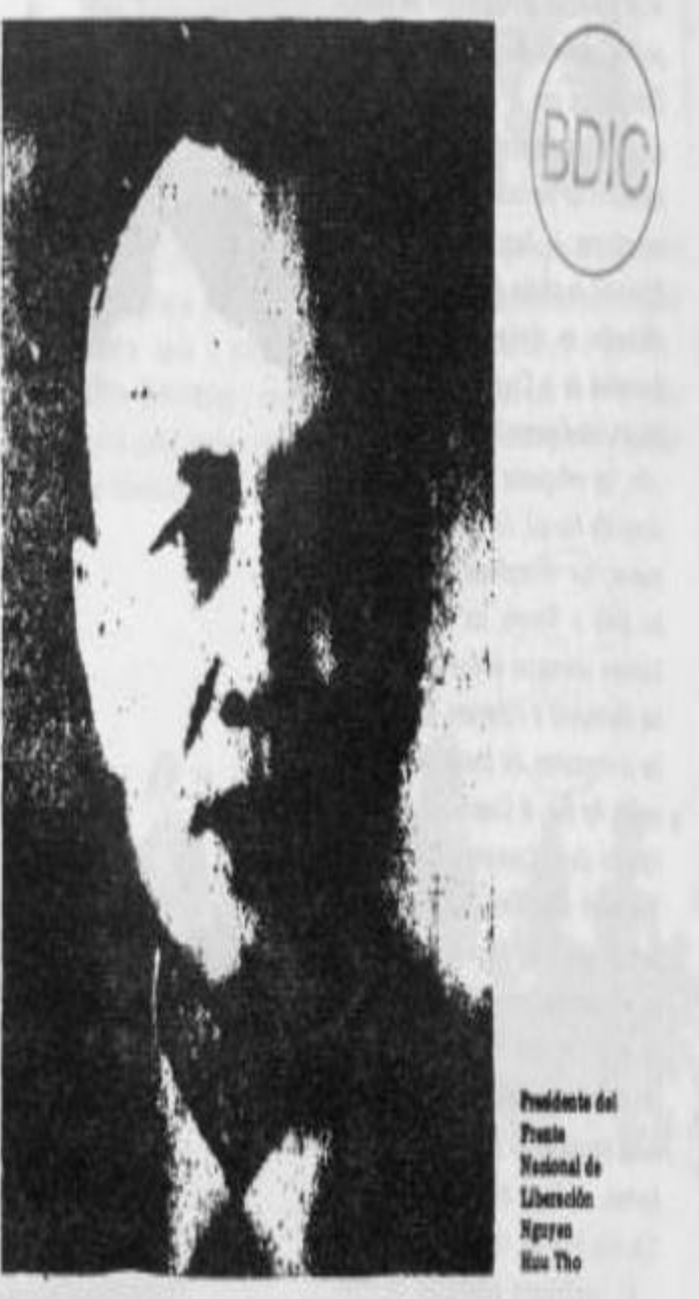
Presidente del Frente Nacional de Liberación Nguyen Huu Tho

La creación de Comités del Frente en las comunas, distritos, provincias y regiones dio lugar a grandes manifestaciones populares que sumaron millones de participantes. Así hacia el fin de 1961 estos últimos habían sido elegidos en todas las comunas y en todos los distritos de las zonas liberadas y disueltas, en 38 de las 41 provincias y ciudades existentes en aquella época, en las 6 regiones del país: Trung Bo central, Trung Bo meridional, Altas Planicies, Nam Bo oriental, Nam Bo central, Nam Bo occidental, así como en la zona especial de Saigón-Gia Dinh. A diferencia de los frentes políticos que, según la concepción clásica, consisten esencialmente en realizar una unión por arriba, el FNL constituyó desde los primeros