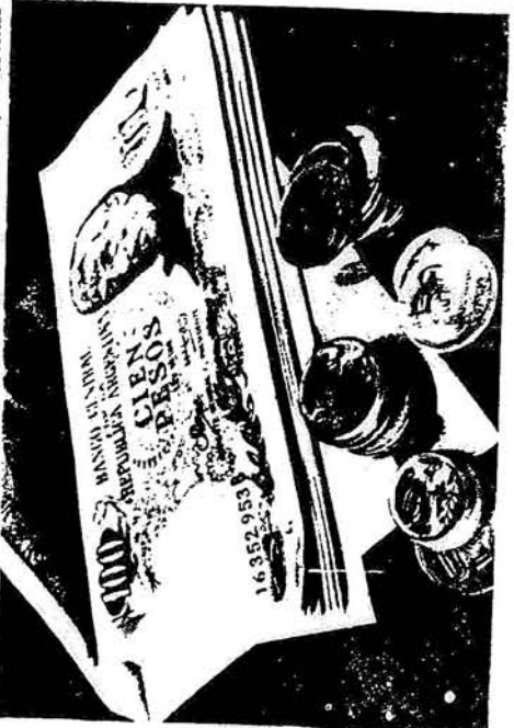
Maquinarias más modernas el futuro y la fuente de trabajo.

Algunas cifras referidas a la producción que se han conocido últimamente, indican que la industria automotriz, el sector más dinámico de la gran industria del país, ha sufrido un descenso en su producción del 34 o/o; es ésta una cifra sin precedentes en la historia de la misma. Si tenemos en cuenta que en torno a las terminales de fabricación y armado que componen