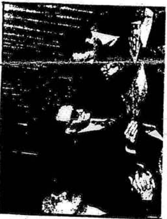
Maestros obreros. Muchos los que se despiden, otros que se quedan, pero todos en un mundo de incertidumbre.

productivas". Los empresarios también muy bien hasta qué punto estas "divididas productivas" dependían del solo imperialista y que absurdo resulta, en el marco del capitalismo que este gobierno defiende, pretender reducir las importaciones a lo más "representable", cuando que el mayor porcentaje de esas compras está representado por máquinas, herramientas, partes insustituibles de distintos procesos de fabricación e inclusive materias primas que la Argentina no produce. Intentar salvar la presión de la deuda externa y obtener salidas de la balanza de pagos más favorables por vía de la reducción de las importaciones, mientras a la par se profundiza la sujeción respecto al amo yanqui y se buscan préstamos e inversiones de ese origen es algo tan contradictorio que solo puede estar inspirado en la más grande de las improvisaciones, en el fracaso de todo otro plan coherente y racional".