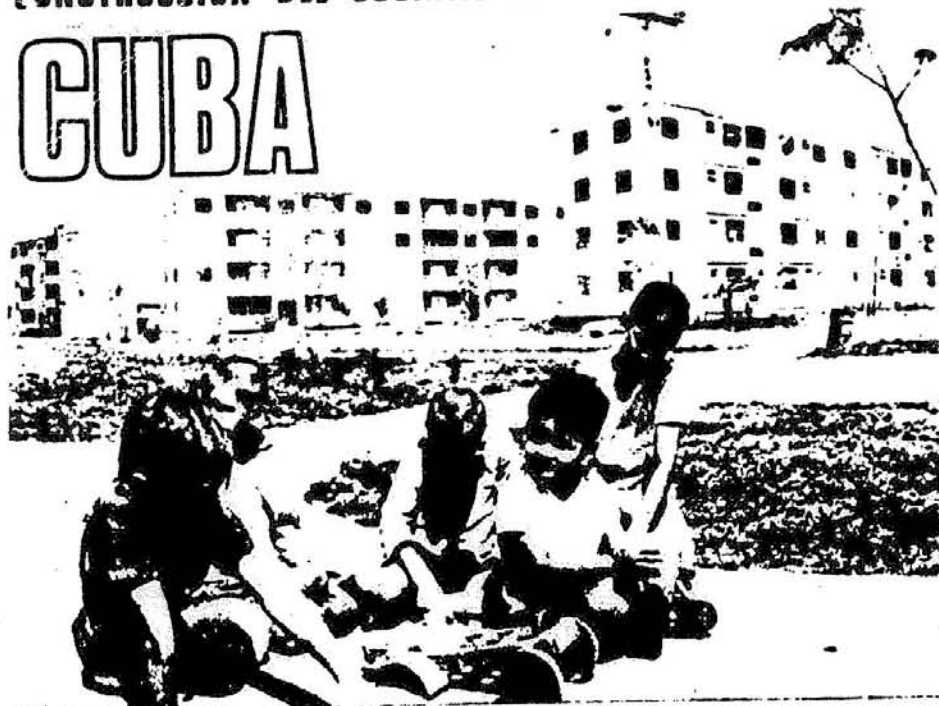
Hijos de campesinos en modernas casas, escuela moderna y con una vida nueva.