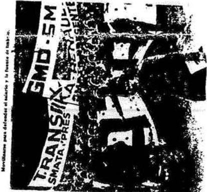
Maquinarias más modernas el futuro y la fuente de trabajo.

productivas". Los empresarios también muy bien hasta qué punto estas "divididas productivas" dependían del solo imperialista y que absurdo resulta, en el marco del capitalismo que este gobierno defiende, pretender reducir las importaciones a lo más "representable", cuando que el mayor porcentaje de esas compras está representado por máquinas, herramientas, partes insustituibles de distintos procesos de fabricación e inclusive materias primas que la Argentina no produce. Intentar salvar la presión de la deuda externa y obtener salidas de la balanza de pagos más favorables por vía de la reducción de las importaciones, mientras a la par se profundiza la sujeción respecto al amo yanqui y se buscan préstamos e inversiones de ese origen es algo tan contradictorio que solo puede estar inspirado en la más grande de las improvisaciones, en el fracaso de todo otro plan coherente y racional".