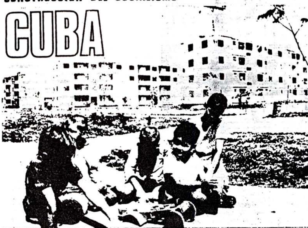
Hijos de campesinos en modernas casas, escuela moderna y con una vida nueva.