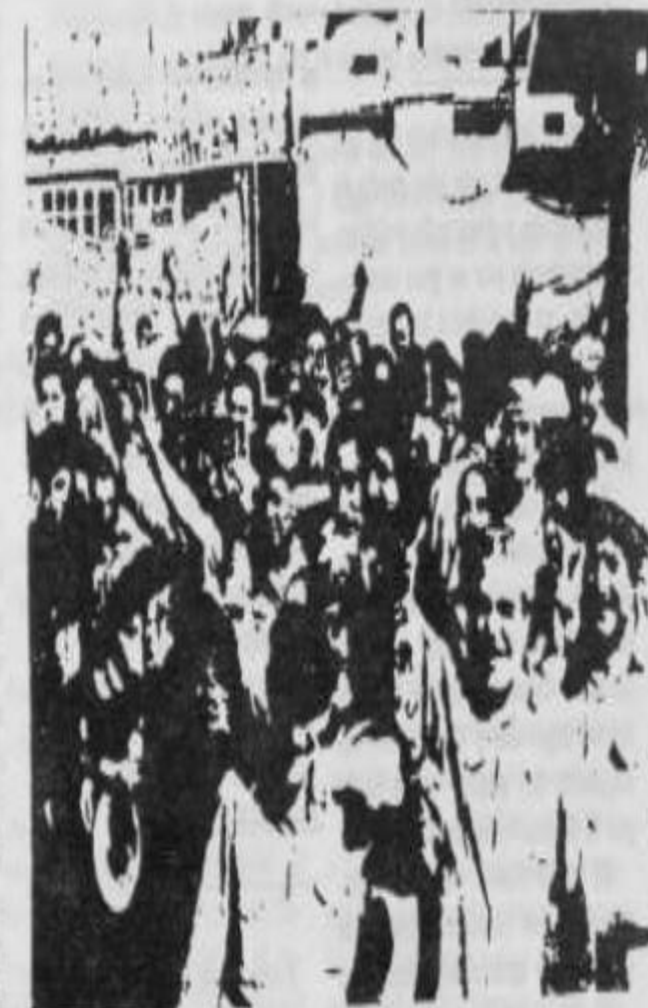
Desafiando una amplia movilización obrero-popular por la libertad de los presos

Hacer conocer a nuestro pueblo cuál es la situación de sus mejores hijos, las razones de su sacrificada lucha, propagandizar en miles de volantes la carta de los prisioneros a la clase obrera y el pueblo donde explican su situación y las reivindicaciones que exigen.