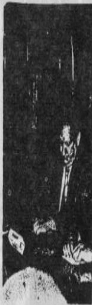
Ministro Otero: dice que no hay tope, pero pide "responsabilidad".

Conciente de la inquietud imperante en las bases obreras, presionada por la multiplicación de los conflictos en de-