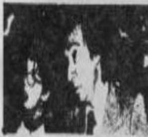
LA BURGUESIA Y EL PROLETARIADO SON LAS DOS CLASES FUNDAMENTALES DE LA SOCIEDAD CAPITALISTA