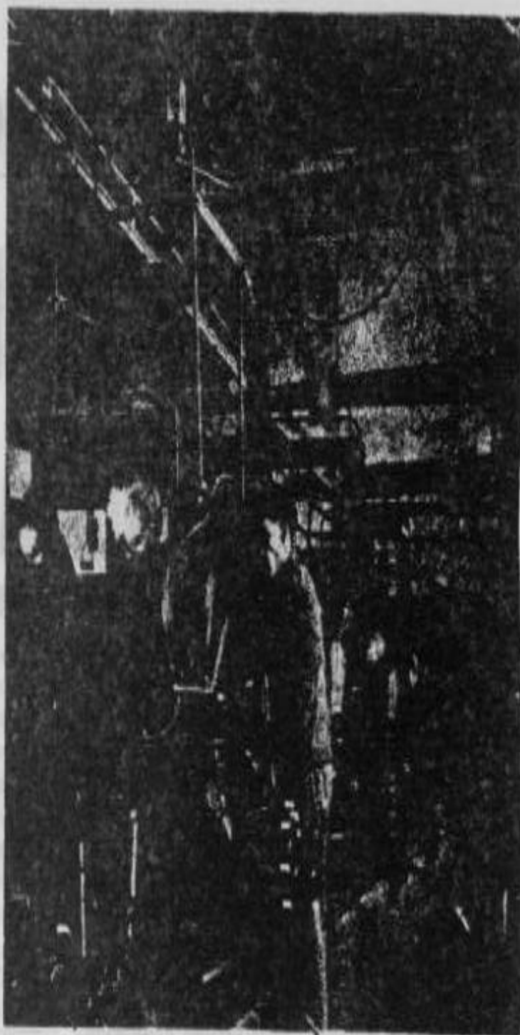
La fábrica de tractores de Kiyang

Al cumplirse el primer año del Plan Quinquenal, la transformación socialista de la economía rural se había realizado en un 95 o/o. Como resultado casi inmediato, fue posible encarar con progresivo éxito la eliminación de las diferencias entre la ciudad y el campo, invirtiendo de esa manera un fenómeno característico de la sociedad capitalista: ciudades que aumentan su población por la gran concentración fabril y de servicios, mientras el campo se despuebla y se empobrece cada vez más.