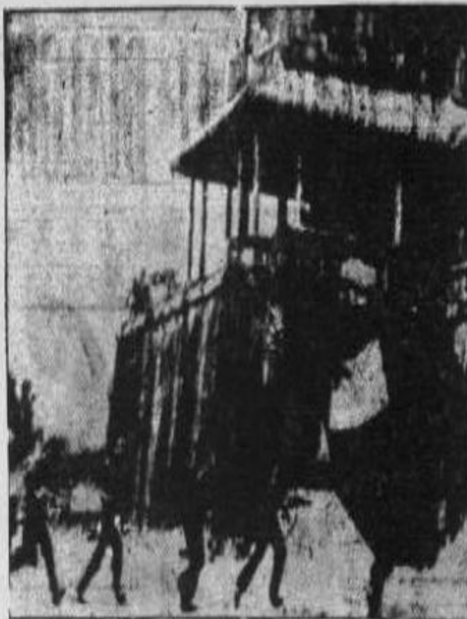
Enarblando la victoriosa bandera del FLN, combatientes de las Fuerzas Armadas de Liberación entran a la carrera en el antiguo palacio imperial de Huế.

La brutalidad inhumana del régimen de Saigón ha llegado al extremo de obligar a la población de los lugares que van ocupando las fuerzas revolucionarias, a abandonar sus hogares llevándolos a la fuerza para inter-