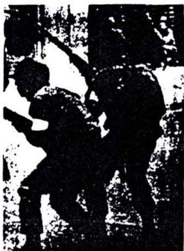
En Chile la vía pacífica hacia el socialismo costó miles de muertos.

rar un ejército cuyas unidades puedan ser tan poderosas como para enfrentar a las fuerzas del imperialismo, es una idea reformista y suicida, es una idea peligrosa que sólo puede traernos la más vergonzosa y fulminante derrota.