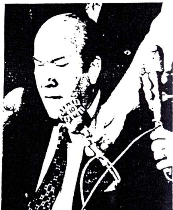
El saldo del intercambio comercial no llega ni a la mitad de los pagos que exige la deuda externa para 1975.