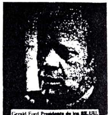
Gerald Ford Presidente de los EE.UU.

Pero no se trata solo del negocio petrolero. En rigor de verdad, todo el capitalismo venezolano ha nacido y se ha de-