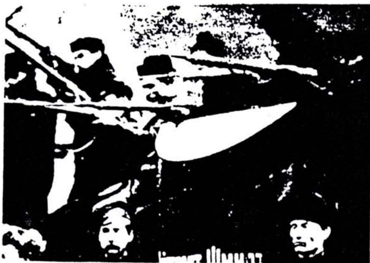
La Revolución Rusa, el surgimiento del primer país socialista en el mundo, se frutó de la insurrección armada del pueblo, dirigida por el Partido Revolucionario.