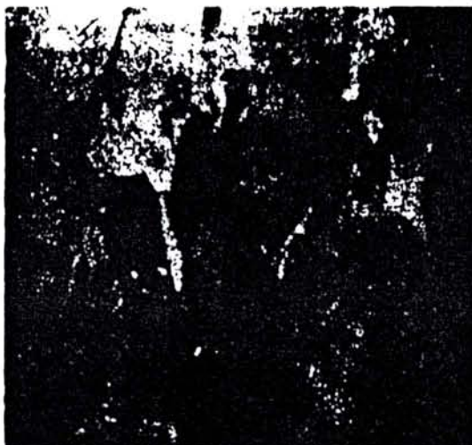
Frente a la ofensiva fascista se produjeron enfrentamientos armados con los mineros.

que incluye a varios jefes militares, desafió al régimen publicando una carta en el diario católico "Presencia", llamando a los militares a tomar posición contra el régimen, al que acusó de promover, con sus medidas, un alza del movimiento popular que luego no podrá ser detenido.