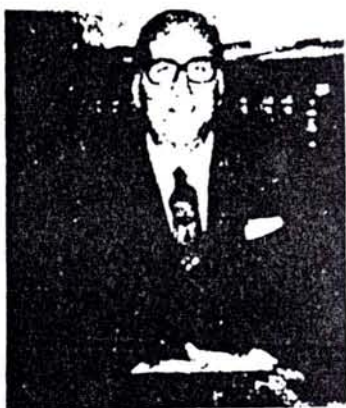
El relevo de Ottalagano por Lyonnet revela la falta de planes serios por parte del gobierno en la Universidad.