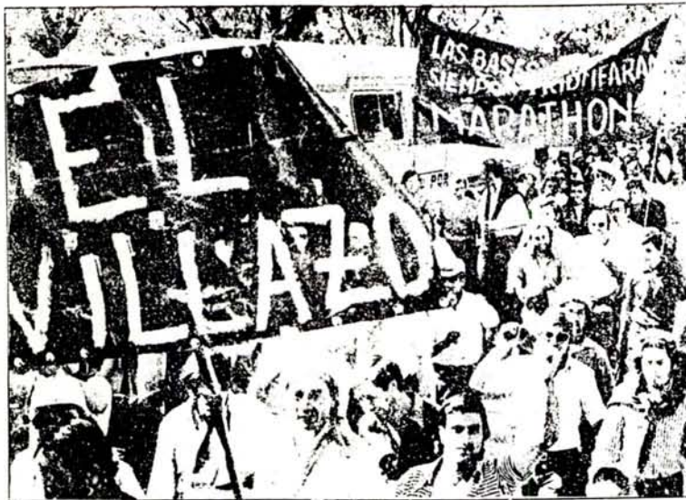
EL AMPLIO TRIUNFO DE LA LISTA MARRON ES LA CONTINUACION DE LAS LUCHAS LIBRADAS EN MARZO POR TODO EL PUEBLO DE VILLA CONSTITUCION

Las urnas sellaron el triunfo de los intereses del proletariado y todo el proletariado y la derrota de la burocracia, del gobierno y de la patronal; con-