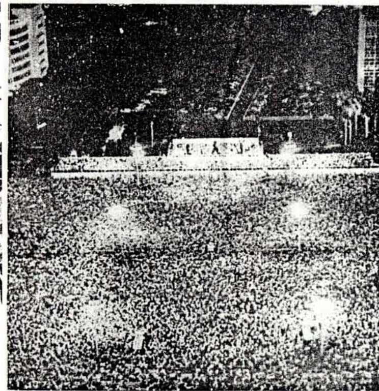
Celebración del XIV aniversario de la creación de los CDR.