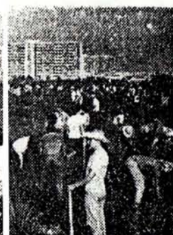
Tanto tareas agrícolas como de construcción son encaradas por los grupos cederistas con igual ímpetu y entusiasmo.