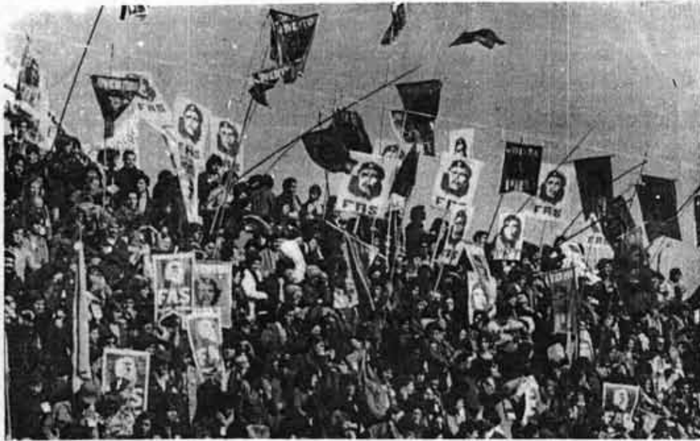
Ante la nueva etapa el FAS resulta una herramienta estrecha, se impone en consecuencia la construcción de un nuevo frente más amplio.

En lo inmediato, debemos centrar nuestros esfuerzos en la consolidación del trabajo legal partidario, en la creación y multiplicación de las organizaciones revolucionarias en el seno de las masas, para acudir a sus luchas políticas, para unir a todas las fuerzas revolucionarias, progresistas y patrióticas tras un programa amplio, antimperialista y democrático, sin una sola concesión principista, pero sin rigidez sectaria.