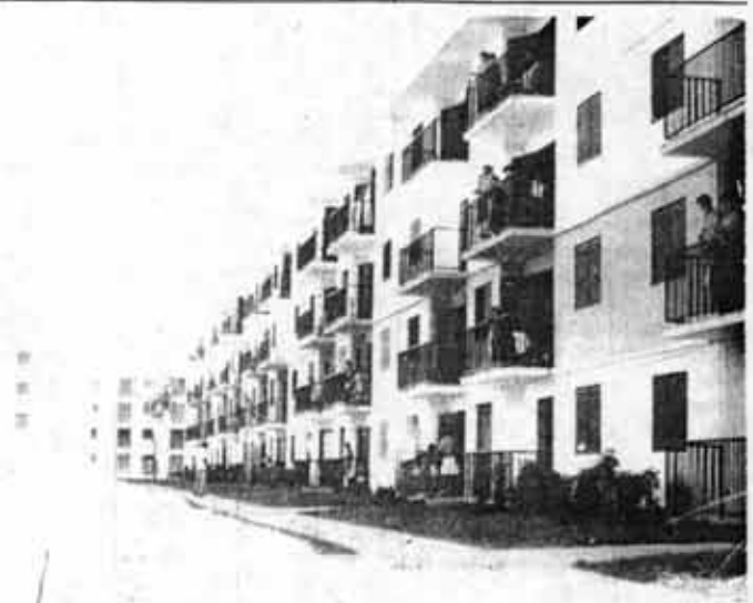
Casas dignas para el pueblo trabajador (viviendas construidas por brigadas de trabajo voluntario).