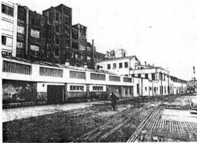
SWIFT: Sería incorporada al sistema de "empresa de propiedad social".