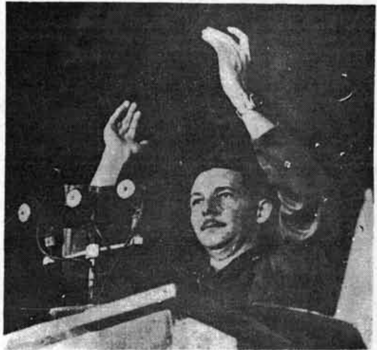
COMANDANTE RAUL CASTRO SEGUNDO SECRETARIO DEL PARTIDO COMUNISTA CUBANO

"No se trata desde luego, que la revolución y sus dirigentes hayamos estado en ningún momento por encima del pue-