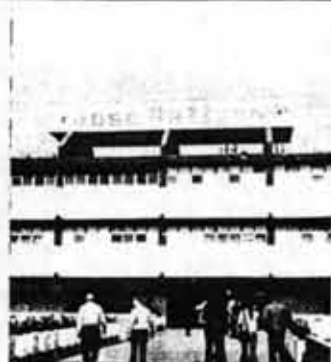
La educación gratuita al alcance de todo el pueblo es otro de los logros de Cuba socialista.