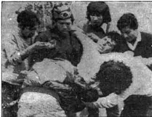
El gobierno fascista de Banzer desató una violenta represión contra la movilización campesina en Cochabamba.

La formación de un gabinete estrictamente militar significa, entonces, el propósito de replantear un sistema que permite reunificar a la burguesía para cumplir el programa de "brasileñización". Se ofrece, por tanto, un plan de institucionalización (remedo de la