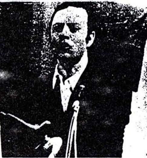
COMPAÑERO VAN SCHOWEN: ¡HASTA LA VICTORIA SIEMPRE!

Su nombre pasará a engrosar las listas de los revolucionarios que ya han dado sus vidas por la revolución socialista en América.