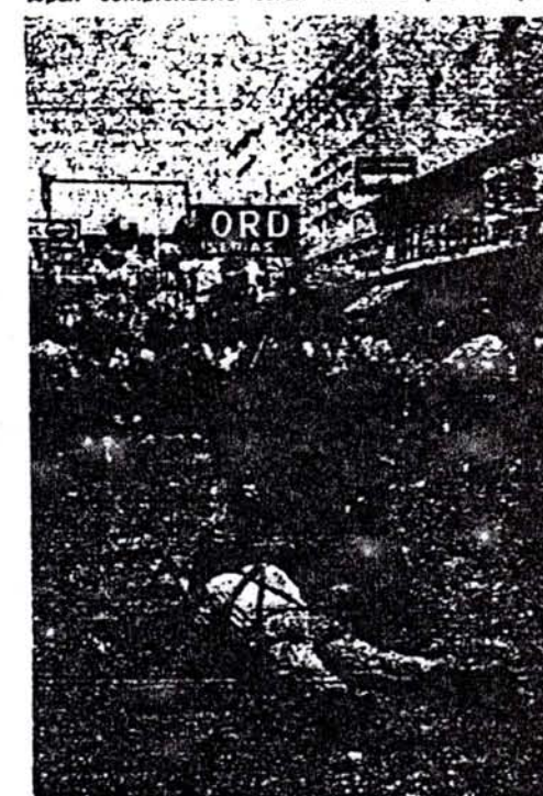
LAS ARMAS DE LA POLICIA APUNTANDO CONTRA EL PUEBLO.

No permitirse una sola vacilación más, una sola concesión más a las vanas ilusiones de soluciones pacíficas y de cambios incruentos. El sendero de la guerra se está ensanchando y nuestro pueblo marchará por él con decisión, seguro de la victoria final. Los que no sepan comprenderlo serán barridos por su paso.