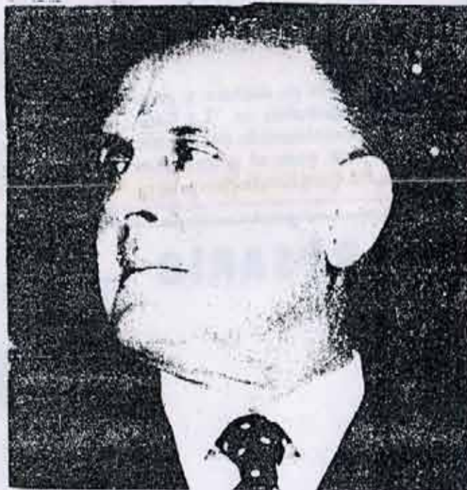
Ministro Llambi, Preside el nuevo Consejo de Seguridad. Su tarea es reprimir al pueblo para garantizar las ganancias monopolistas.