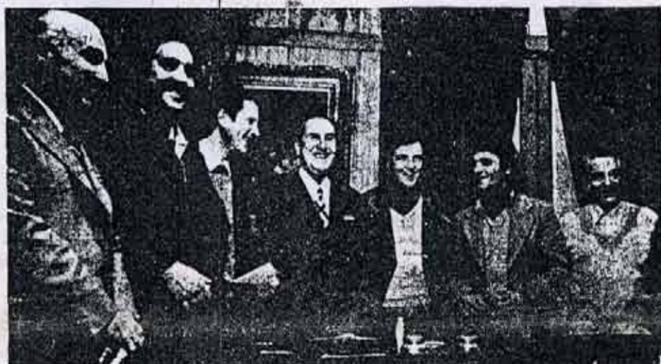
Los dirigentes de JP sostenían haber roto "el cerco de Lopez Rega". En esa reunión Perón designo a Lopez Rega para atender a la Juventud.

Desde hace tiempo, nuestro Partido viene caracterizando las contradicciones internas del Movimiento Peronista, advirtiendo sobre la inevitabilidad de su ruptura. A la par que alentando a los sectores mas lúcidos y consecuentes del peronismo revolucionario a la unidad y a la lucha señalando fraternalmente sus errores a otros sectores del mismo.