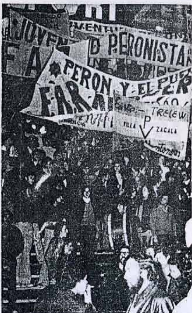
El acto del 22 de agosto en Atlanta; una muestra del carácter no unitario de la política de los movimientistas.

"16. Es un deber patriótico para todos los argentinos, peronistas o no, civiles o militares, ... estrechar filas junto al Gral. Peron luchando por la bandera de 'Peron Presidente' para la Reconstrucción y Liberación Nacional".