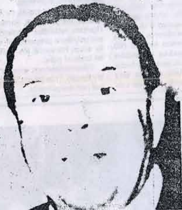
Embajador Hill: hombre de la CIA y de los monopolios.

¡Qué lejos, en verdad, han quedado las promesas nacionalistas de la campaña de marzo y que parecidos a Lanusse han resultado estos liberadores que hoy intentan el poder!