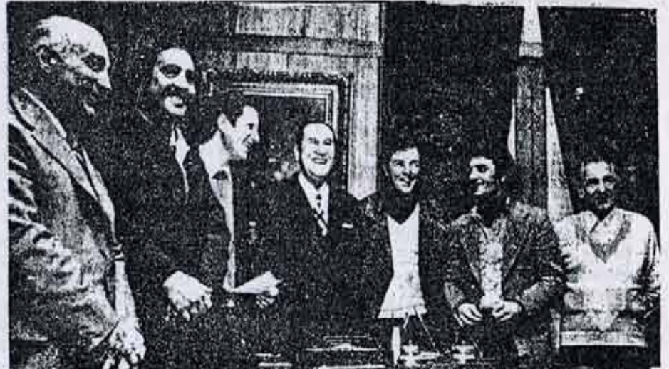
Los dirigentes de JP sostenían haber roto "el cerco de López Rega". En esa reunión Peron lo designó para atender a la Juventud.