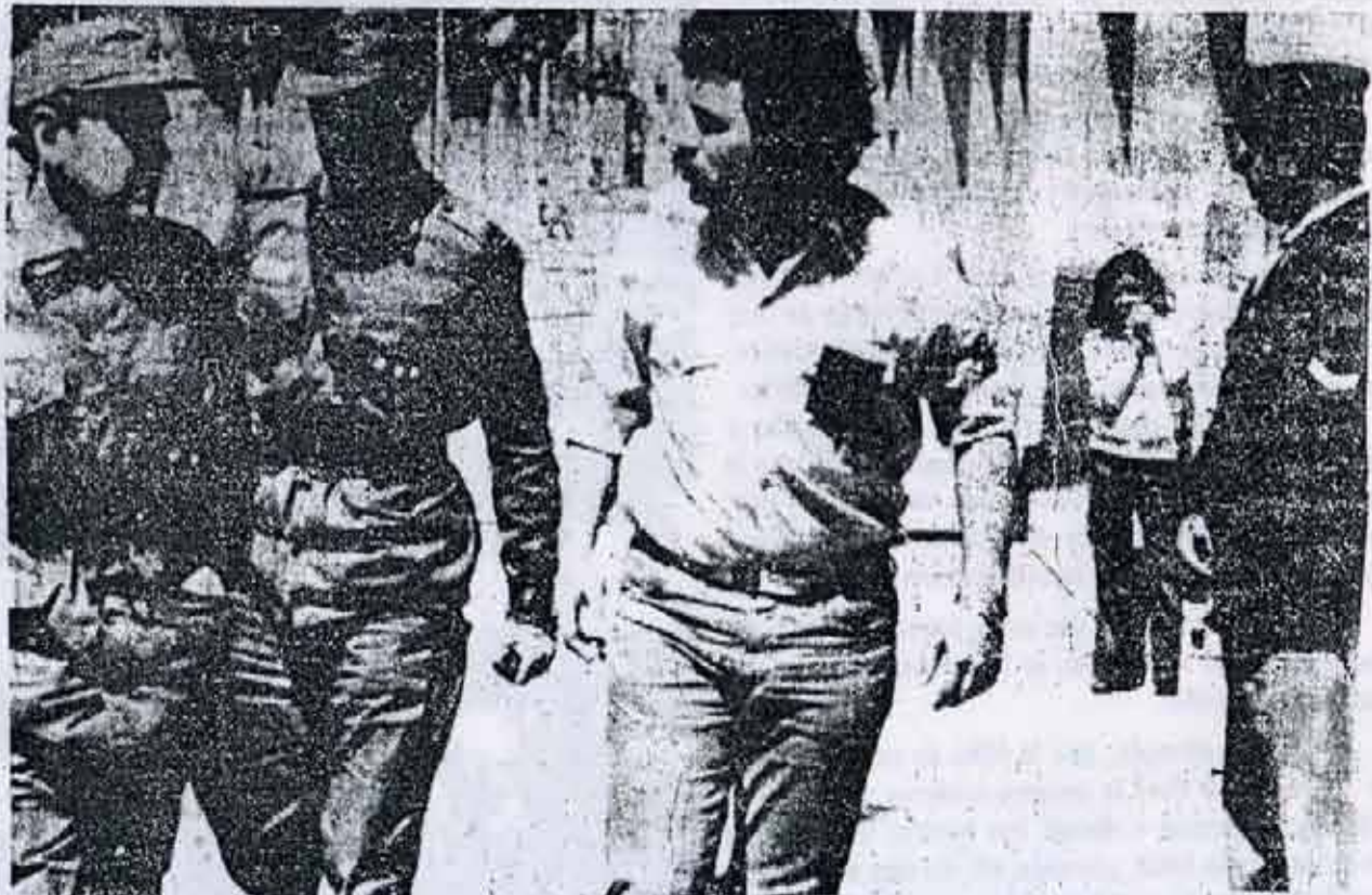
El Operativo Dorrego ilustra las concesiones del Movimientismo a las FF.AA. contrarrevolucionarias al prestar su colaboración al plan de los militares que quieren mejorar la imagen del ejército ante las masas.

No es imposible que se altere esta relación de fuerzas, no es imposible que los sectores obreros asuman posiciones de clase y que una parte de los sectores no obreros se subordinen a ellos, se transformen en aliados conscientes y útiles de la clase obrera.