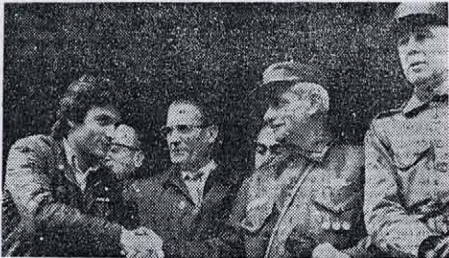
La figura del represor del Cordobazo y torturador de combatientes 'embellecida' como antimperialista.