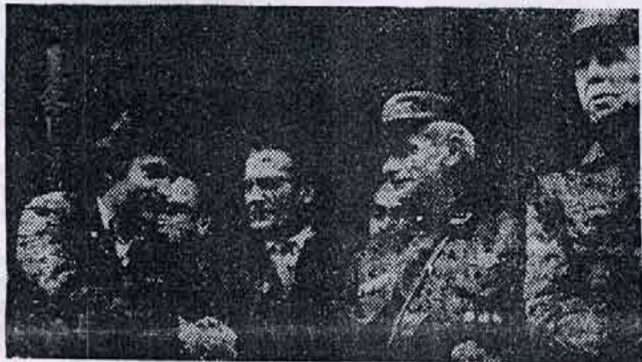
La figura del represor del Cordobazo y torturador de combatientes 'embellecida' como antiimperialista.