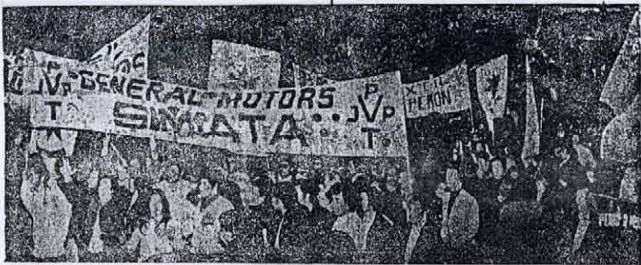
Una de las pocas veces en que se movilizaron independientemente del Peronismo burgués, fue en el acto contra la Ley de Asociaciones Profesionales. Al final sus diputados terminaron votándola.

"Quien conduce es Peron. O se acepta esa conducción o se esta fuera del movimiento".