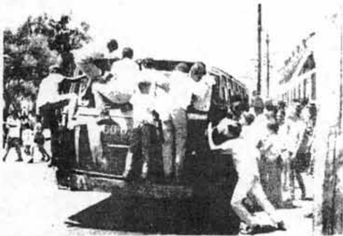
SANTIAGO DE CUBA, 1970

Para adiestrarlos en el manejo de estos equipos se creó una escuela, que hoy continúa