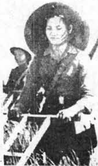
VIETNAM: El pueblo debió enfrentarse a un ejército poderoso, el yanqui. Sólo la guerra popular revolucionaria prolongada es garantía de su gloriosa victoria.

"La revolución proletaria no sigue una línea recta. Progresará a través de los flujos y de las victorias parciales, de los reflujos y de las derrotas temporales. La victoria