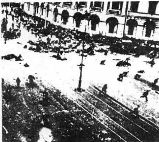
Enfrentamiento entre manifestantes revolucionarios y la represión: San Petersburgo. Julio de 1917.