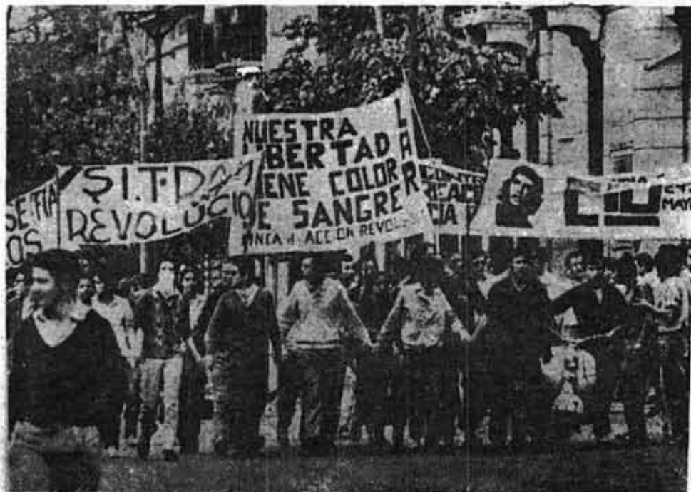
EL CORDOBAZO: Una insurrección parcial que abrió la etapa histórica de la guerra revolucionaria en nuestro país.

* "Revolución y contrarrevolución en Alemania", tomado de "La insurrección armada".