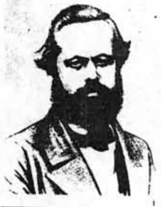
CARLOS MARX: fundador del Socialismo Científico. Fue un ejemplo de actividad y de vida revolucionaria.

En la lucha contra la burguesía, en el seno mismo de la lucha de clases, se inscribe como una necesidad impostergable el manejo de la teoría revolucionaria. "Sin teoría revolucionaria no puede haber tampoco movimiento revolucionario". (Lenin)