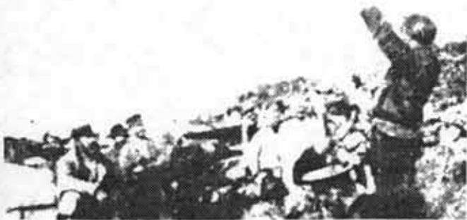
Un comité popular en Rusia durante el año 1917. Allí se aplicaron las experiencias de 1905.

Pero esta dinámica insurreccional del movimiento de masas, no se da necesariamente en todo tiempo y lugar. Son necesarias determinadas circunstancias concretas, que tienen que ver con la relación de fuerza entre las clases, con la experiencia acumulada por