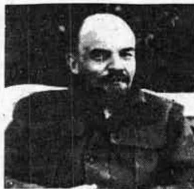
LENIN: "Sin teoría revolucionaria no puede haber tampoco movimiento revolucionario"

Es imprescindible ganar al pueblo para extender y consolidar la organización. La tarea de la formación política de las masas no debe ser postergada. Debemos aprender de los vietnamitas que, en situaciones sumamente difíciles y con una persecución encarnizada por parte de los contrarrevolucionarios, supieron encontrar la forma y valerse de los medios, para construir equipos móviles de educación política, a los que acudían los trabajadores y trabajadoras de los pueblos y aldeas. El mismo Ho Chi Minh enseñaba a los militantes y campesinos. Muchos de los que acudían a estos cursos, y sobre todo las mujeres, no conocían la lengua vietnamita. Los revolucionarios se vieron precisados a aprender los distintos dialectos y a valerse de dibujos, ya que no tenían otras formas de comunicarse; para hacerles comprender cómo los franceses y los japoneses explotaban al pueblo, para hacerles comprender la necesidad de la unión nacional para enfrentar a los colonialistas, para hacerles comprender cómo los campesinos morían aplastados bajo el peso de los impuestos y para que al fin, vieran la necesidad del trabajo clandestino y de la preparación para la insurrección armada. Todas estas escuelas florecieron en la jungla vietnamita y fueron el lugar de formación de miles y miles de militantes que luego a su vez se convertían en núcleos de extensión del movimiento.