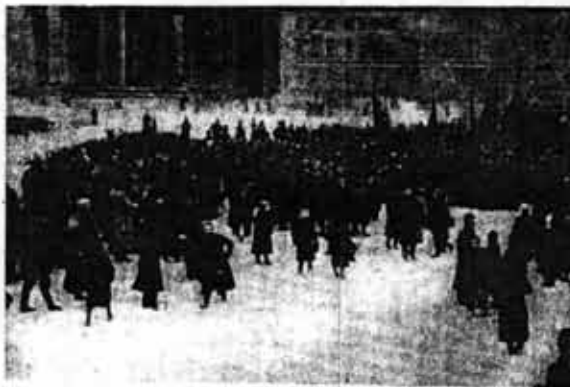
1905. La insurrección de Moscú. Primer gran ensayo de la Revolución Rusa. La clase obrera y el partido revolucionario acumularon grandes experiencias.

¿Alguien puede dudar de que el capitalismo imperialista ha llegado ya a ese período de aguda crisis económica y política, no sólo en nuestra patria sino en todo el mundo colonizado y dependiente, en toda África, Asia y América Latina? Ya nuestro Comandante Che Guevara lo definió con claridad: "En definitiva, hay que tener en cuenta que el imperialismo es un sistema mundial, última etapa del capitalismo y que hay que batirlo en una gran confrontación mundial. La finalidad estratégica de esa lucha debe ser la destrucción del imperialismo. La participación que nos toca a nosotros, los explotados y atrasados del mundo, es la de eliminar las bases de sustentación del imperialismo: nuestros pueblos oprimidos, de donde extraen capitales, materias primas, técnicos y obreros baratos." "Los pueblos de tres continentes observan y aprenden su lección en Viet-nam. Ya que, con la amenaza de guerra, los imperialistas ejercen su chantaje sobre la humanidad, no temer la guerra es la respuesta justa. Atacar dura e ininterrumpidamente en cada punto de confrontación debe ser la táctica general de los pueblos". *