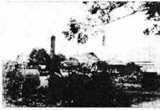
Los industriales dueños de ingenios, imponen los precios de la caña, en perjuicio de los cañeros chicos y medianos

Es el mismo Censo Cañero de 1971, el que nos dice que más o menos siete mil cañeros, tienen fincas que no pasan de 100 surcos; que más de cuatro mil campesinos cañeros tienen fundos de entre 101 y 200 surcos y que otros