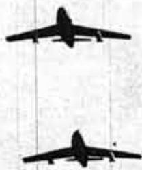
El moderno armamento de las Fuerzas Armadas sólo sirve para reprimir al pueblo.

Hacemos un llamado a todos estos sectores, a la par que decimos que a las FF.AA. contrarrevolucionarias, al servicio de la burguesía y el imperialismo no hay que integrarlas sino que hay que desarmarlas.