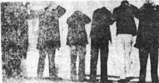
Los detenidos, luego del ataque, que curiosamente una hora más tarde recuperaban su libertad.

Queda claro con todo esto cuáles son los objetivos y métodos del enemigo. Los compañeros de Luz y Fuerza marcaron también claramente el método para enfrentarlo: movilización constante y respuesta armada a la agresión armada. El armamento de los obreros constituye en este momento un aspecto esencial de sus movilizaciones y luchas.