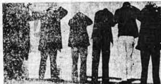
Los detenidos, luego del ataque, que curiosamente una hora más tarde recuperaban su libertad.

Queda claro con todo esto cuáles son los objetivos y métodos del enemigo. Los compañeros de Luz y Fuerza marcaron también claramente el método para enfrentarlo: movilización constante y respuesta armada a la agresión armada. El armamento de los obreros constituye en este momento un aspecto esencial de sus movilizaciones y luchas.