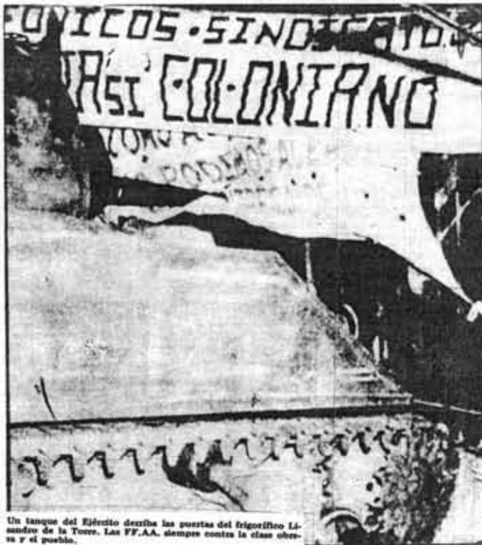
Un tanque del Ejército destruye las puertas del frigorífico Lisandro de la Torre. Las FF.AA. siempre contra la clase obrera y el pueblo.