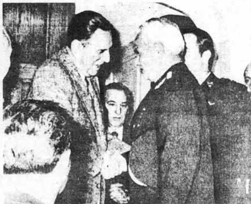
Este apretón de manos entre Perón y Carragno será histórico. El líder peronista y el jefe de las FF.AA. contrarrevolucionarias sellan el Gran Acuerdo contra el Pueblo.