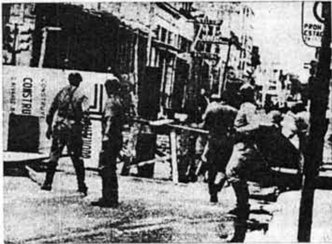
Las FF.AA. en su función de cuidar el "orden": el orden de los explotadores, claro está.

coronada con la aparición del "partido militar". ¿Y durante el gobierno de éste? Recordemos como cumplieron el papel de policías y su intervención activa en la represión popular a partir del Rosaríazo y Cordobazo, recordemos los rastillos, las ocupaciones de fábricas por parte del ejército, como cuando obligaron a trabajar a los obreros de Sitrac-Sitram a punta de bayoneta, y su participación directa en las torturas y en la dirección y control de los campos de concentración donde se encerraba al pueblo. Recordemos por último a los compañeros fusilados en Trelew por la Marina.