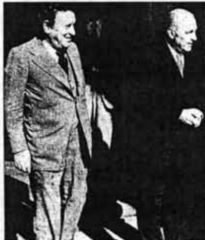
La burocracia sindical y la derecha peronista son las bases del nuevo gobierno

ESCRIBE EL SECRETARIO GENERAL DE NUESTRO PARTIDO: MARIO ROBERTO SANTUCHO