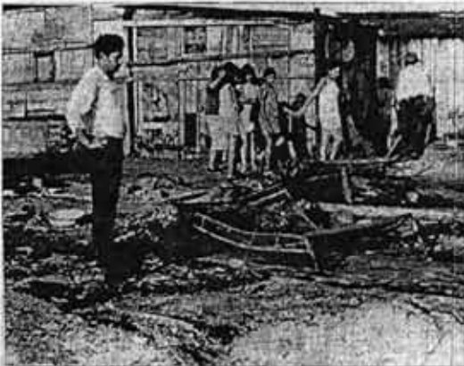
Villa: Para los que viven aquí la "liberación nacional" no puede consistir en cambiar patrones extranjeros por nacionales.

Como dijimos antes, la concentración monopolista de los capitales escapa a las fronteras nacionales y organiza todo el mundo como un único mercado capitalista.