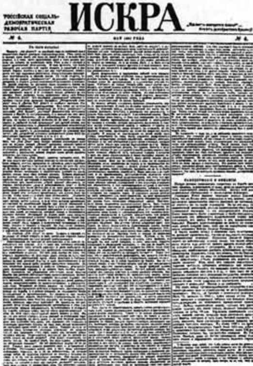
Con este periódico: ISKRA (Chicla) los bolcheviques comenzaron a preparar el 'incendio' revolucionario

tivo. De ahí la necesidad de un periódico único a nivel nacional que refleje a todos los lectores, la totalidad que es el partido, y amplíe el horizonte de los obreros, más allá de su trabajo puramente local.