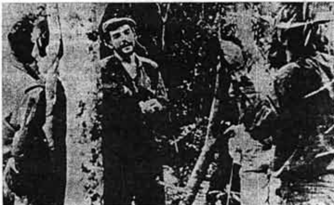
CHE: La guerrilla marca en América Latina el único camino real para la liberación.

Diez años después, en la Guerra Civil Española (1936-39) el proletariado sería aplastado por la reacción fascista de Franco. Su debilidad provino fundamentalmente de su subordinación a los gobiernos burgueses de la República.