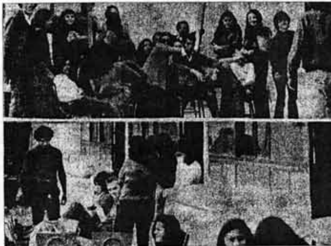
La Universidad Católica santiagueña ocupada por los estudiantes.

Finalmente, marquemos las tareas futuras que se plantean, que enmarcándolas en la continuación de las luchas pasadas pueden dar frutos positivos y principalmente, la creación de una Universidad estatal amplia estatizando la UCSE, e incorporando a la misma a los profesores nacionales y provincial y la Facultad de Ingeniería Forestal.