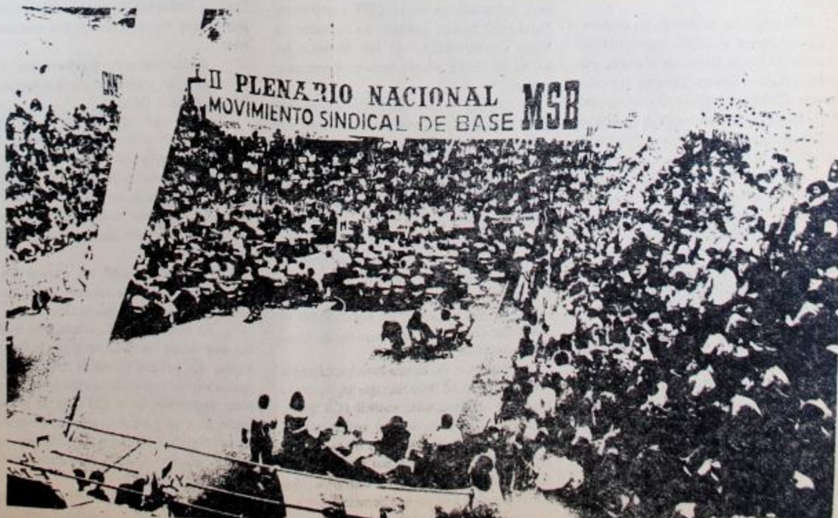
Un aspecto de la combativa y numerosa concurrencia del 2o. plenario nacional del MSB.

EN LO REIVINDICATIVO PERMANENTE Luchar por: -La derogación de toda nueva legislación represiva . . . -El ejercicio de la democracia sindical. . . -Por una vivienda digna para la clase trabajadora. -Plena vigencia de las libertades de reunión, de expresión, de prensa y demás libertades democráticas.