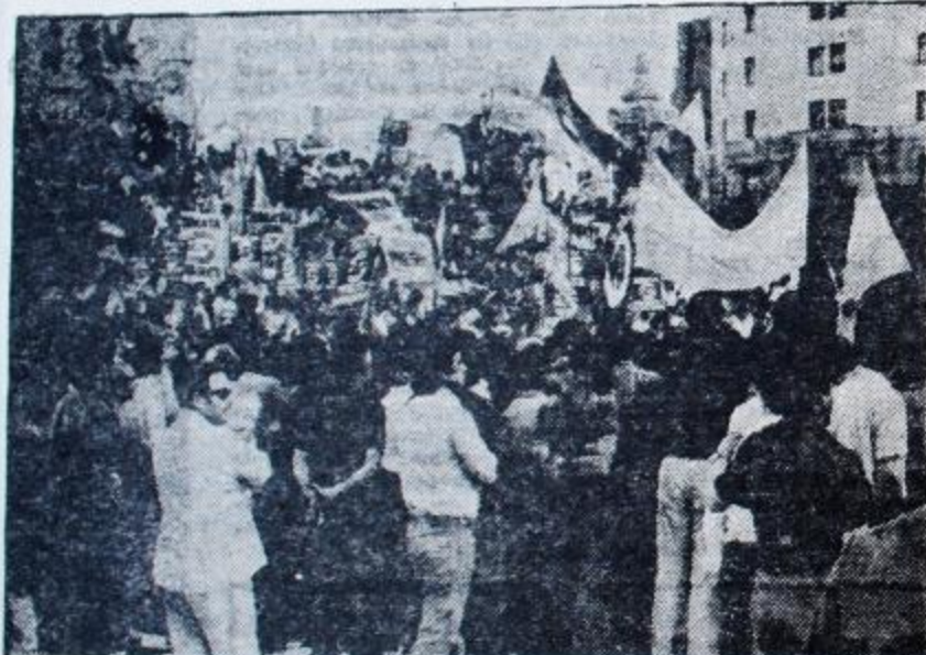
Las movilizaciones de los obreros de SMATA apuntalan el surgimiento de la vanguardia combativa y antiburocrática.

Pero aún en el caso en que la burocracia y el gobierno frustren definitivamente la posibilidad de presentar en las elecciones una oposición a nivel nacional el proceso preelectoral ha sido una positiva experiencia, que permitirá a los activistas extraer conclusiones útiles. Los obstáculos surgidos están estrechamente vinculados a la tarea de construir una corriente clasista y antiburocrática y aunque esto no se haya logrado plenamente, es indudable que existen los elementos para hacerlo, a corto plazo, si persistimos en una correcta política unitaria y combativa.