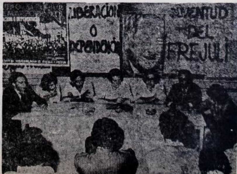
Las juventudes del FREJULI en una conferencia de prensa: entre ellas las de la Juventud Peronista.

La lucha que la clase obrera y el pueblo ya están desarrollando con valentía y heroísmo por el logro de la PATRIA SOCIALISTA'