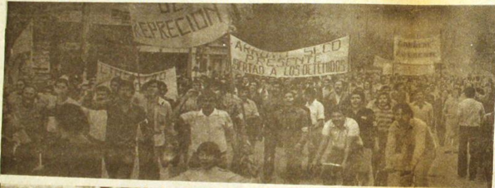
26 de marzo. El gobierno inventa un plan subversivo para reprimir la organización de 7.000 metalúrgicos de Villa Constitución. La respuesta a la agresión, a los 150 presos y a las muertes, fue una huelga de más de 60 días con total apoyo popular.

Lo repiten todos los días. Estamos en guerra. De aquel lado, imperialismo, el gobierno de María Martínez y la cúpula militar, burocracia sindical, los monopolios y la oligarquía. De este lado, clase obrera, y todos los sectores de la Nación que anhelan la liberación. Aquí ofrecemos la síntesis gráfica de un año de resistencia. El gobierno continuó con el camino iniciado después de la muerte del General Perón. Practicó con descaro la entrega del país —incluido un acuerdo público con las multinacionales firmado por Martínez— y confirmó una ley ineludible: cuanto mayor es la dependencia más grande debe ser la represión. Desde los círculos del poder se generó y amparó el ejercicio del crimen para imponer el terror, desarticular al Movimiento Peronista y toda resistencia popular. López Rega fue el principal artífice de esta maniobra del imperialismo. Como complemento, las Fuerzas Armadas siguieron avanzando hacia el control del poder real. Esta vez bajo el principio de defender las "instituciones": primero ocuparon Tucumán, ahora conducen la represión al pueblo en todo el territorio nacional. Al Brujo le fue mal. Quiso el poder ilimitado, pero no pudo controlarlo.