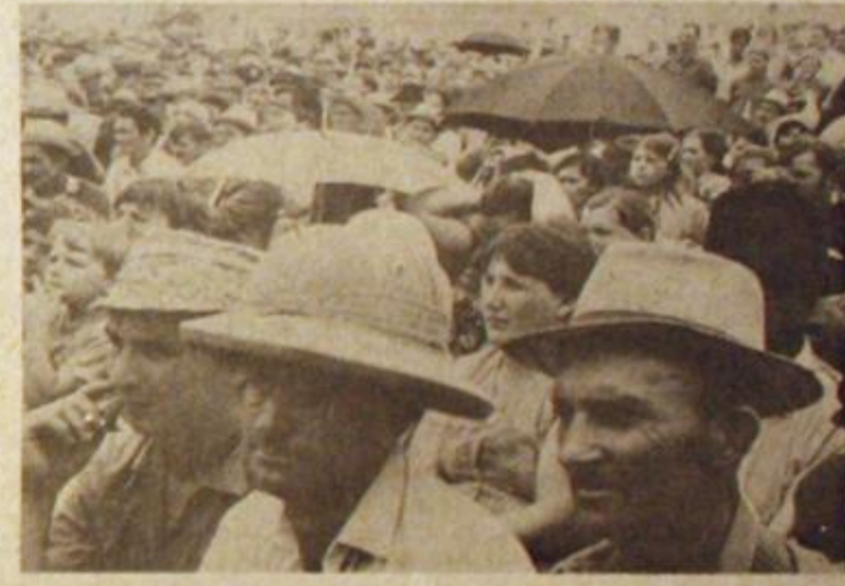
Movilizaciones en el norte: Las Ligas Agrarias, que nuclean a los pequeños agricultores, protestan contra el gobierno que favorece a los monopolios.