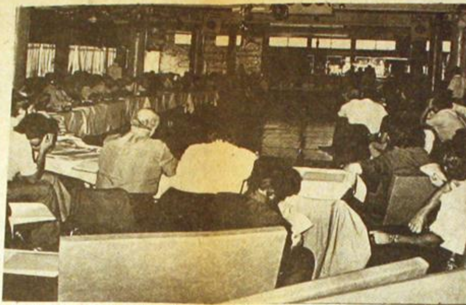
11 de marzo. En el restaurante Nino, donde Perón convocó a la Unidad Nacional, se lanza el Partido Peronista Auténtico.

Lo repiten todos los días. Estamos en guerra. De aquel lado, imperialismo, el gobierno de María Martínez y la cúpula militar, burocracia sindical, los monopolios y la oligarquía. De este lado, clase obrera, y todos los sectores de la Nación que anhelan la liberación. Aquí ofrecemos la síntesis gráfica de un año de resistencia. El gobierno continuó con el camino iniciado después de la muerte del General Perón. Practicó con descaro la entrega del país —incluido un acuerdo público con las multinacionales firmado por Martínez— y confirmó una ley ineludible: cuanto mayor es la dependencia más grande debe ser la represión. Desde los círculos del poder se generó y amparó el ejercicio del crimen para imponer el terror, desarticular al Movimiento Peronista y toda resistencia popular. López Rega fue el principal artífice de esta maniobra del imperialismo. Como complemento, las Fuerzas Armadas siguieron avanzando hacia el control del poder real. Esta vez bajo el principio de defender las "instituciones": primero ocuparon Tucumán, ahora conducen la represión al pueblo en todo el territorio nacional. Al Brujo le fue mal. Quiso el poder ilimitado, pero no pudo controlarlo.