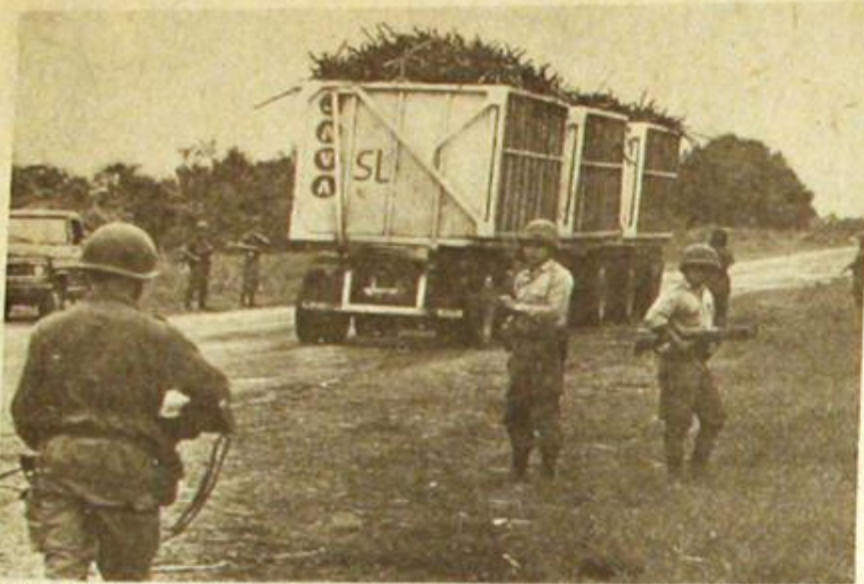
5 de febrero. El Ejecutivo ordena la intervención militar en Tucumán. A diez meses crece un reclamo del pueblo: ¡Que se vayan!