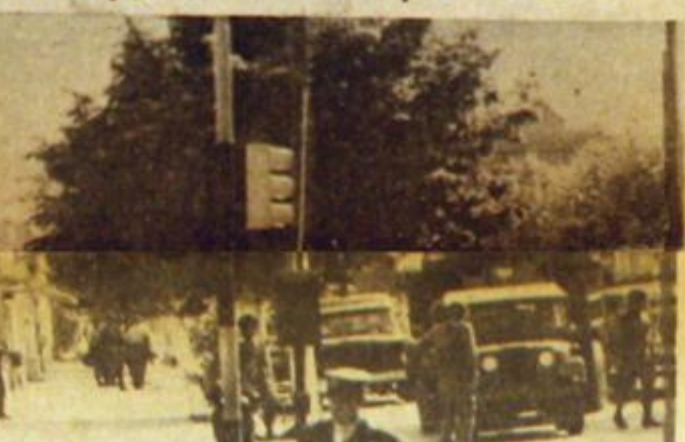
Represión militar. El Ejército se lanza a la represión masiva en las principales ciudades. Rastrillos, pinzas y controles.