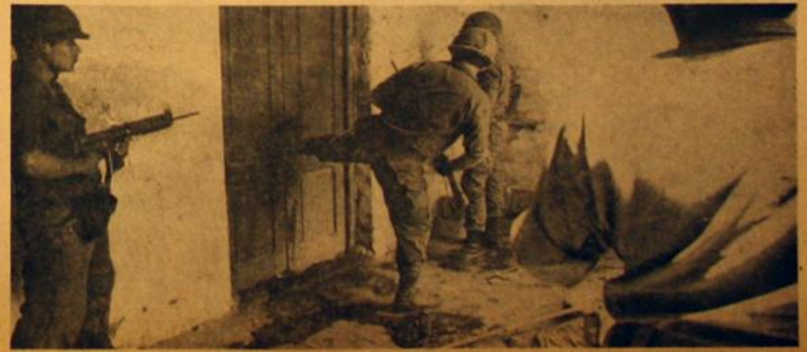
Los militares encabezan la represión. De nuevo contra los trabajadores.