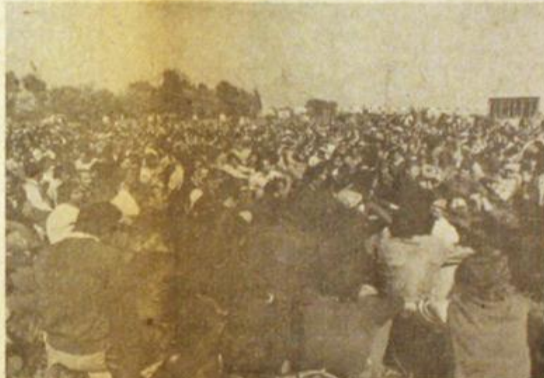
Octubre. Se multiplican los conflictos en todo el país. En Graña, Mercedes Benz, Fiat y Sierra Grande se lucha contra los salarios de hambre y la burocracia.