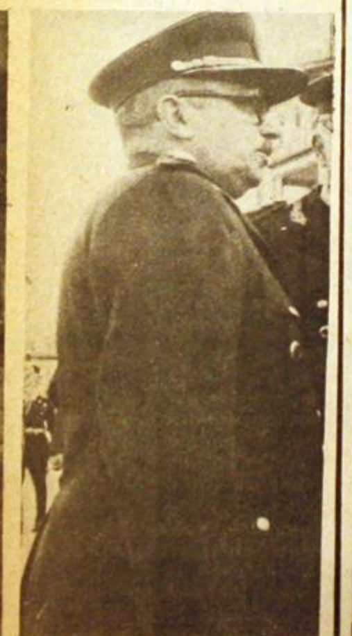
14 de mayo. En su avance desenfrenado, el lopezreguismo impone al Gral. Laplane en el Ejército.