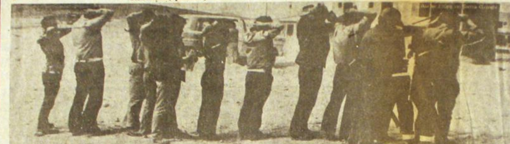
Conflicto en Sierra Grande. Los mineros toman el yacimiento en defensa de sus derechos y salarios. El Ejército muestra su doble cara de patrón y fuerza de represión del pueblo.