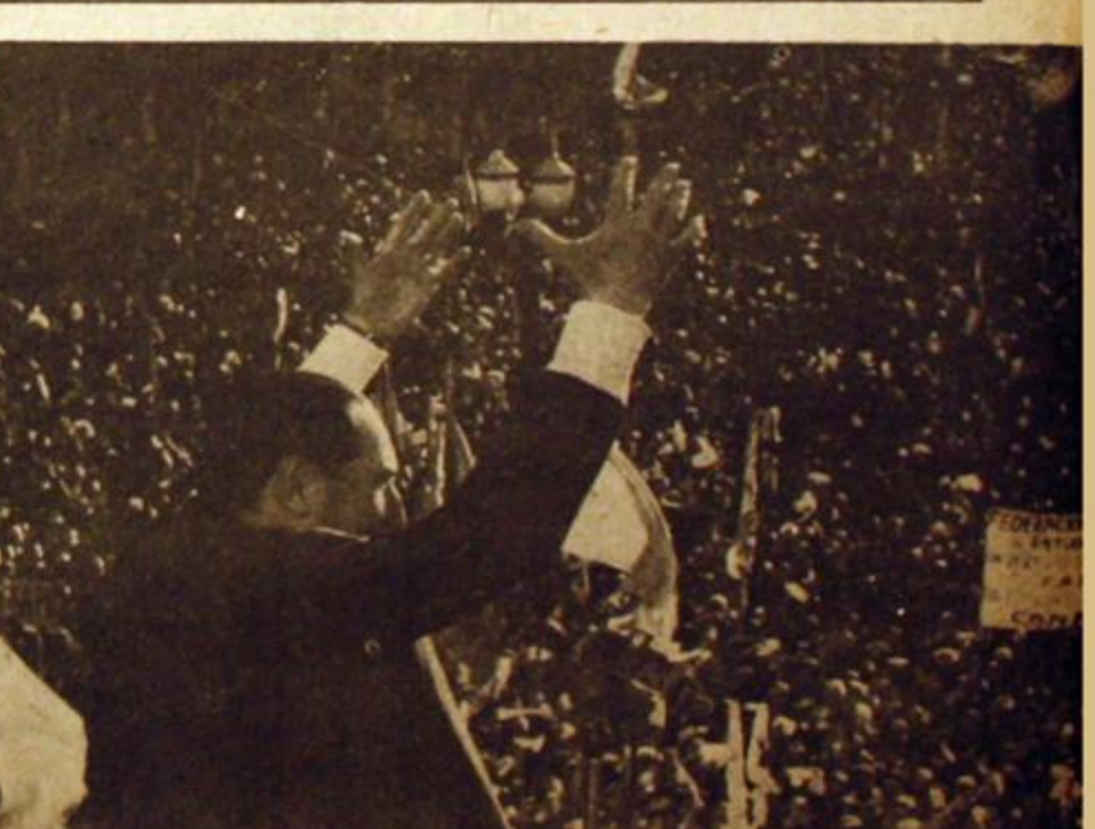
10 de julio. Primer aniversario de la muerte del General Perón. Como denunciado el auténtico peronismo, su herencia y su pueblo son traicionados por los trabajadores lo recuerdan luchando contra el lopezreguismo.