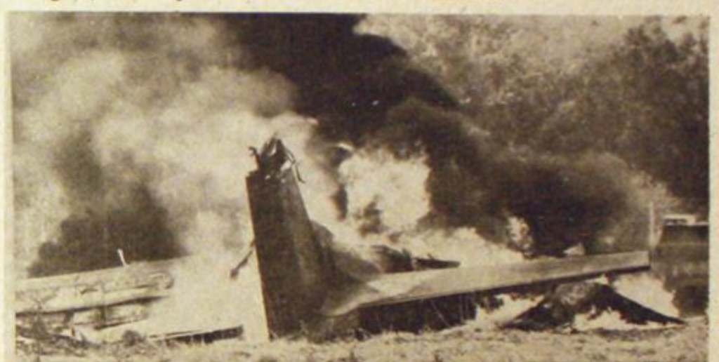
28 de octubre. Una bomba colocada bajo la pista del aeropuerto de Tucumán por la organización proscripta vuela un Hércules de F. Aérea.