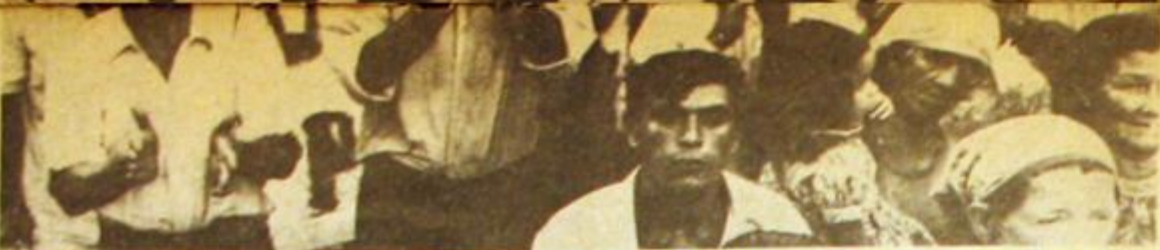
13 de abril. Elecciones en Misiones. Triunfa el oficialismo tras una campaña multimillonaria apuntalada con todos los recursos del Estado. A un mes de su lanzamiento, el Peronismo Auténtico es la tercera fuerza provincial.