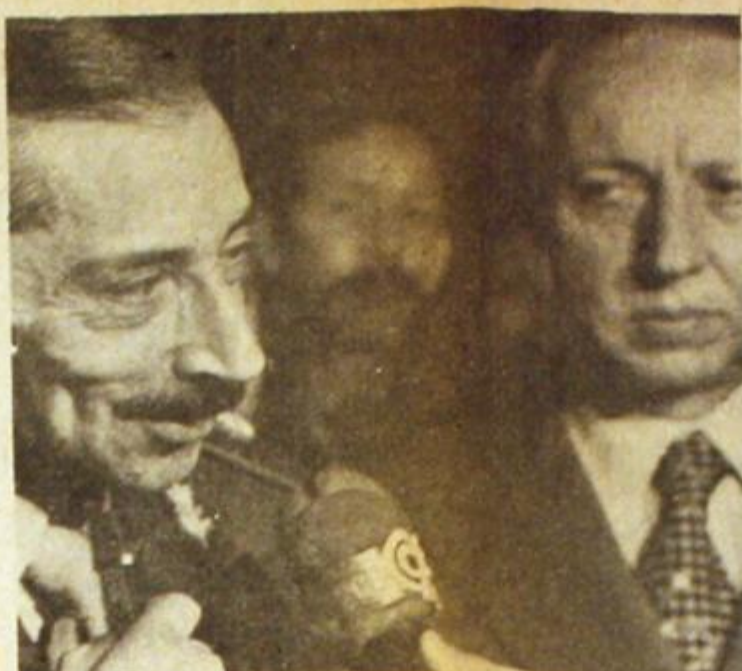
Un nuevo comandante en Ejército y un Presidente provisional: Videla y Luder. La Presidente, en Ascochinga.

Del lado del país auténtico, la respuesta popular se organizó para defenderse de la agresión y combatir por una patria justa. Los conflictos fabriles y cuestionamientos a la burocracia sindical se sucedieron ininterrumpidamente. A pesar de la represión se produjeron movilizaciones masivas, se lanzó el Movimiento P. Auténtico, y nuestros enemigos fueron señalados con todas las formas que nuestro pueblo ha sabido construir. Una vez más, la clase trabajadora confirmó otra ley que también es ineludible: ante los intentos de dominarnos, se multiplica la heroica lucha por la liberación nacional y social. ♦