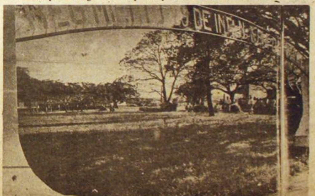
5 de octubre. La organización político militar peronista ataca el R. 29 de Infantería de Monte. Tras sufrir once bajas, se retiran en un jet secuestrado y aterrizan. Se apoderan de armamento.