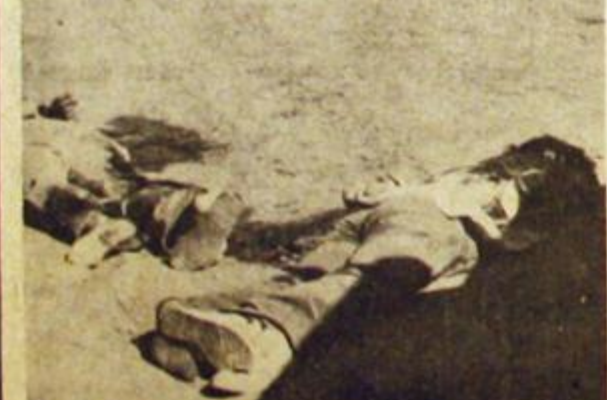
El imperialismo sigue asesinando a trabajadores y militantes del pueblo. Las 3 A no son patrimonio de López Rega sino un sistema de terror impuesto por los yanquis.