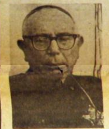
Bonamín: la voz eclesástica de la represión. Le responderá la Iglesia del pueblo.