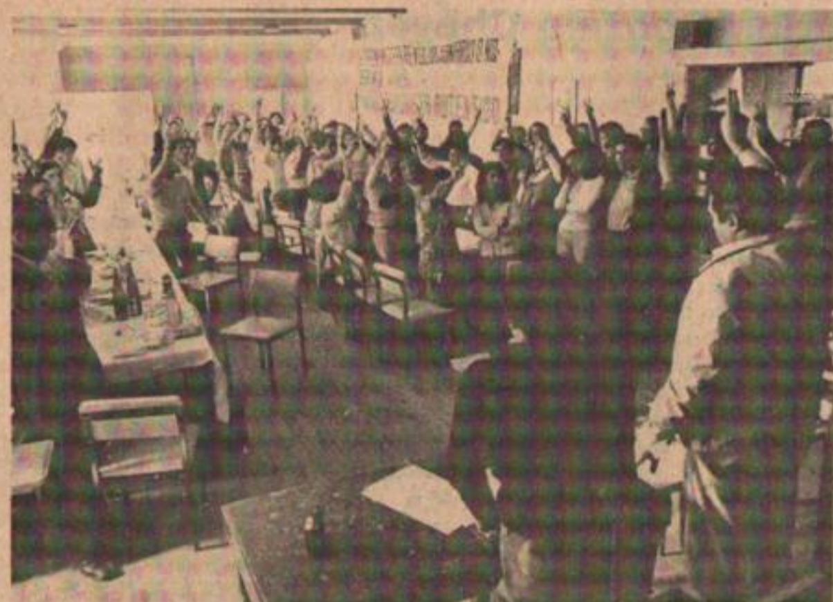
Hubo fervor peronista en el Congreso Constituyente de Neuquén.

ENVIADOS ESPECIALES: En un acto donde se congregaron más de 100 personas, delegadas de distintas zonas de la provincia, se constituyó la junta promotora del Partido Peronista Auténtico de Neuquén.