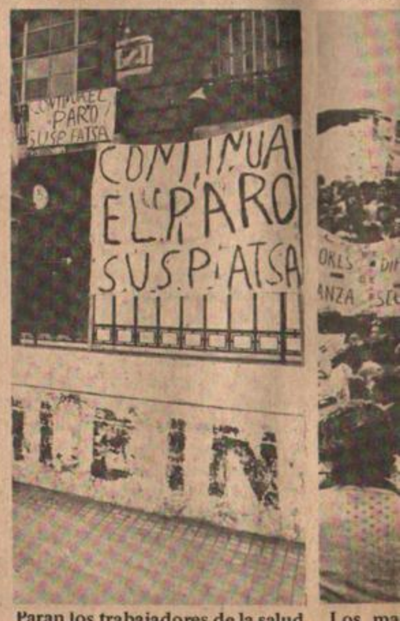
Paran los trabajadores de la salud. Los ma...