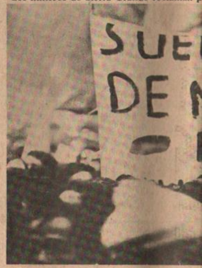
El pedido central de todos los trabajador...