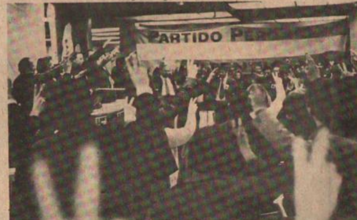
El peronismo de Capital se organizó el domingo en el Savoy.