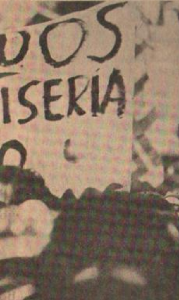
inflación ya se comió los aumentos.