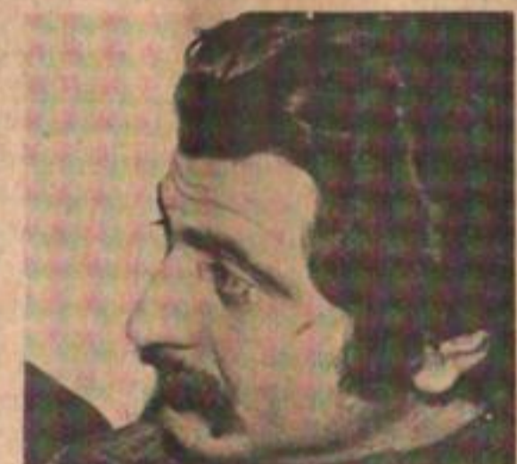
Hay que derrotar a "los turcos".

Piedra de Aguila: la delegación dejó vacante el cargo para consultarlo con una asamblea que realizarán próximamente.