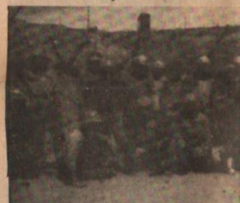
Los mineros de Sierra Grande reclaman p...

Los trabajadores judiciales de la Capital Federal vienen concretando paros parciales y últimamente totales, con abandono del trabajo y movilización alrededor de Tribunales. Algo similar ocurre en los juzgados federales del interior y secretarías electorales. Se repudia la política económica “que pretende descargar la crisis sobre los trabajadores” y exigen el pago de los aumentos obtenidos y del retroactivo al mes de junio. Se emplazó al Poder Ejecutivo hasta el 15 de setiembre para satisfacer esa demanda y ante la falta de respuesta el 19 comenzaron las medidas de fuerza. La situación está agravada porque los directivos de ATE y UPCN firmaron un acta de compromiso donde se resuelve pagar lo adeudado en cuotas del 30 por ciento entre enero y marzo del 76. Los judiciales piensan ampliar su acción estableciendo acuerdos con otros sectores de la administración pública que atraviesan por situaciones similares. La Unión de Empleados de la Justicia de la Nación, entidad sin personería gremial, es la que encabeza el conflicto con alrededor de 4.300 afiliados. En Tribunales trabajan 6.500 empleados; incluyendo el interior del país son casi diez mil.