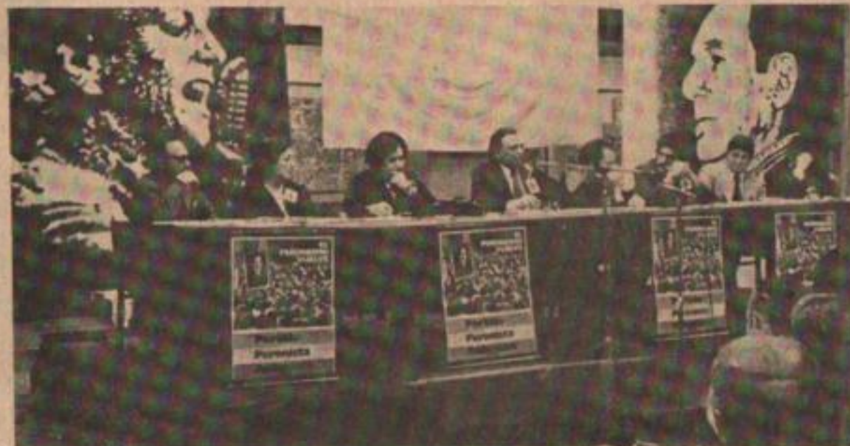
Junta Promotora de Capital: por mandato de las bases.