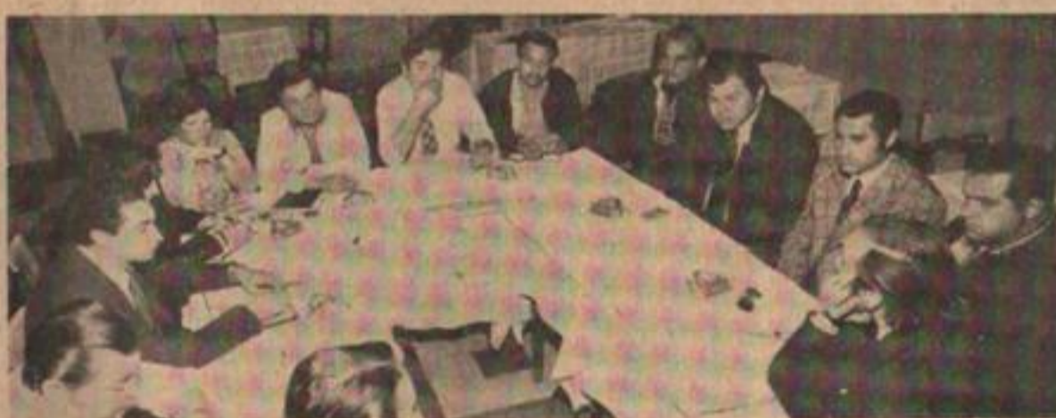
En Buenos Aires constituirán el Bloque de Concejales del PPA.