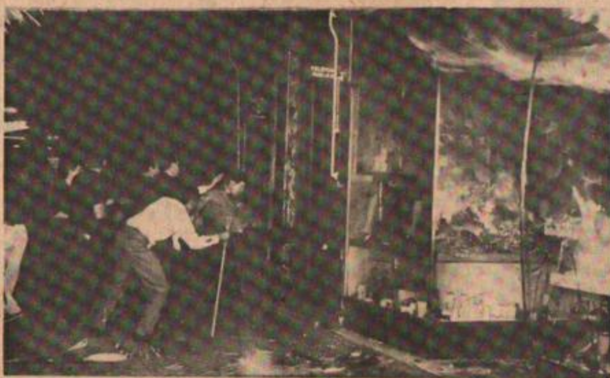
Violencia popular contra la dictadura gorila.

Por eso este 17 no hay nada que festejar. Hay que pelear. Y en eso este 17 nos encuentra a mitad de camino entre la muerte del Líder y el día en que, con las banderas de Perón y Evita desplegadas, el Movimiento vuelva a escribir la historia de la Nación Argentina Justa, Libre y Soberana. ♦