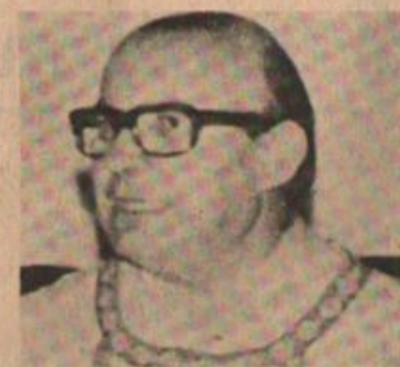
Angelelli junto a su pueblo.