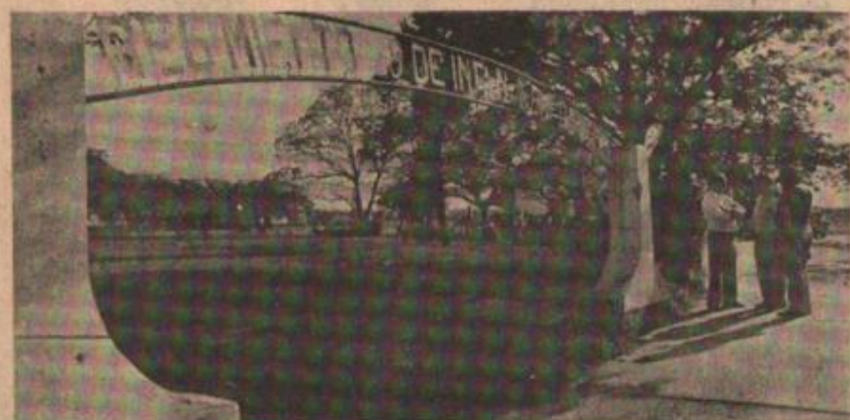
La entrada del Regimiento 29, atacado el domingo 5.

Uno de los enfrentamientos armados más importantes en los últimos años fueron las acciones que se desarrollaron el domingo 5, cuando mediante una operación sincronizada y simultánea la organización política militar peronista proscripista ocupó el Regimiento 29 de Monte de Formosa; se apoderó del Aeropuerto Internacional El Pucú, capturó un avión comercial que luego sirvió para la retirada, y aterrizó sobre un campo de Rafaela, cerca de Santa Fe.