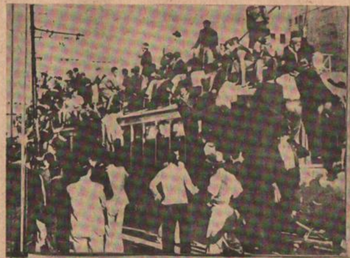
1945: Cualquier medio se utilizaba para llegar a la Plaza.

ros de Villa Manuelita en Rosario, y explotaban los primeros caños de la Resistencia.