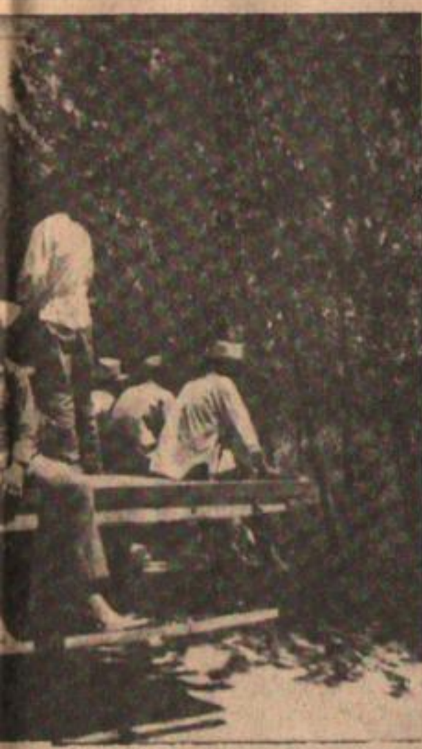
devolución del sindicato.

Asistieron delegados y compañeros de 38 establecimientos, además de delegaciones de Córdoba y Villa Constitución. ♦