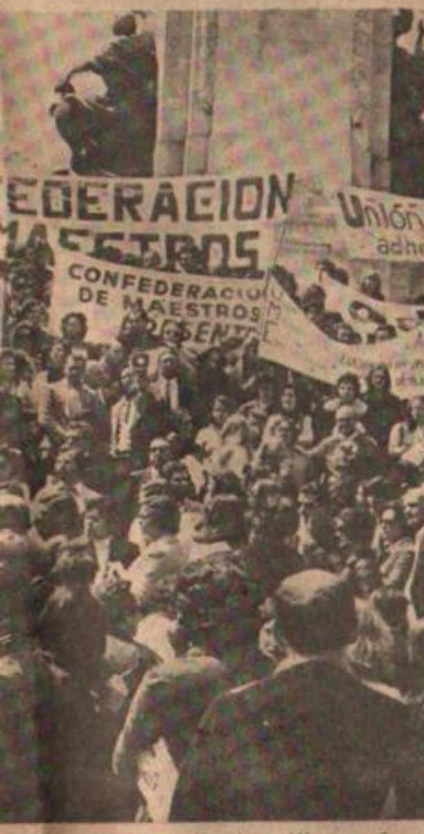
En varias provincias dijeron basta.