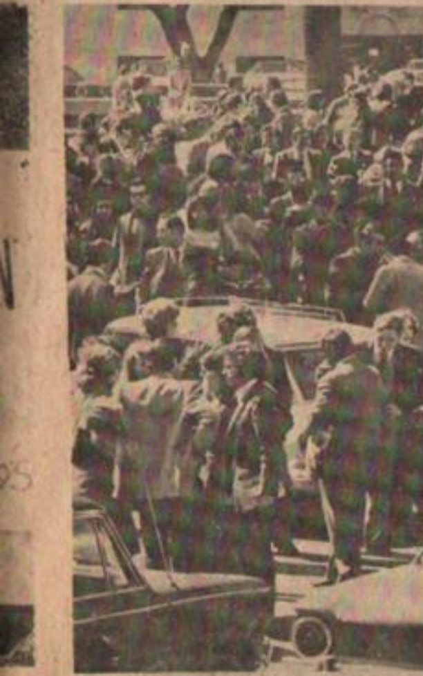
Paro judicial: todo el país.