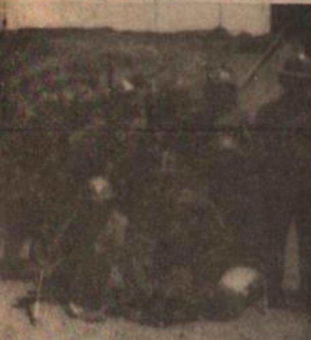
ores salarios y mejor salubridad.