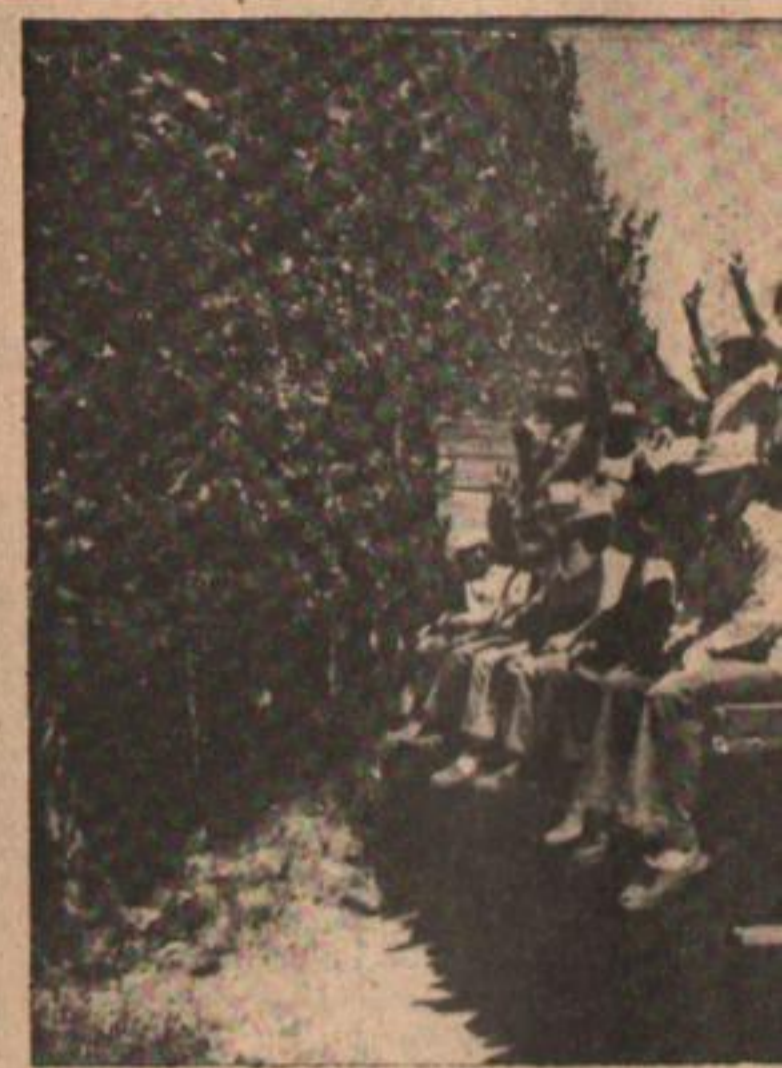
Los trabajadores del Ingenio Ledesma...

Para evitar los riesgos corridos en la anterior huelga de diez días, los compañeros del Ledesma se han organizado previendo detenciones y represión. Han constituido tres comisiones de lucha. La primera dirige el conflicto dentro de fábrica y permanece allí “custodiada por los compañeros” para evitar detenciones. La segunda conduce al conflicto fuera de la fábrica. Existe una tercera comisión de lucha que se mantiene alerta para reemplazar a cualquiera de las dos primeras en caso de detención de sus integrantes. El cuidado con que se montó esta estructura y la afectividad demostrada en las colectas y contactos políticos y sindicales hacen suponer a los huelguistas que no se repetirá el fracaso de las medidas de marzo.