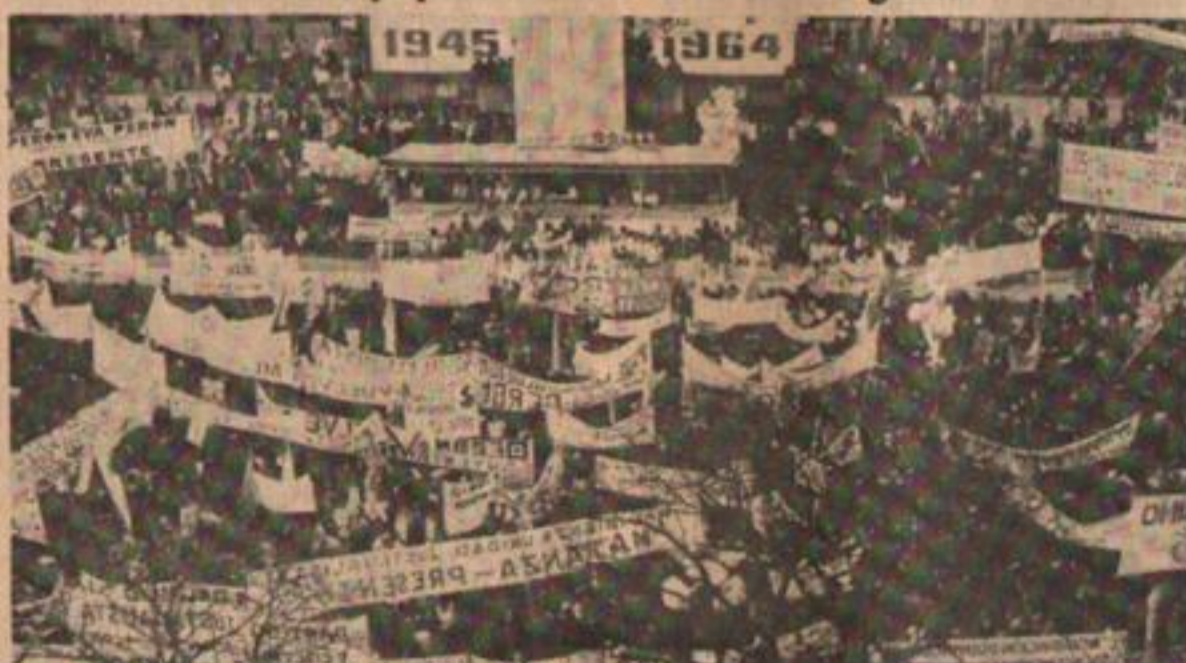
1964: concentración en Once y campaña por el retorno.

El oficialismo se pelea por un acto. Se disputan, en realidad, las migajas de poder que les dejan los militares. Amenazan con suspender el derecho de huelga y establecer zonas militares en un gobierno autodenominado peronista. Cuesta detenerse a pensar que pasado mañana se cumplen treinta años del primer Día de la Lealtad. Treinta años de que la clase obrera decidió irrumpir en la lucha por el poder, rescató a su líder y a sus derechos, fundó su Movimiento, el Movimiento Peronista.