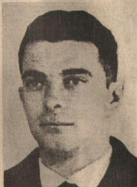
Abal Medina y Ramus: continuidad de las luchas peronistas