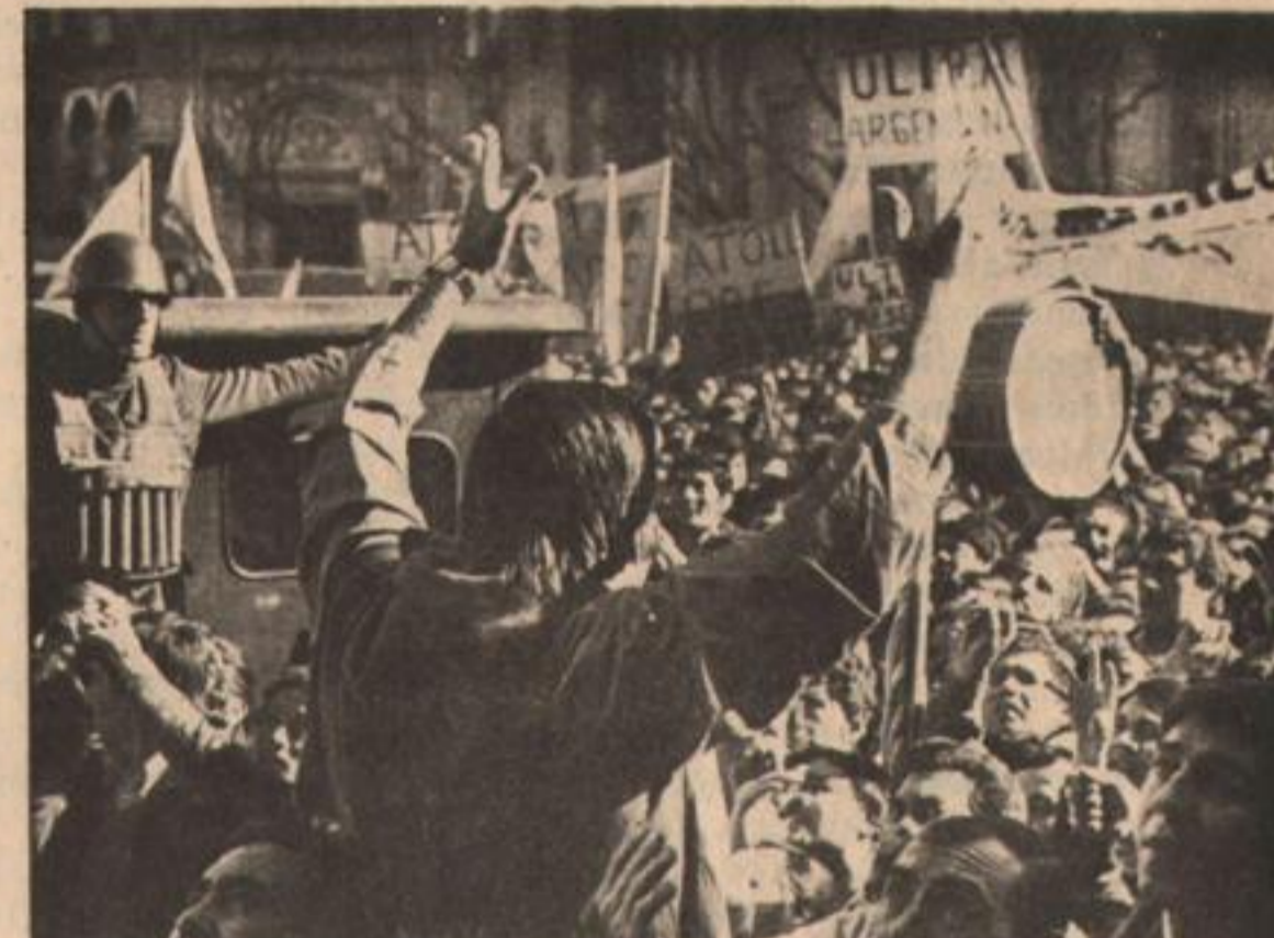
Para cada intento represivo, el pueblo encontró su respuesta.

violencia popular desborda en Córdoba, Rosario y Tucumán. El gobierno decreta el estado de emergencia, colocando las zonas en conflicto bajo jefatura militar.