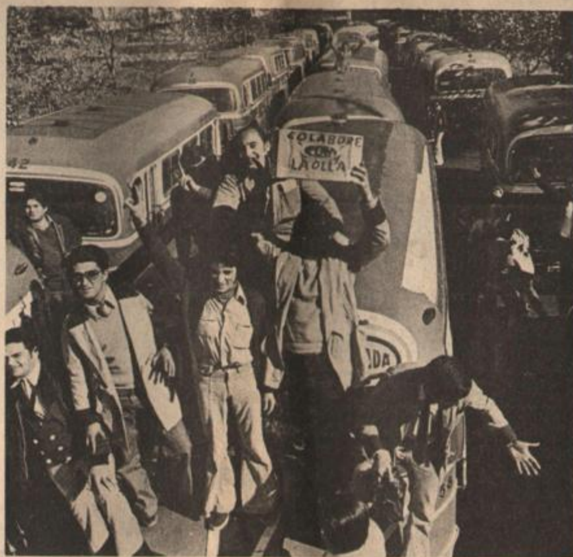
Unión Tranviarios Automotor: la representatividad del gremio no está en la burocracia.