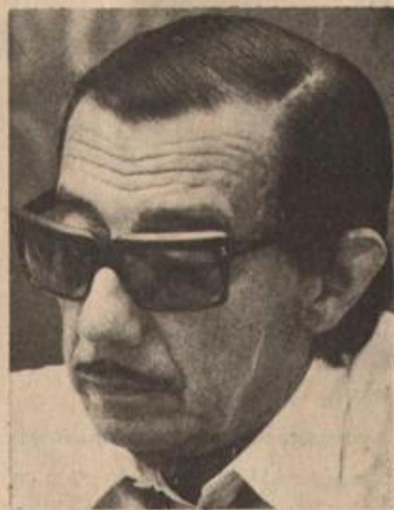
Framini: "Desmovilizaron al pueblo".

El 18 de setiembre, Perón eleva su renuncia a la Junta de Comandantes. Según Alberte, el general se veía cansado, abatido, sin fuerzas. Su testimonio es compartido por una dirigente de la Rama Femenina, ex diputada, que gozó de la confianza de Evita. "El 15 de setiembre estuve reunida (junto con importantes funcionarios del gobierno) con el general Perón. Se tenían noticias de una inminente sublevación. Lo vi cansado, preocupado, fatigado. Dijo que los sublevados querían su cabeza. Le contesta-