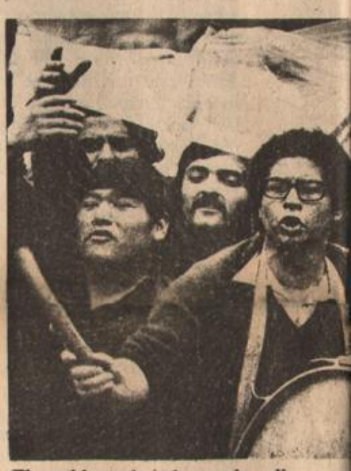
El pueblo trabajador en la calle es ga