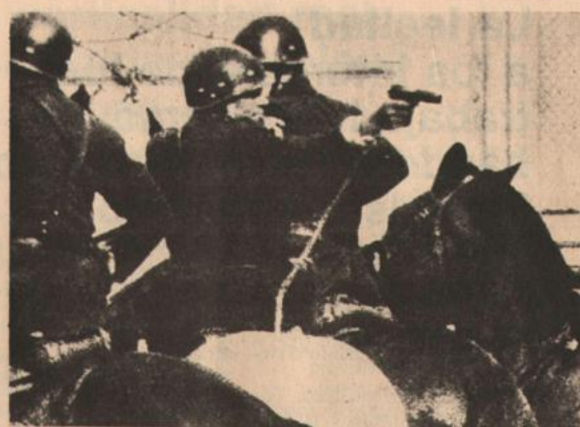
Desde el 55 la represión contra el pueblo ha ido en aumento.

El 3 de agosto un comando de la organización guerrillera