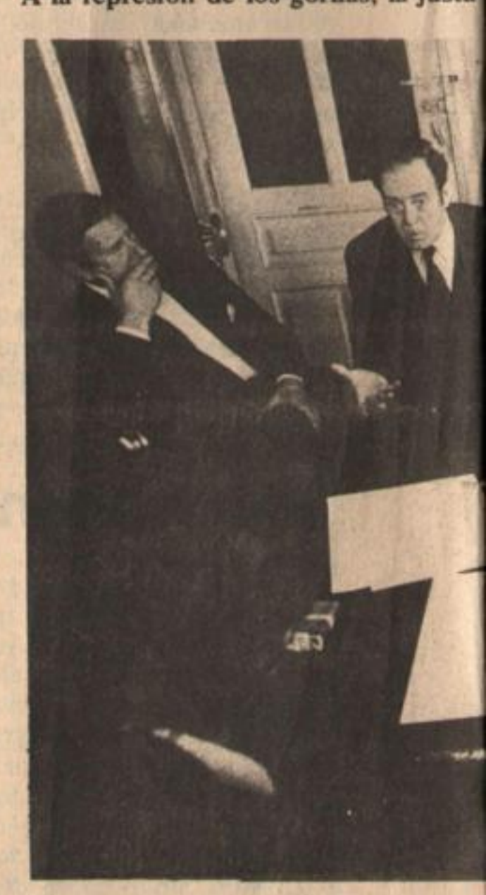
Cepernic, Cabo, Framini, Zavala y V