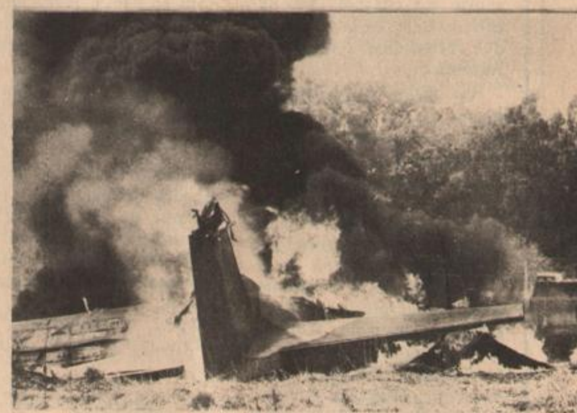
Tucumán: los proscritos destruyen uno de los cuatro Hércules que posee la Fuerza Aérea Argentina.

La historia del movimiento peronista demuestra que no es con leyes ni prohibiciones como se pacifica al país. Por el contrario, sólo sirven para agudizar el enfrentamiento entre los defensores del privilegio y los argentinos que quieren una patria justa, libre y soberana.