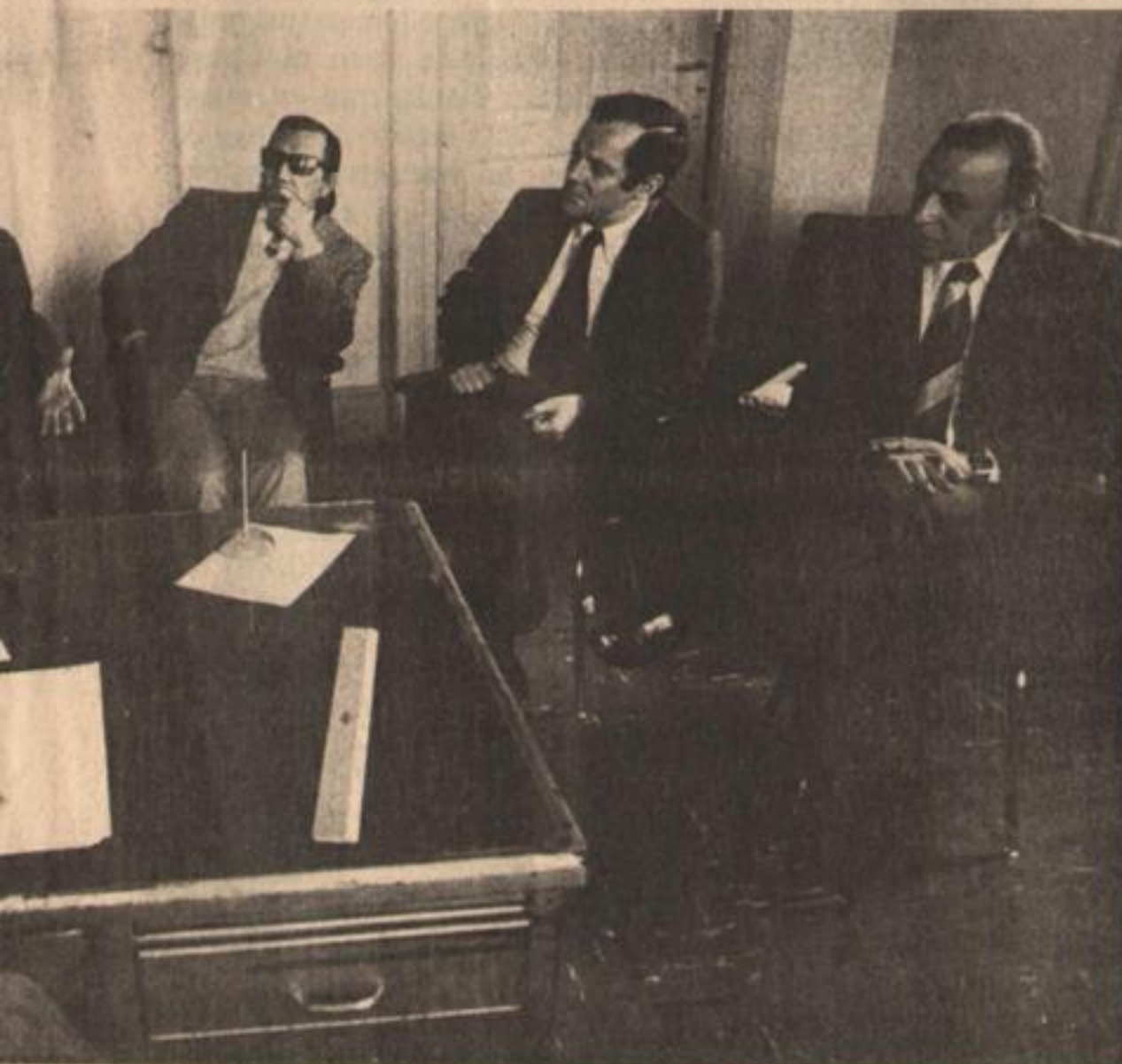
l: constituir el MPA.