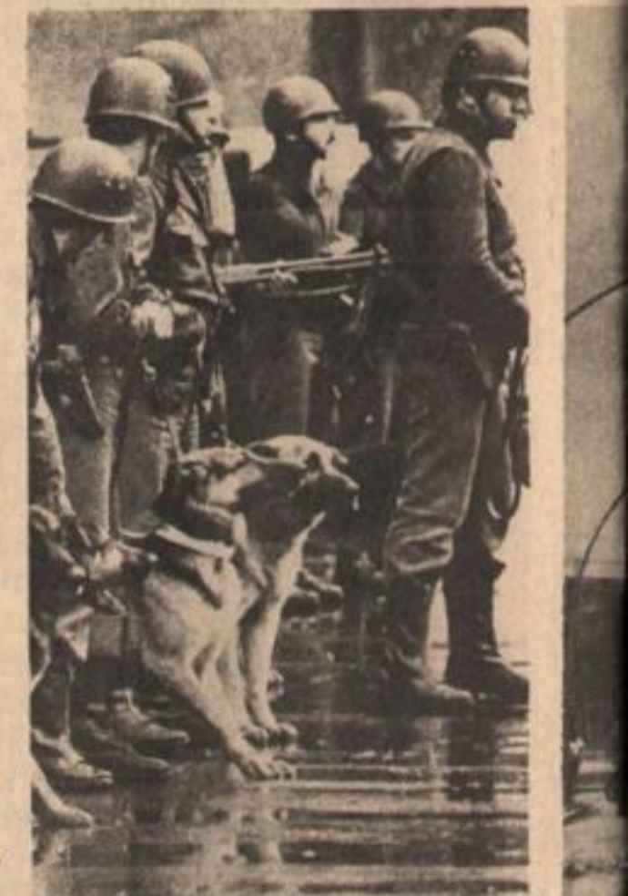
A la represión de los gorilas, la justa