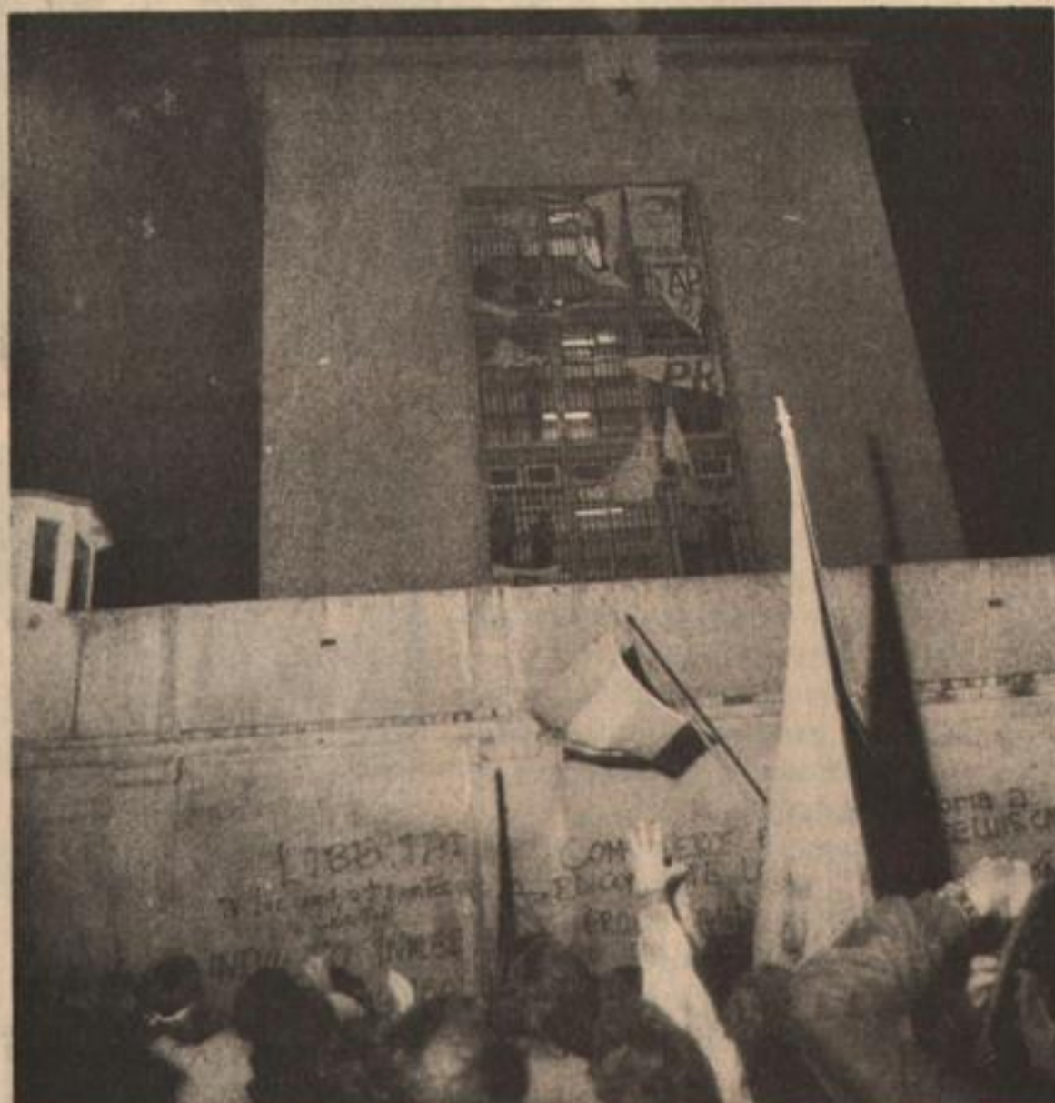
El 25 de mayo el pueblo liberó sus presos. Hoy las cárceles están nuevamente colmadas.

Tres mil presos políticos repartidos en distintas cárceles del país sufren, en condición de rehenes, el "delito" de oponerse al actual gobierno. Hacinamiento, mala comida, provocaciones, torturas, son algunas de las características del actual sistema carcelario, que supera las épocas más negras de los regímenes gorilas. Esto fue denunciado por la Comisión Peronista de Solidaridad con los Presos Políticos.