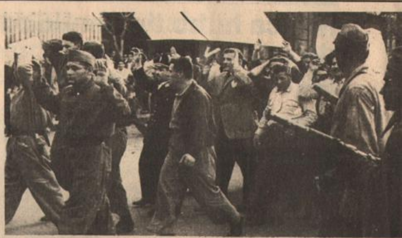
La Libertadora intentó desorganizar el Movimiento con la represión.

"La muerte de Perón es bien aprovechada por los enemigos