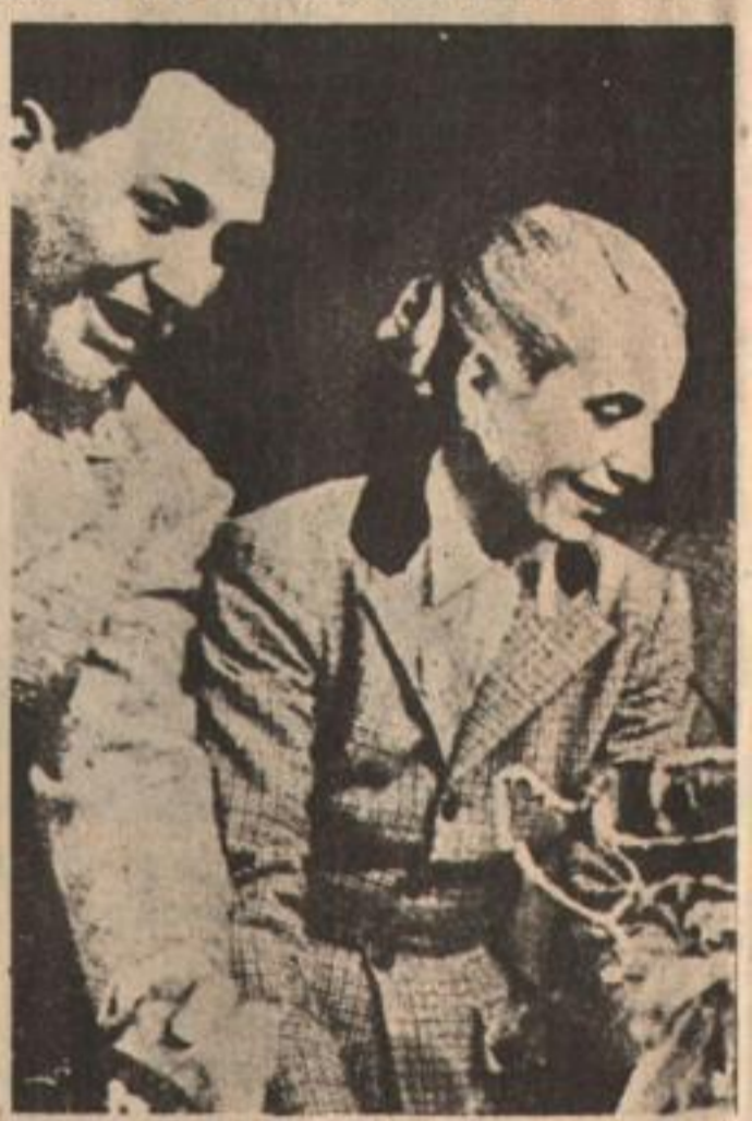
Perón, Evita y el pueblo movilizado: e

"Esto —añade— hace impostergable la reconstitución del Movimiento para que cumpla el rol que le asignó oportunamente el general Perón. Debe constituirse el Consejo Superior para que sirva de referente y acompañe la organización de cada una de las ramas como organismos de masas y no superestructurales, siendo ésta la única forma de afrontar la desaparición del General."