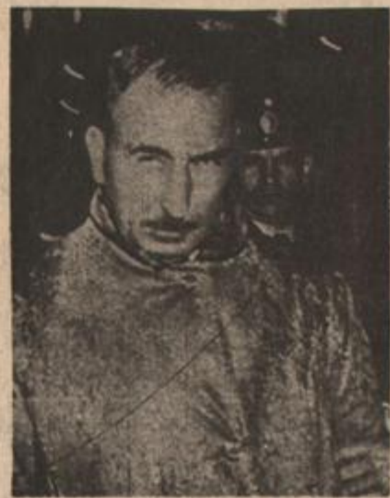
Alberte: "Profundizar la revolución".

"El 10 de setiembre, a la mañana, recibí un llamado telefónico. Un mayor amigo, destinado en Córdoba, me comunicaba que en pocos días más estallaría un movimiento contra Perón. De inmediato comuniqué la novedad al general Lucero, ministro de Guerra del gobierno constitucional. Lo primero que hizo fue hablar con Córdoba. En un tono casi indiferente le preguntó al general Videla Balaguer si había notado movimientos sospechosos. "Por aquí está todo tranquilo", respondió Videla. Casi con furia, Lucero hizo llamar al mayor que me había dado la información. En Córdoba, mientras tanto, los cabecillas del alzamiento le recordaron a mi amigo que allí quedaban su mujer y su hijo."