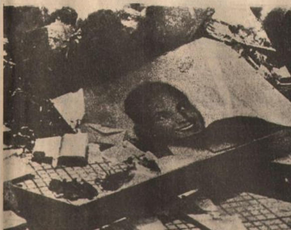
El ensañamiento de la oligarquía con Evita no cesó después de su muerte.

Setiembre siempre fue reivindicado como un mes de triunfo para los gorilas. Salvo contadas excepciones este mes fue de luto para el pueblo argentino y para el peronismo en particular. La historia de las luchas populares muestra que en setiembre los trabajadores han sufrido los golpes más duros a manos de los intereses de la dependencia.