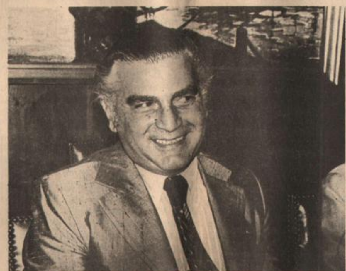
El optimismo de Cafiero tal vez se desvirtuó muy pronto.

¿Puede extrañar entonces que el Fondo Monetario Internacional y los monopolios yanquis apoyen la misión Cafiero?