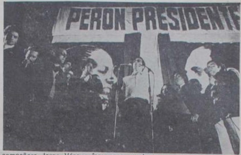
compañero Jorge Vázquez para ser revolucionarios hay que tener origen en las bases."

"La caída de Cámpora es una caída deseada por el mismo presidente, puesto que manifestó en diversas oportunidades su voluntad de que Perón sea presidente. Cuando el conjunto de infiltrados, dependientes del capitalismo internacional —López Rega, Rucci, entre otros— se enteran de la resolución tomada por Cámpora de renunciar para que el general acceda al poder, programan "movilizaciones" populares para hacer aparecer la decisión de Cámpora como resultado de la presión de la "clase trabajadora". Así fue el episodio de 7 colectivos dando vueltas al manzano en Gaspar Campos. Cámpora, enterado de la maniobra, llegó hasta allí donde estaba reunido el general con los citados personajes y le manifestó que él renunciaba, pero para que el rédito político sea aprovechado por Perón. Perón le contestó: "tiene razón Cámpora; y es allí cuando, con la cola entre las piernas, sale Rucci a anunciar que no había paro general. Evidentemente los agentes del imperialismo necesitaban tener un plazo, un espacio político, para cumplir con sus mandantes, puesto que ni con Cámpora ni con Perón podrían hacerlo, y este es el espacio político desde el gobierno que estamos viviendo, pero