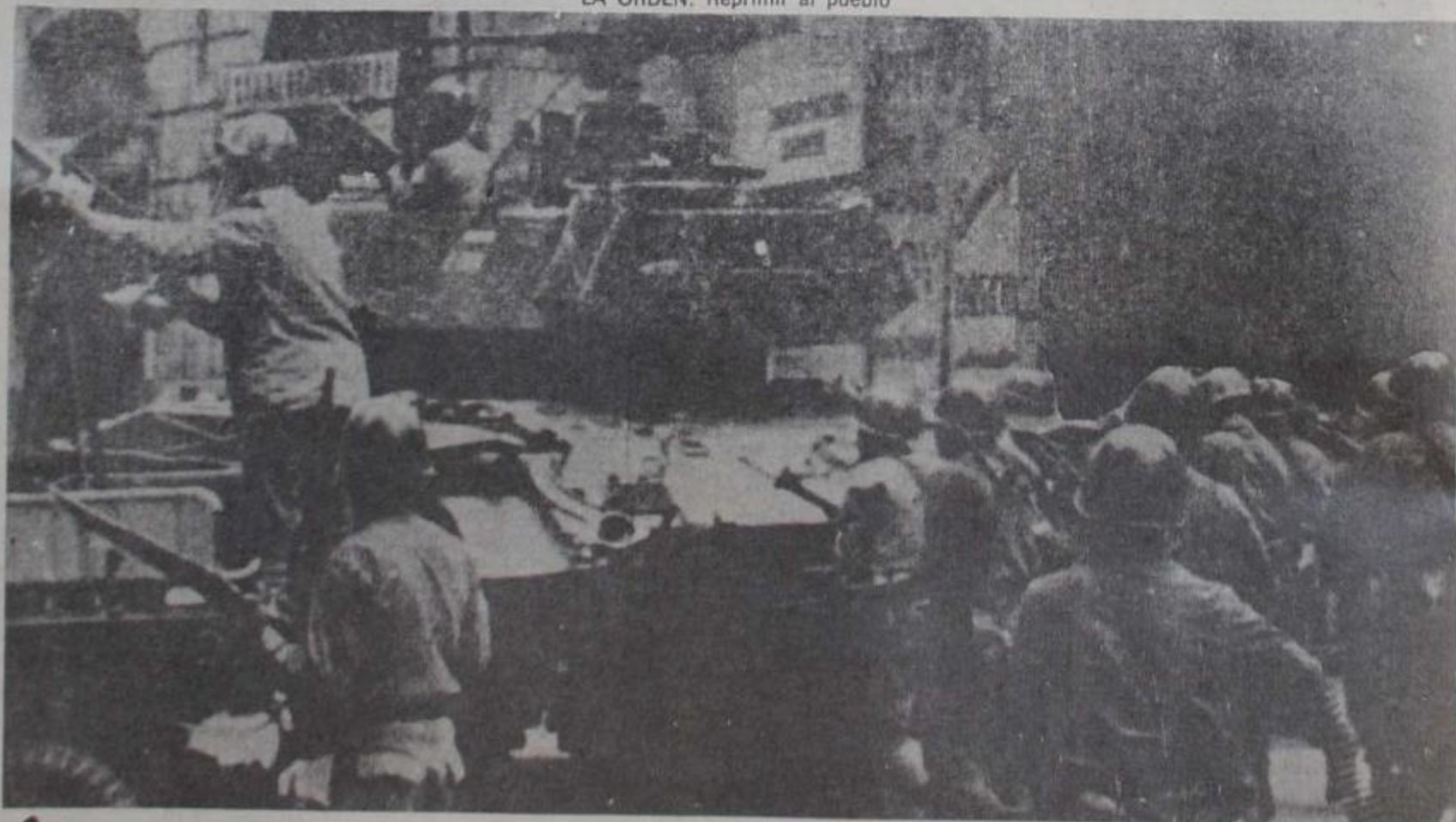
LA ORDEN: Reprimir al pueblo

Hubo dieciocho años entre un hecho y otro. En septiembre de 1955 la escuadra inglesa en maniobras en el Atlántico Sur. En septiembre de 1973 la escuadra yanqui en aguas del Pacífico Sur. En 1955 cae el gobierno popular revolucionario del general Juan Domingo Perón. En 1973 cae el gobierno popular revolucionario de Salvador Allende en Chile. Dos hombres que se habían puesto al frente de sus pueblos en el largo camino de la liberación. Dos escuadras que eran cada una en su momento los símbolos del poder imperialista en la tarea de sojuzgar a las naciones.