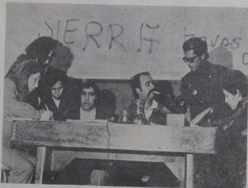
ATSA PARA LOS TRABAJADORES: Vigilia constante