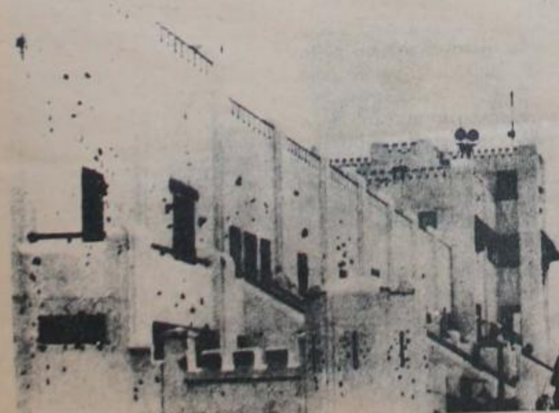
CUARTEL DE MONCADA: Primer paso hacia la liberación continental

Los pasos que llevaron a este convenio son conocidos, y se inician el 25 de mayo con la presencia del compañero Dorticós en la asunción del mando por parte del compañero Cámpora, con la efectiva reanudación de relaciones entre ambos países y luego, más técnicamente, con las misiones diplomáticas y comerciales que intercambiaron ambos países.