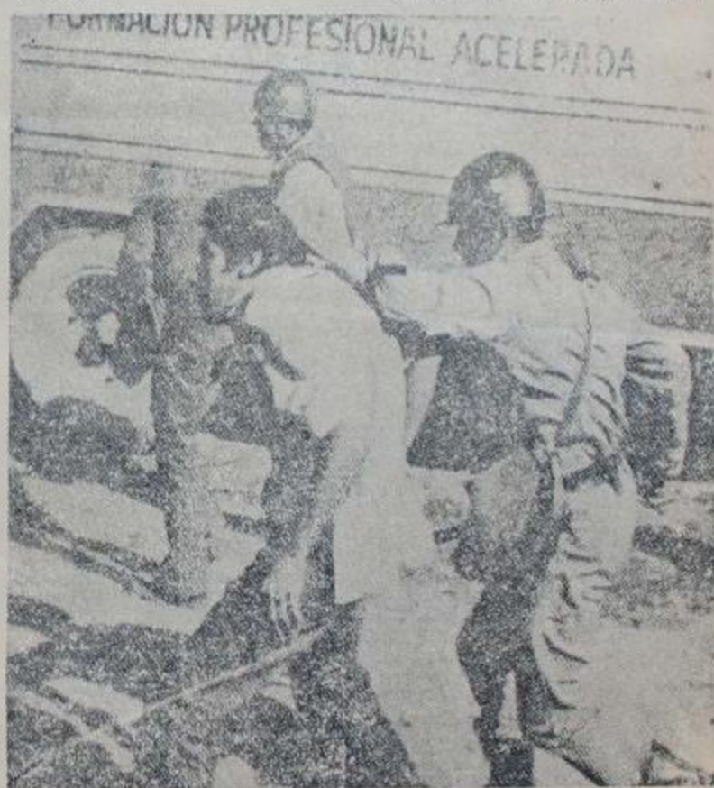
Investigación a los torturadores

EP.: —¿De qué manera se inserta el caso de Ezeiza en este proyecto?