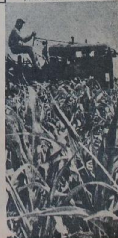
Tractores Argentinos para el Pueblo Cubano

Pero su verdadera importancia debe buscarse en sus consecuencias políticas. Su realidad es una tentativa dentro de la propuesta estratégica del general Perón de integración continental y consolidación del Tercer Mundo. ●