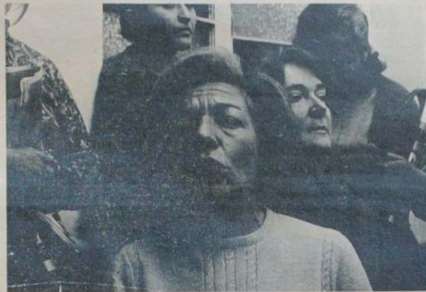
LUCHAR CONTRA TODA DISCRIMINACION INJUSTA QUE DIFERENCIE A LA MUJER POR SU CONDICION DE TAL.