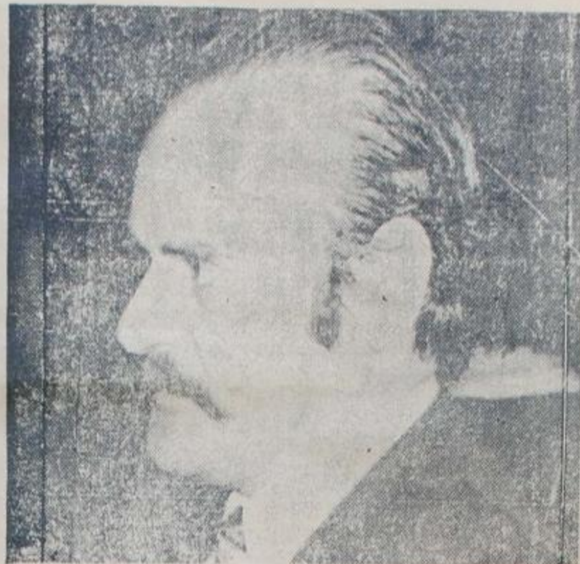
TENIENTE CORONEL JULIAN ANDRES CHIAPPE.

Entre el 25 de mayo y el 13 de julio de 1973, la patria parecía haber dejado atrás 18 años de pesadilla. 18 años durante los cuales la persecución, la represión, la tortura y el asesinato al pueblo se habían convertido en norma para todo aquel que a lo largo del tiempo en que el pueblo estuvo extrañado del poder quiso someterlo. Pero aquella ilusión duró poco, muy poco. La represión continuó, aunque tuvo una variante sutil: antes era oficial y masiva; ahora es parapolicial y selectiva. Quienes ahora secuestran y asesinan no usan uniforme (a veces), pero piensan y actúan como los uniformados del '55, del '56, de agosto del '72, etc.