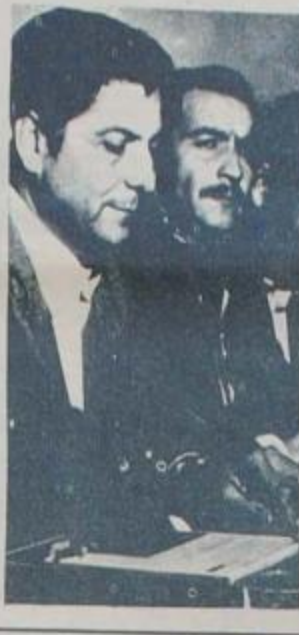
En la conversación sostenida entre los compañeros dirigentes de Córdoba con el General Perón, en uno de los puntos más importantes de sus definiciones, respondiendo a una pregunta, definió al Peronismo dentro del

proyecto socialista. Socialismo nacional en cuanto se realice en autodeterminación y proyectado desde su propia realidad. En definitiva si el cuadro no se define en la socialización del poder, es decir, el paso de los instrumentos que autorizan las grandes soluciones a manos del pueblo, es imposible producir una revolución. Por lo tanto el proyecto socialista es indivisible de la revolución, cualquiera sea el signo ideológico, es decir la técnica de instrumentación política del proceso a aplicar.