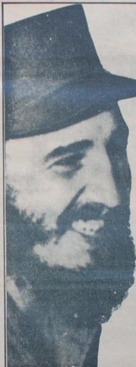
El Líder de la Revolución Cubana

Si bien el panorama internacional actual no es muy halagüeño, ya que el imperialismo busca el aislamiento de las naciones que reclaman su soberanía para debilitarlas e imponerles su proyecto colonialista, la respuesta de solidaridad revolucionaria gestada por los pueblos dificulta cada vez más su accionar.