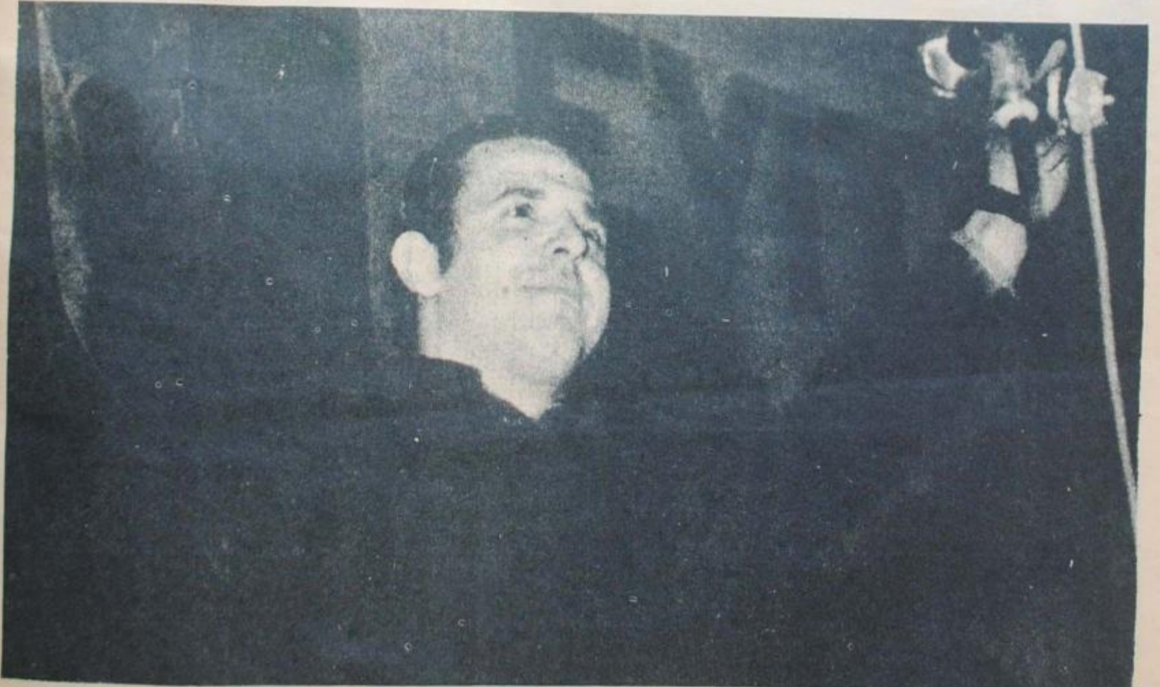
JP: La mayor capacidad de convocatoria del Movimiento