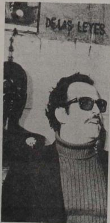
COMPañERO HAIDAR: Mensaje a los peronistas.