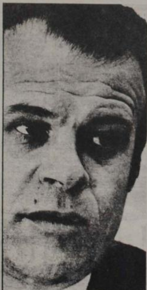
PRESIDENCIABLE TOSCO: con las máximas garantías

P.: Se modificará la línea político gremial seguida hasta el momento?