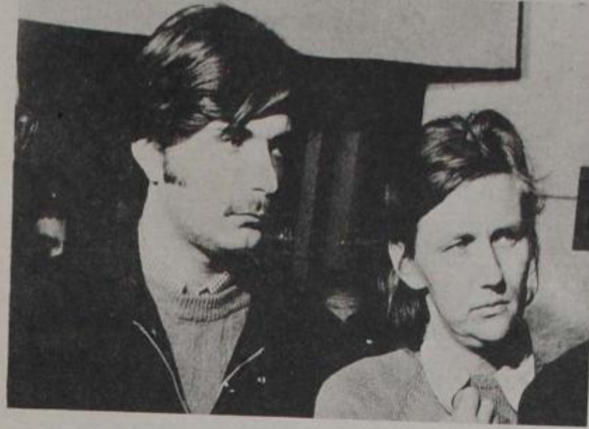
COMPañEROS CAMPS Y BERGER: Testimonios para continuar la lucha.

Por último, recuerdan que al dirigirse dos de los miembros de la vanguardia hacia el avión