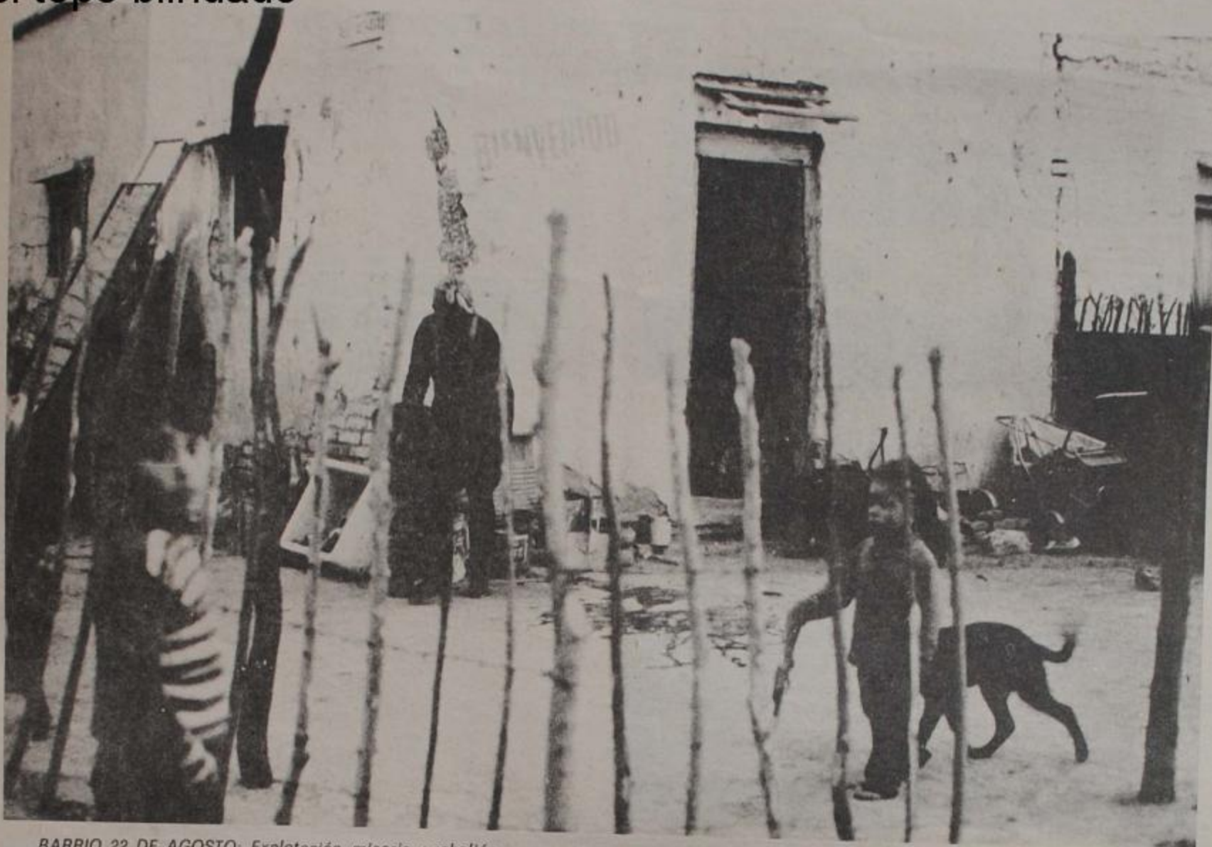
BARRIO 22 DE AGOSTO: Explotación, miseria y rebellón.