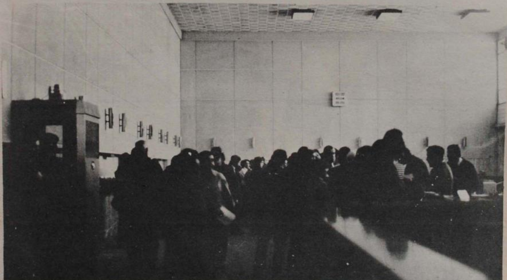
La alternativa más correcta, los bancos expropiados en poder del Estado.

Cabría agregar que, en caso de mantenerse la decisión de privatizar los bancos expropiados es fundamental entregarlos a los capitales nacionales de menor envergadura: cooperativas, ligas de productores, técnicos y profesionales, etcétera. Esta sería la única forma de garantizar que los futuros créditos de estos bancos no se concentren exclusivamente en los grandes capitales nacionales. ●