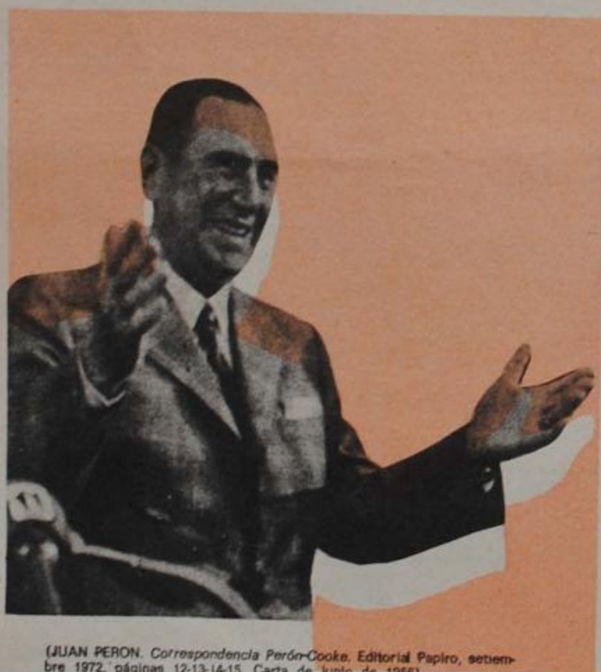
(JUAN PERÓN. Correspondencia Perón-Cooke , Editorial Papiro, setiembre 1972, páginas 12-13-14-15. Carta de junio de 1956).

Nuestro camino es simple: organizarnos concienzudamente en la clandestinidad. Instruir y preparar a nuestra gente, con todo el tiempo que sea necesario para los fines que nos proponemos, agruparnos en organizaciones disciplinarias y bien encuadradas por dirigentes capaces, audaces y decididos, que sean respetados y obedecidos por la masa, planificar minuciosamente la acción y preparar mediante ejercitaciones y "gimnasia" permanente. Si para ello es necesario utilizar al Diablo, recurrimos al Diablo. Para esto el Diablo está siempre preparado.