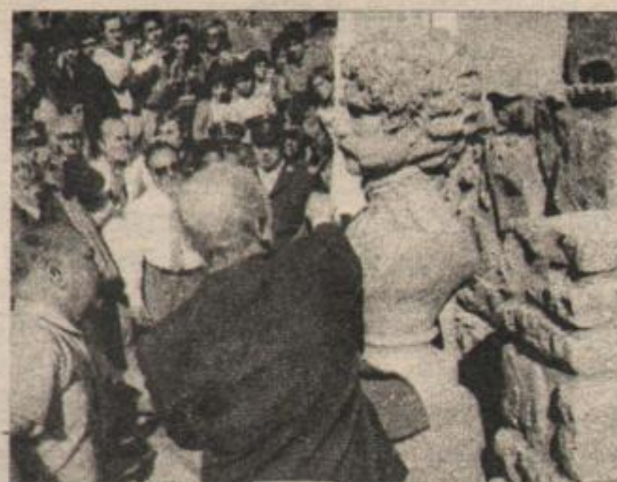
FACUNDO QUIROGA. Las autoridades nacionales descubren el busto del legendario "Tigre". Hoy más vigente que nunca.

En torno a eso, el gobernador arrancó aplausos cuando expresó que "nos sentimos protagonistas de la historia, pues estamos cumpliendo un mandato irrenunciable: instaurar las bases en esta querida