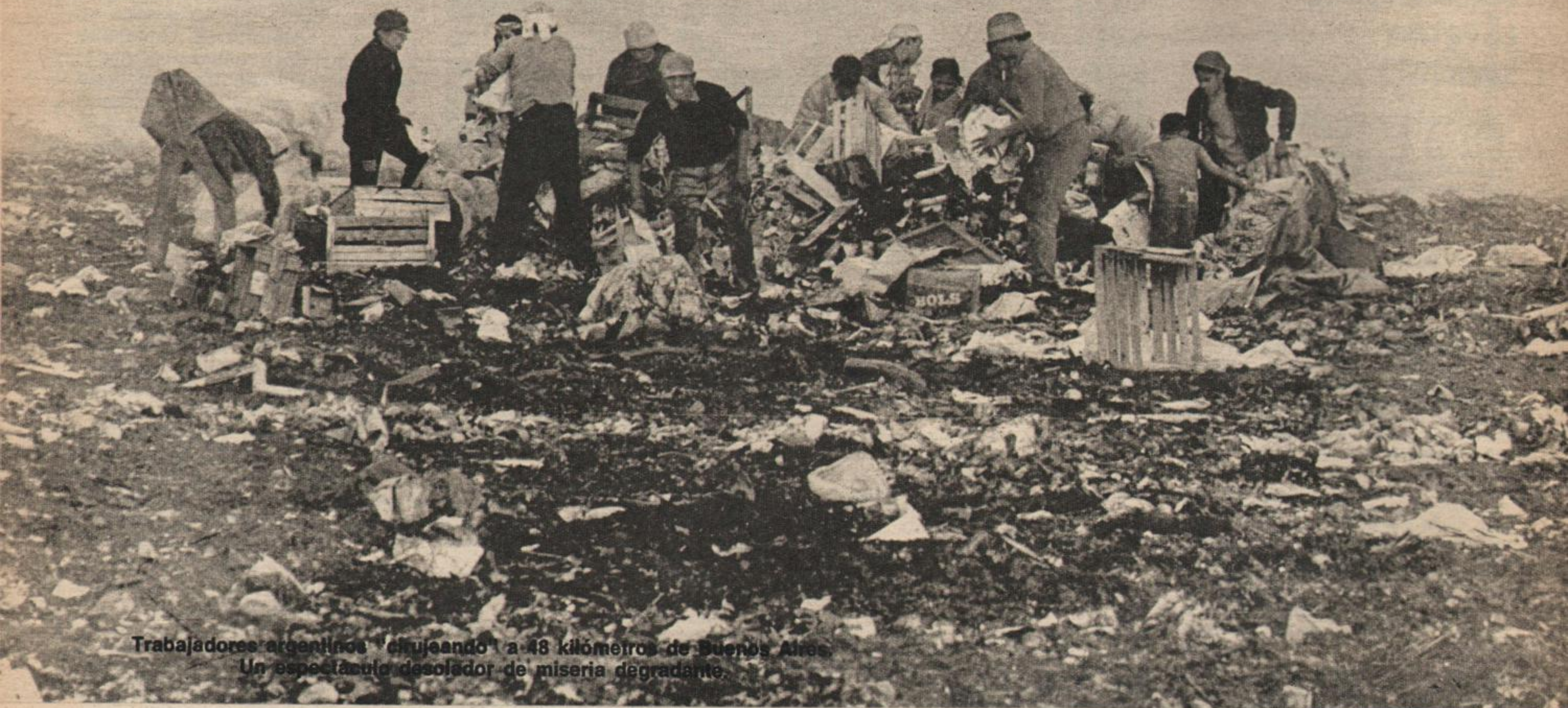
Trabajadores argentinos "cirujeando" a 48 kilómetros de Buenos Aires. Un espectáculo desolador de miseria degradante.

En una superficie de 50 kilómetros cuadrados unas 1000 personas vivían como bestias, comiendo basura y durmiendo en taperas. Los "cirujas" del Kilómetro 48, en Escobar, enfrentaron a un patrón que solo comprendió el lenguaje de la organización popular y así admitió las exigencias de los trabajadores. Degradante situación de miseria y explotación. Sin atención médica, ni escuelas, un amo prepotente vivía del "cirujeo" de los demás. La llegada e implantación de Juventud Peronista modificó drásticamente la situación. La gente organizada y un patrón que "comprende" que cambiaron los tiempos. Una fiesta con "montoneros" y sigue la lucha.