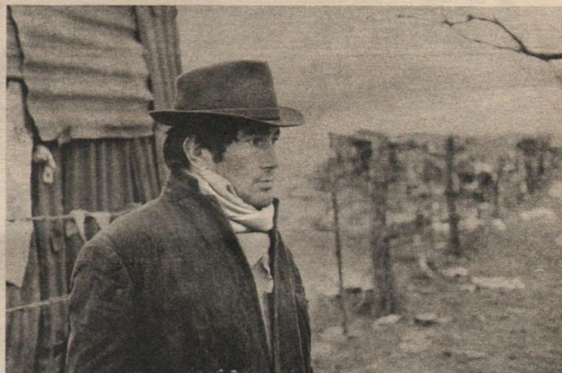
La mirada de "El Petiso", padre de 9 hijos, porque "como dijo el General, hay que poblar". Otro habitante de la "quema".

Uno de los compañeros a los cuales se acercó El Descamisado fue muy expresivo con pocas palabras: "Antes eramos vagos, ahora somos señores". Se empieza a trabajar ahora a las 7 de la mañana, en lugar de las 4 de la madrugada como antes. Y así y