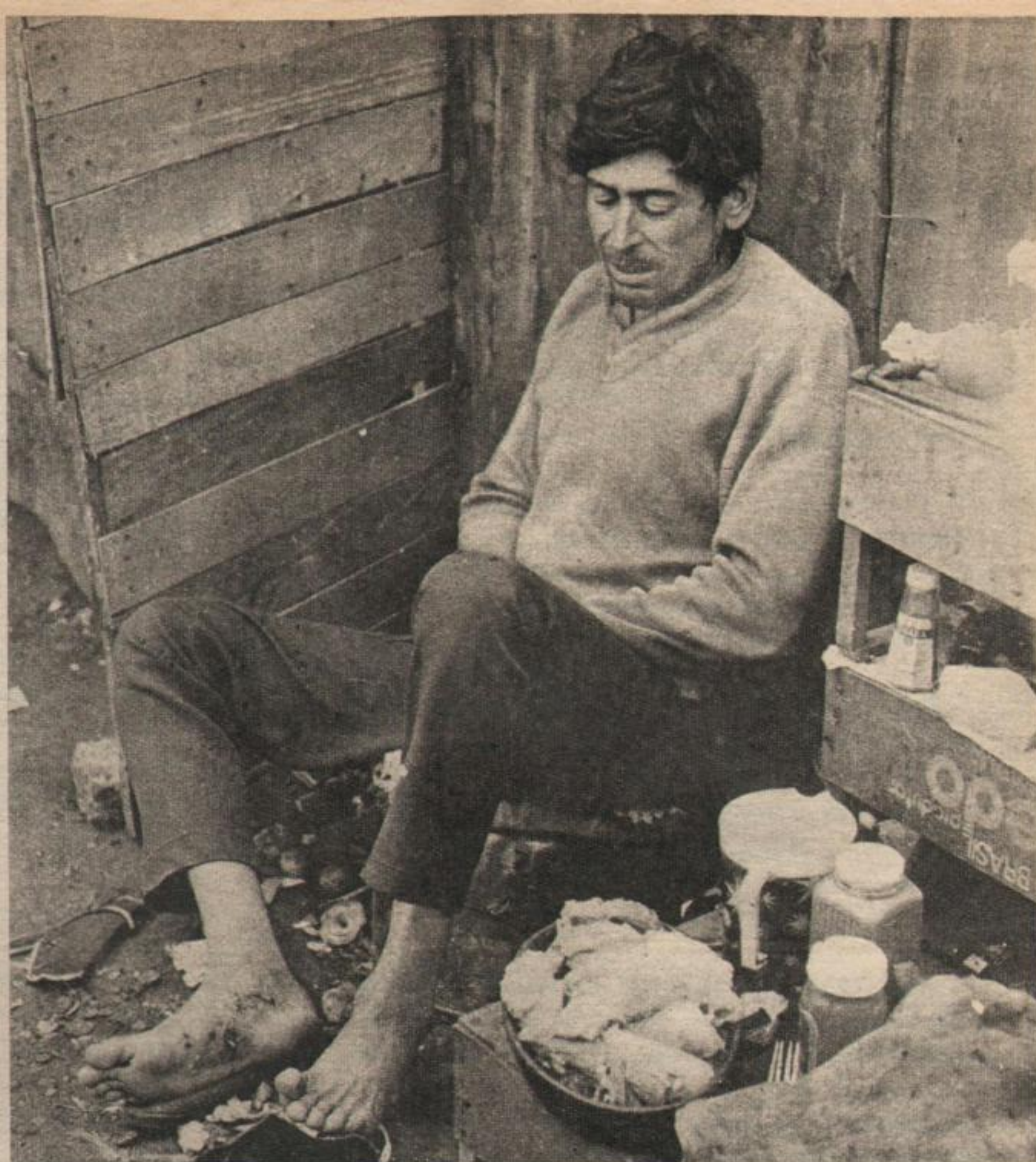
La infección de un pie cortado con vidrio o metal mientras el compañero "cirujeaba". Así se "trabaja" en el basural.

Las exigencias formuladas por los trabajadores del Kilómetro 48 fueron agrupadas en 20 pedidos concretos, los que tuvieron que ser aceptados en su totalidad por el dueño del basural. Se incluía en ellos la participación en las ganancias, el control directo sobre los libros de la "empresa", la prohibición de trabajar para los menores de 14 años, adecuada atención sanitaria, relación laboral con el dueño, levantamiento de los chiqueros que existían en el basural, separación de los capataces y —para comenzar— un aumento del 400 por ciento (cuatrocientos por ciento) sobre el precio que pagaba Pestarino por lienzo de papel, pero esta vez controlando los trabajadores el pesaje del mismo.