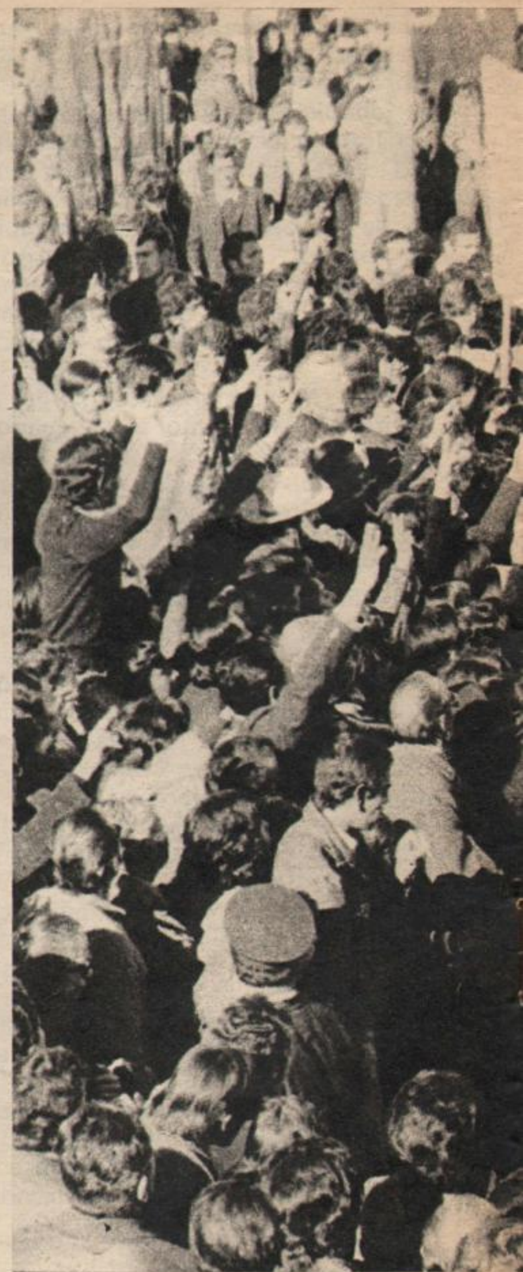
El 9 de junio, en San Antonio

MENEM: Comparto plenamente lo que piensa Perón. La revolución del 25 de mayo tiene su sentido más profundo en la defensa que harán de ella la Juventud, las FAR y Montoneros. Hay aún muchos conservadores metidos en el Movimiento, en el gobierno nacional y ésta es una lucha a muerte.