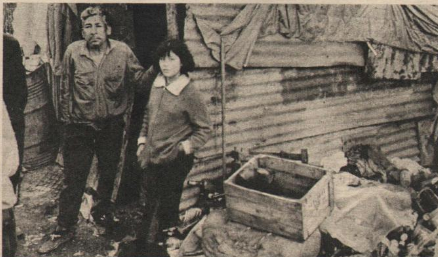
En una "casa" de este tipo viven los "cirujas" esclavizados hasta hace poco por Pestarino. Una mirada de dolor infinito.

metales. De este modo, el trabajo de los contratistas es —simplemente— cobrar por algo que ellos no realizan.