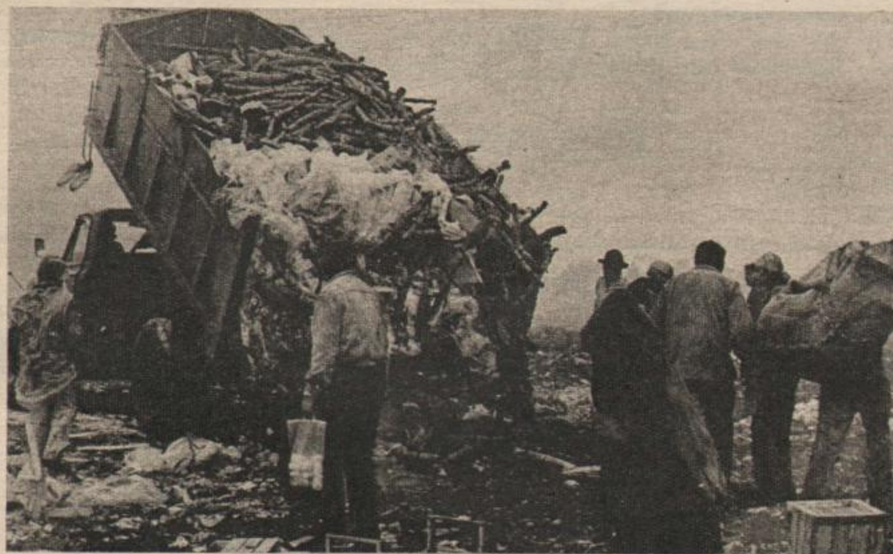
Los camiones cargan y descargan todo tipo de desechos, basura convertida en riqueza y de la cual viven 1000 trabajadores.

Los trabajadores del lugar recolectan papeles, aunque algunos de ellos se particularizan en vidrio u objetos de plástico. Los metales son comercializados por "contratistas". Sin embargo, cuando recogen los papeles los "cirujas" tienen la obligación de separar los