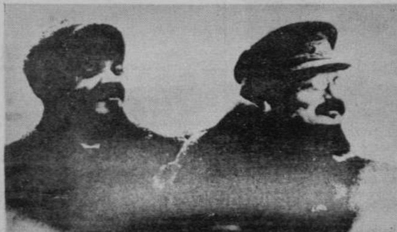
Lenin y Trotsky líderes del partido bolchevique

El 7 de noviembre de 1917 (25 de octubre por el anterior calendario...) tuvo lugar en Rusia la revolución de los obreros y campesinos que instauró el primer Estado Socialista sobre la faz de la tierra. Quedaba inaugurada así en los hechos, la era histórica de liquidación de la explotación del hombre por el hombre y de construcción del socialismo. El marxismo -teoría y práctica conciente de la lucha de los explotados por liberarse de sus cadenas- había encontrado en el partido bolchevique de Lenin el instrumento político adecuado para conducir a las masas trabajadoras a la toma del poder. Cincuenta y dos años después, cuando la población de medio planeta se halla ya en la tarea de construcción de la sociedad socialista, y otra media tiene por delante la gigantesca tarea de hacer todavía su demorada -cuando no traicionada- revolución, el mejor homenaje que podemos rendirle a esa revolución triunfante los que hoy -en la generación del Che Guevara- enarbolamos la bandera del marxismo leninismo, es abreviar en sus enseñanzas y en las de sus dirigentes y maestros -principalmente Lenin y Trotsky- para hacer realidad la "gran cadena de revoluciones proletarias triunfantes" que fuera la idea patrocinante de quienes hace cincuenta y dos años construyeron su primer eslabon