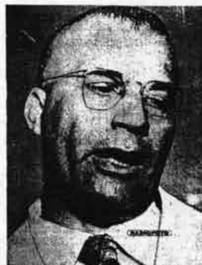
Carlos Marighella, jefe del MR-8 (Movimiento Revolucionario 8 de Octubre) grupo izquierdista que toma su nombre de la fecha en que asesinaron al "Che" Guevara.

"Acción Libertadora Nacional (ALN) Movimiento Revolucionario de Octubre"