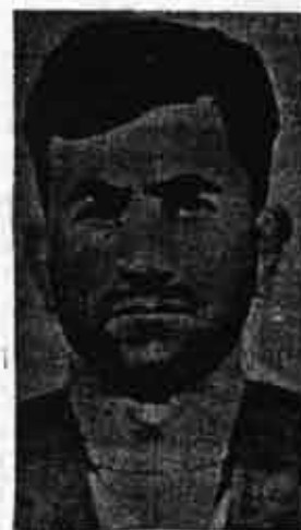
Raúl Sendic Antonaccio: para muchos, el líder indiscutido del MLN. Permanece en la clandestinidad.