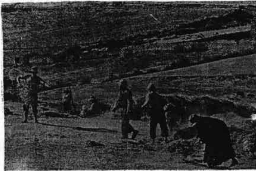
Los indígenas de un ayllu trillan el trigo como sus antepasados; atrás, un viejo canal incaico.

En este proyecto, la Junta Militar tiene límites verdaderamente de hierro: en lo económico no puede ir más allá de lo que le permite su propio respeto por la propiedad privada capitalista; en lo social no podrá, -sino muy transitoriamente-, mantener en vereda a los sectores populares que intenten movilizarse independientemente, y tampoco podrá detener la dinámica social de la lucha de clases que inevitablemente desatarán las medidas que componen la espina dorsal de su proyecto; en lo político, por más que cuente por una etapa con la adhesión de vastos sectores (instituciones, partidos, sindicatos, etc.) no tendrá más remedio que apoyarse en unos para contrarrestar la acción y la reacción de los otros, y por esta vía darle a la política peruana -quizá en un plano más agudo- un carácter más cristalizado y definido respecto de los intereses de clase en pugna.