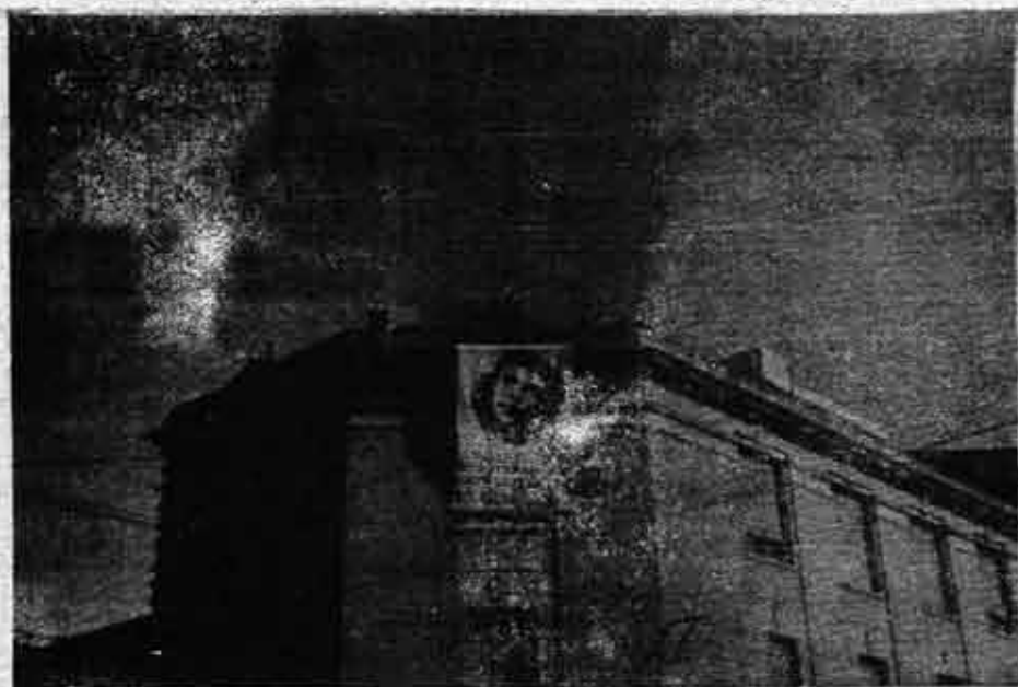
EL RETRATO DEL CHE EN EL EDIFICIO OCUPADO DE LA FACULTAD DE INGENIERIA QUIMICA DE SANTA FE SIMBOLOGIZA LA NUEVA CONCIENCIA REVOLUCIONARIA DEL MOVIMIENTO ESTUDIANTIL ARGENTINO

La toma de la Facultad de Ingeniería Química de Santa Fe fue el más importante hecho político de la ciudad ante la presencia en el país de Rockefeller. Acción de proyección no sólo local sino también nacional, que contó desde el principio con la combatividad y decisión de lucha de un sector considerable del movimiento estudiantil con bien definidos objetivos: Repudio a la visita del personero del imperialismo yanqui, a la nefasta política de la dictadura, en apoyo combativo al paro del 1º de la CGT de los Argentinos. Esto lo han demostrado claramente los comunicados dados a conocer a la población a través de altoparlantes ubicados en los frentes de los edificios, por medio de los cuales se propalaron además durante la mayor parte de las 24 horas de toma, canciones revolucionarias, la Internacional y la carta de despedida del "Che".