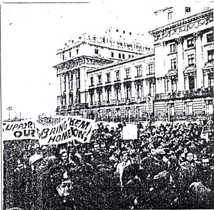
En EE.UU. las movilizaciones estudiantiles y populares se suceden a diario. Los estudiantes constituyen la cabeza de esas movilizaciones, como esta que registra el grabado, contra la agresión al pueblo vietnamita.

Pero el movimiento estudiantil antiimperialista no puede ni debe quedarse allí. Debe dirigirse también con su propia política al conjunto de la clase trabajadora, poniendo el acento en la profunda relación que tiene la lucha del Vietcong con la lucha de los obreros contra la patronal y la dictadura, demostrando como en Vietnam está el más claro ejemplo de lo que pueden hacer los pueblos cuando una auténtica dirección revolucionaria dirige y encabeza la lucha armada contra el imperialismo y las burguesías nativas. La vanguardia del movimiento estudiantil tiene el deber de volcarse a la clase obrera, ligándose a su vanguardia, realizando pintadas en zonas obreras, actos agitativos y volanteadas en las fábricas; visitas a comisiones internas y cuerpos de delegados fabriles para organizar el apoyo a la campaña; y formación de comisiones obrero-estudiantiles de apoyo al Vietnam.