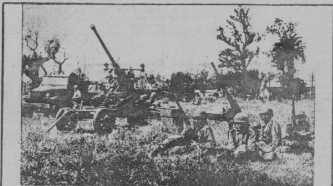
NO SON NI AZULES NI COLORADOS... AHORA LA OLIGARQUIA MILITAR ARGENTINA ESTA UNIDA PARA HACER LA GUERRA A LOS TRABAJADORES Y AL PUEBLO. SEMBRANDO GUERRA COSECHARAN GUERRA Y SERAN DERROTADOS.

En Rosario como en Córdoba, sobró heroísmo, hubo menos improvisación en la gestación y en el curso de la lucha, y formas más organizadas de sostenerla durante tres días, pero igualmente faltó la dirección, la organización y el aparato técnico que suponen una fuerza militar del pueblo previamente adiestrada para enfrentar con éxito, en larga lucha, a un enemigo desesperado y en crisis, pero dispuesto a utilizar sus poderosas armas y apelar a todos los medios. Faltó el Ejército revolucionario. La necesidad de este ejército del pueblo para enfrentar a sus opresores ha comenzado a ser comprendido prácticamente por los rosarinos que combatieron en las calles. Esta creciente comprensión posibilitará que próximas jornadas cuenten con mas y mejores Comandos armados, y la acción de estos Comandos, inevitablemente hará que se busque la forma de ligarse entre sí y transformar la lucha molecular, atomizada, parcial, en acciones centralizadas de mayor envergadura, sujetas a un plan y a objetivos