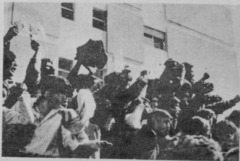
— El Régimen cosecha nuevos frutos en Cipolletti