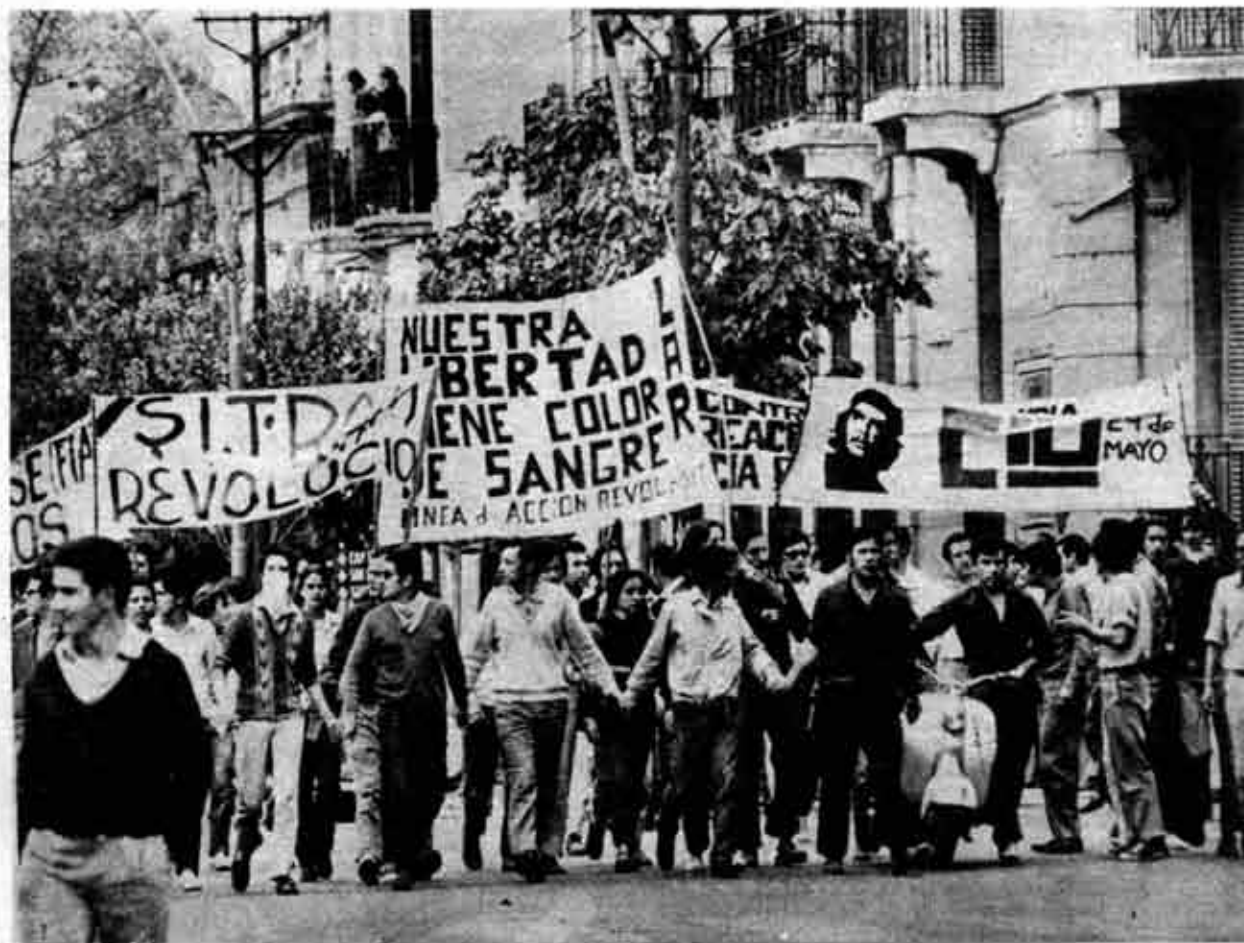
Lo que más importa es que cuando una fábrica sale a la lucha los compañeros de otras fábricas salgan a la calle a apoyarlos.

—Nosotros venimos batallando por la unidad de todas las organizaciones de lucha que están por un cambio de dirección en el movimiento obrero, y que están por la toma del poder por los trabajadores. Creemos que la única salida es instaurar un nuevo régimen en la Argentina, un régimen socialista. Nos identificamos con la línea de Córdoba, con Sitrac-Sitram. Planteamos que cuando salga a la lucha una fábrica no esté sola. Si no es la CGT, la CGT traicionera, que sea por debajo, que las comisiones internas tomen la iniciativa. Cuando el conflicto de FAE nosotros en solidaridad hicimos un paro y recolectamos dinero entre todos los compañeros de la fábrica. Pero esto es mínimo, si bien el dinero es importante, lo que más importa es que cuando una fábrica sale a la lucha los compañeros de otras fábricas salgan a la calle a apoyarlos.