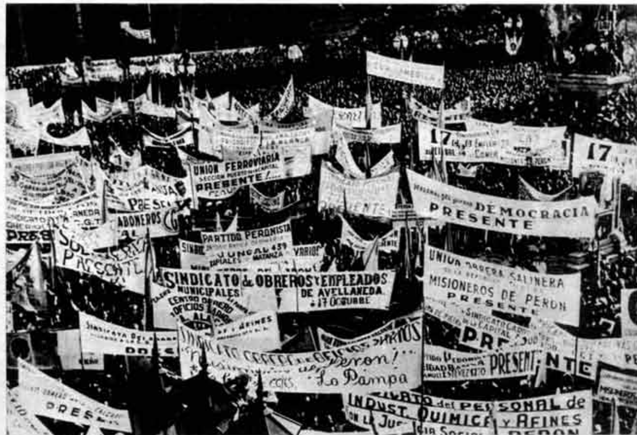
El "aluvión zoológico" se descubre clase trabajadora.

a) Perón dio UNA IDENTIDAD a las masas, que se reconocieron y se identificaron en el Peronismo.