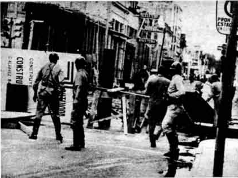
El poder militar de los dominadores no es omnipotente, solo que hay que saber golpear, donde duele y cuando duele.

riores para nuestra lucha, ir creando la organización revolucionaria de clase que dirija políticamente nuestros esfuerzos hacia su fin: la liberación nacional y el socialismo. Por ello nosotros decimos: La patria dejará de ser colonia con la clase obrera en el poder, y decimos eso porque ya no creemos en "desarrollistas", "nacionalistas", "populistas", "golpistas", solo creemos en nuestras propias fuerzas de clase explotada.