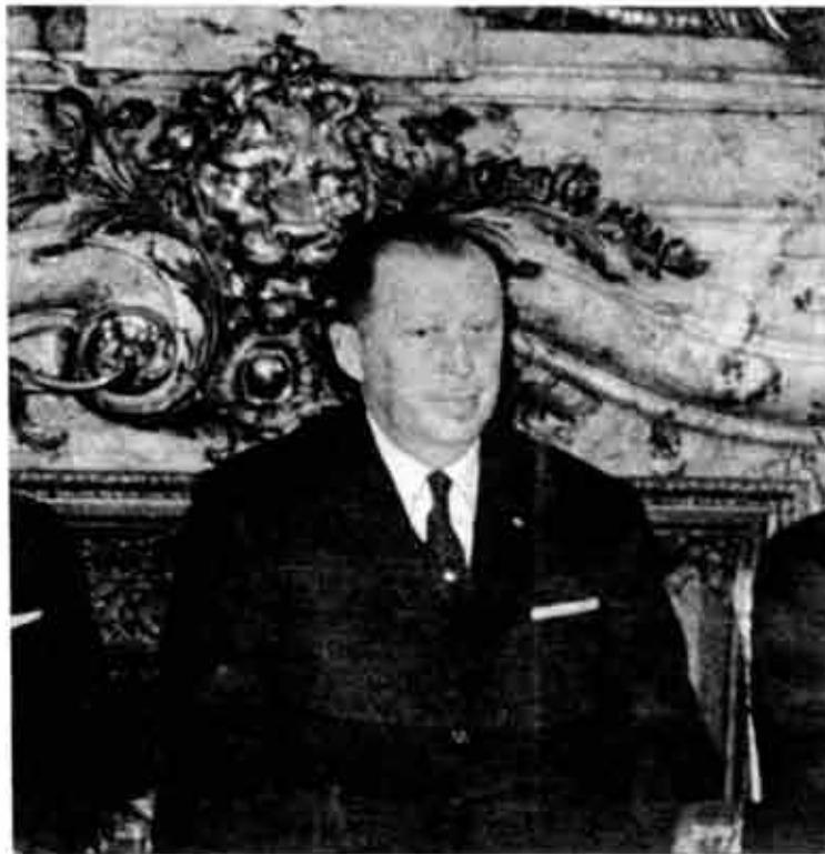
Un gobierno corrompido.

Entonces, yo sentía cómo torturaban a esa otra persona. Estaba al lado, en la otra pieza.