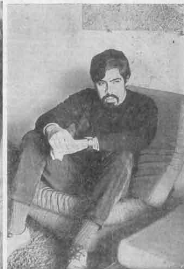
Marta Minujin + Eliseo Verón Happening y ciencia Los bufones del rey.