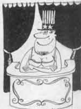
CASA DE TOLSTOJAN CIA