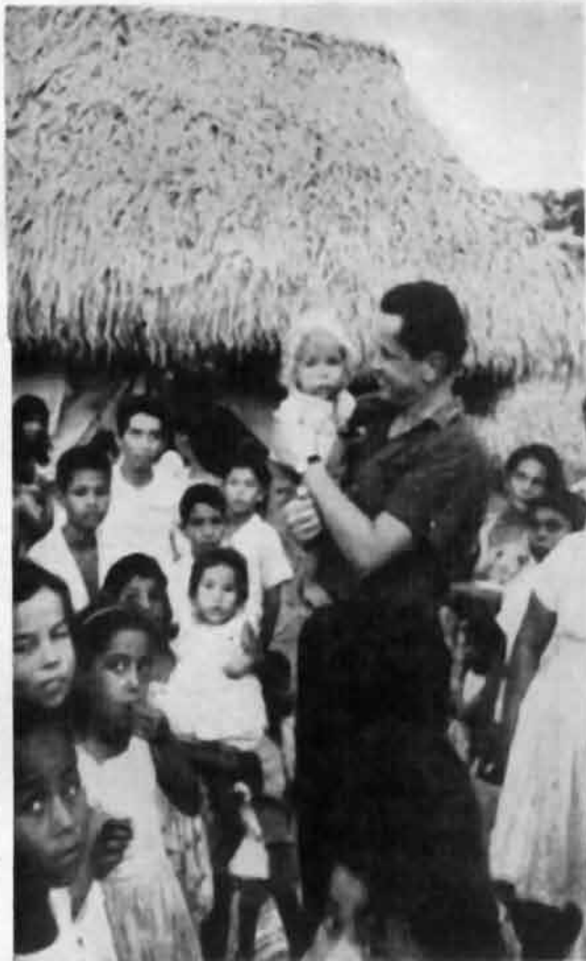
Camilo Torres con los campesinos colombianos.