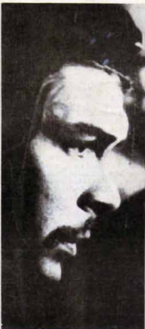
FIDEL: Prólogo al diario del CHE