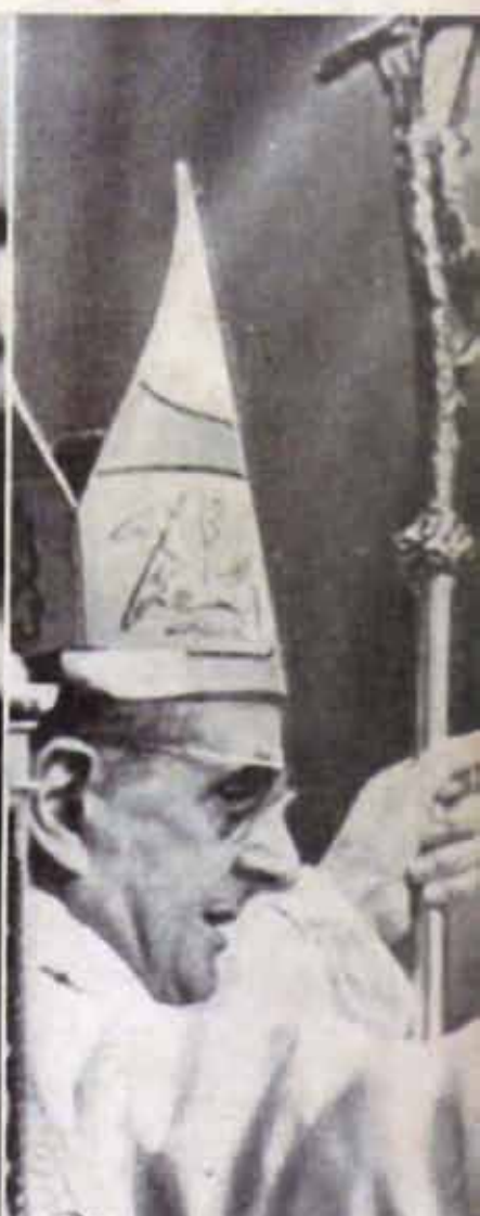
ALERTA por su viaje