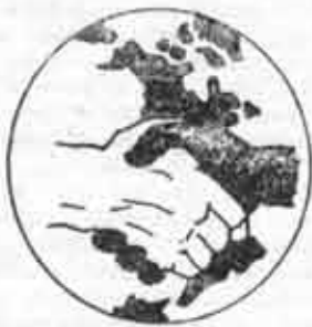
Emblema del SNCC: dos manos enlazadas sin odio sobre América.

Se los ha tratado de hacer lucir como adalides de la venganza infectados del virus comunista, etc. Aparentemente tienen todo en contra. Y como hace casi 20 siglos salen a la luz del día no a pervertir sino a sembrar, no a destruir sino a crear lo que no tienen, no para someterse sino para rebelarse y aun más, para hacer una Revolución, para convertir en vida la justicia. Se equivocan, se rectifican, caen y se levantan. Sobre la marcha van aprendiendo y enseñando lo que jamás nadie les proporcionó, pero que en el fondo latir de las visceras ruge clamando por algo que no tiene fronteras, colores o nomenclaturas. Algo que llegará al fin como el futuro, por la prepotencia del trabajo. La pantera negra es la imagen de un espíritu que en la hora de los pueblos sojuzgados habla un idioma por momentos amargo, pero siempre noble. El idioma de los que alzan su voz y su fuerza ante los que no les dejan ser humanos, ante los que por amor entienden retórica eficiente. Poder Negro significa esperanza y una razón para vivir. Unidad y organización son su combustible. De abajo hacia arriba, como la semilla en el surco, como la vertiente en el desierto.