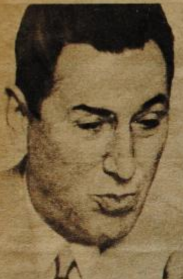
Dime a quién reconoces "autoridad moral"