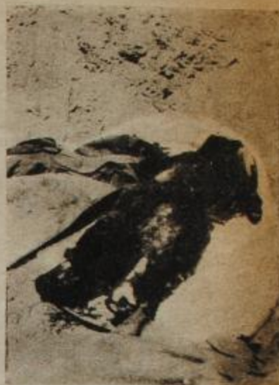
Otra "mancha", otro cadáver. Algo que horas antes era un hombre y que ahora es una acusación más contra la barbarie. Aviones, tanques, metralla. Y después: la operación limpieza: bayoneta y puñal.

TUNEZ. — Un hombre se inclina, levanta una sucia manta y el olor comienza a ser insoportable detrás de la precaria gasa húmeda de cloroformo que quiere servir de máscara contra la epidemia que todos temen. La situación es tan increíble que una mujer finlandesa, periodista, no confía en lo que será su relato y pide la fotografien junto a los cadáveres calcinados.