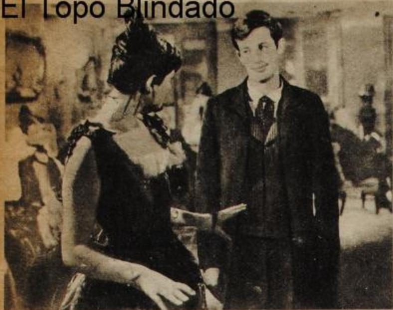
La Vieaccia: melodrama impresionista.