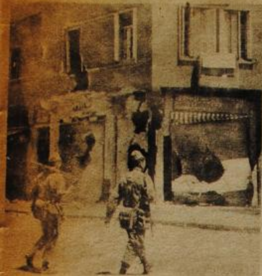
Un comando tunecino, instalado en una tintorería defendida el barrio comercial. Sobre el cayo una lluvia de cohetes y metralla. Los defensores murieron todos. Afuera, una pareja de paracaidistas, célebres por las torturas que han puesto en práctica en Bizerta.