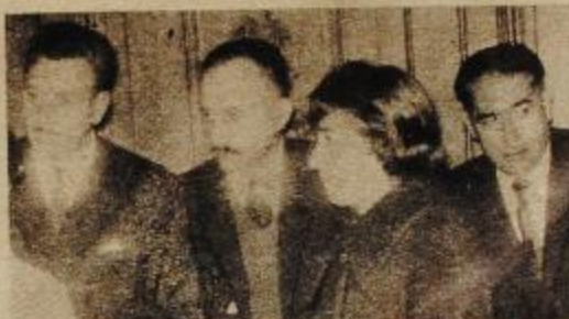
Delegados de Argentores, Artistas Plásticos, Sociedad Argentina de Escritores y Federación Argentina de Teatros Independientes.

gánica, promueve gestiones y entrevistas necesarias a su finalidad y ha elevado un proyecto para el normal funcionamiento del teatro San Martín en forma integral, es decir, utilizando al máximo sus modernas instalaciones y dando cabida a todas las manifestaciones del arte y la cultura de la ciudad y del interior del país. Este organismo transformado como decimos en Comisión cumple sus funciones "ad honorem".