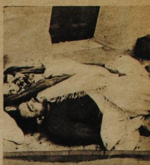
Toda una familia muerta en plena calle después de la "operación limpieza". Los cadáveres se pudrieron al sol y al sereno durante setenta y dos horas. Después, cuando se comenzó a temer una epidemia, se les enterró en un dantesco sepelio colectivo.

rial", y suena a caricatura. Caricatura de 1.000 muertos y de fin de un imperio decadente.