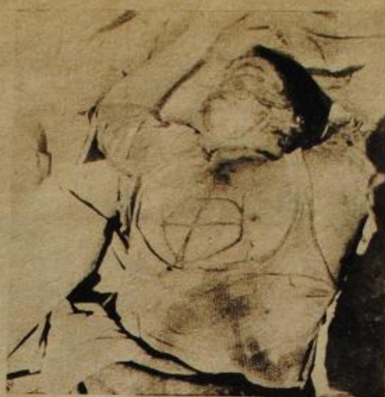
Este ya más que un cadáver, es un documento. Sobre el pecho de este tunecino asesinado, alguien —su verdugo— talló a punta de cuchillo o de bayoneta la cruz celta, depurada versión de la swástica nazi utilizada por el fascismo francés. Y el caso se repitió varias veces.