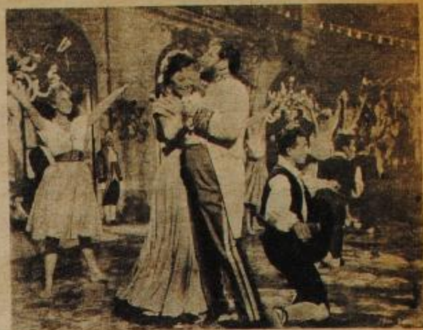
Romanoff y Julieta: barba sola no alcanza.