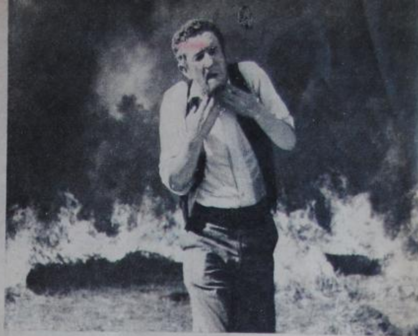
Mario Soffici en "Esta tierra es mía".