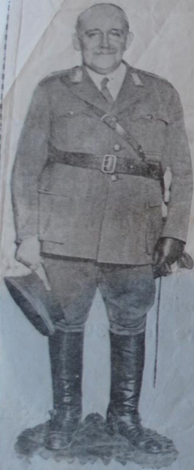
Señor General de División Don Agustín P. Justo Futuro Presidente de la República