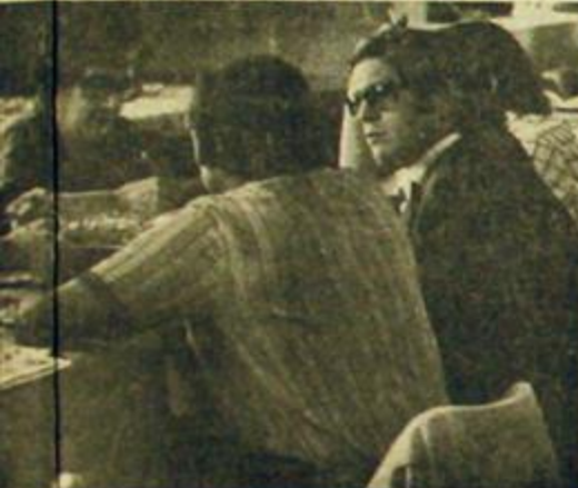
a un proyecto de liberación.