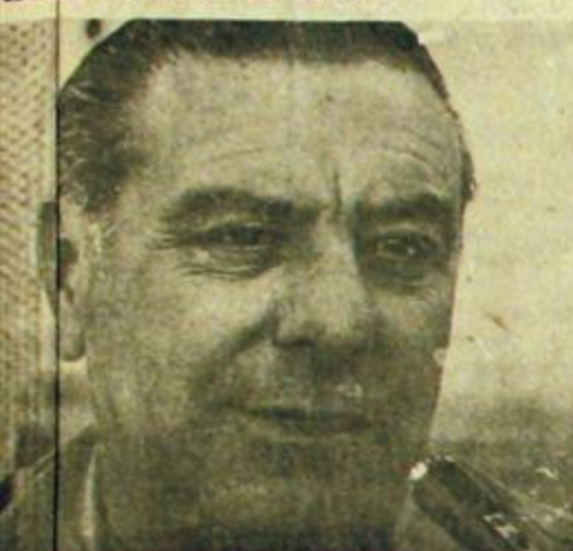
Améz, un parlamentario auténtico.