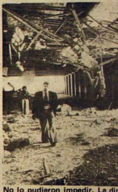
No lo pudieron impedir. La dir...

Se consignó a usar es: "EL PERONISMO VUELVE CON EL PARTIDO AUTÉNTICO".