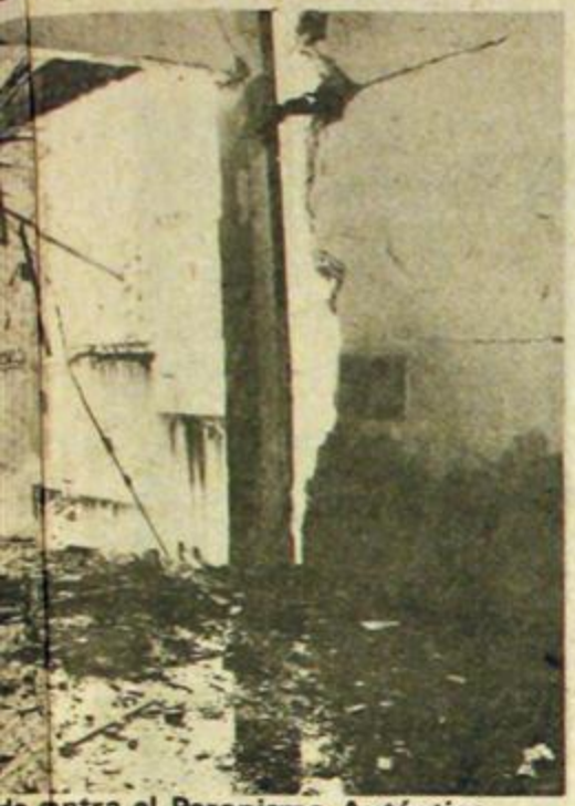
do contra el Peronismo Auténtico.