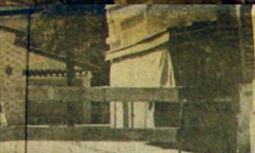
políticos de Córdoba.