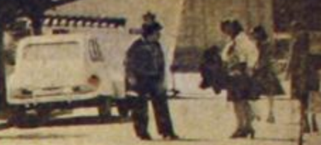
Una delegación de compañeras vi...

—En mi provincia pasa lo mismo que en todo el país. Las familias que trabajan en los viñedos sufren una explotación desmedida. Las mujeres y niños trabajan a la par del hombre sin ninguna protección. Los chicos no pueden ir a la escuela porque deben participar en la cosecha. Y cuando los viñateros no quieren levantar la cosecha, las familias son echadas y se quedan sin un peso para su sustento. Con esas injusticias vamos a terminar cuando, como dijo Evita, "la raza de los oligarcas desapareca definitivamente de nuestra tierra". ♦