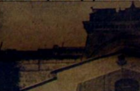
Una delegación de compañeras vi...