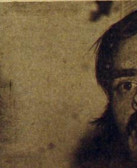
Apoderado del P.A. cordobés, Hug...