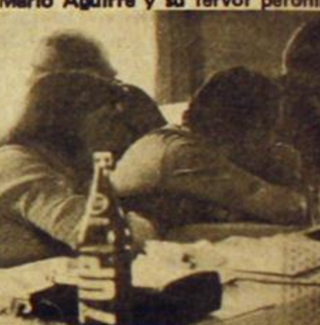
Un trabajo arduo, el de las comi...