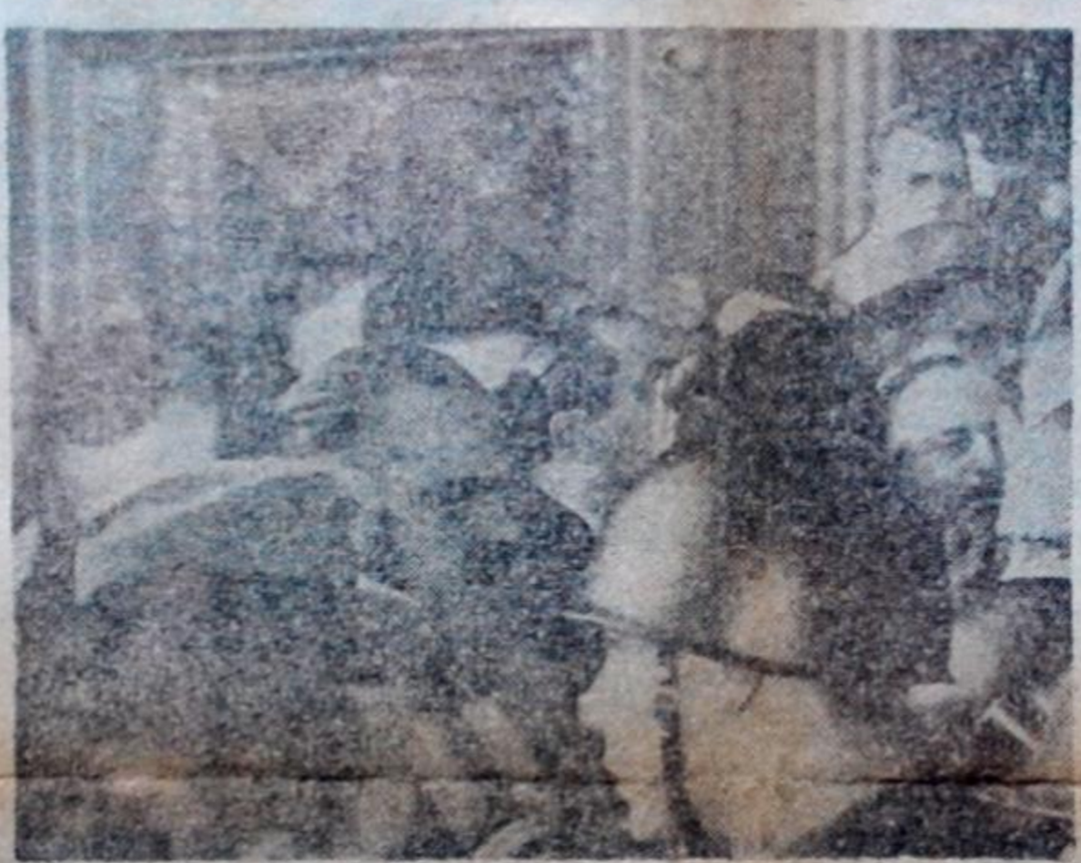
LO QUE EL SEÑOR BECERRA NO VIO

Pero, en donde la farsa se convierte en comedia es cuando el Sr. Becerra, sin sonreírse, dice que dentro del "ámbito de su poder" había dado órdenes expresas para que entraran los diputados electos por él invitados.