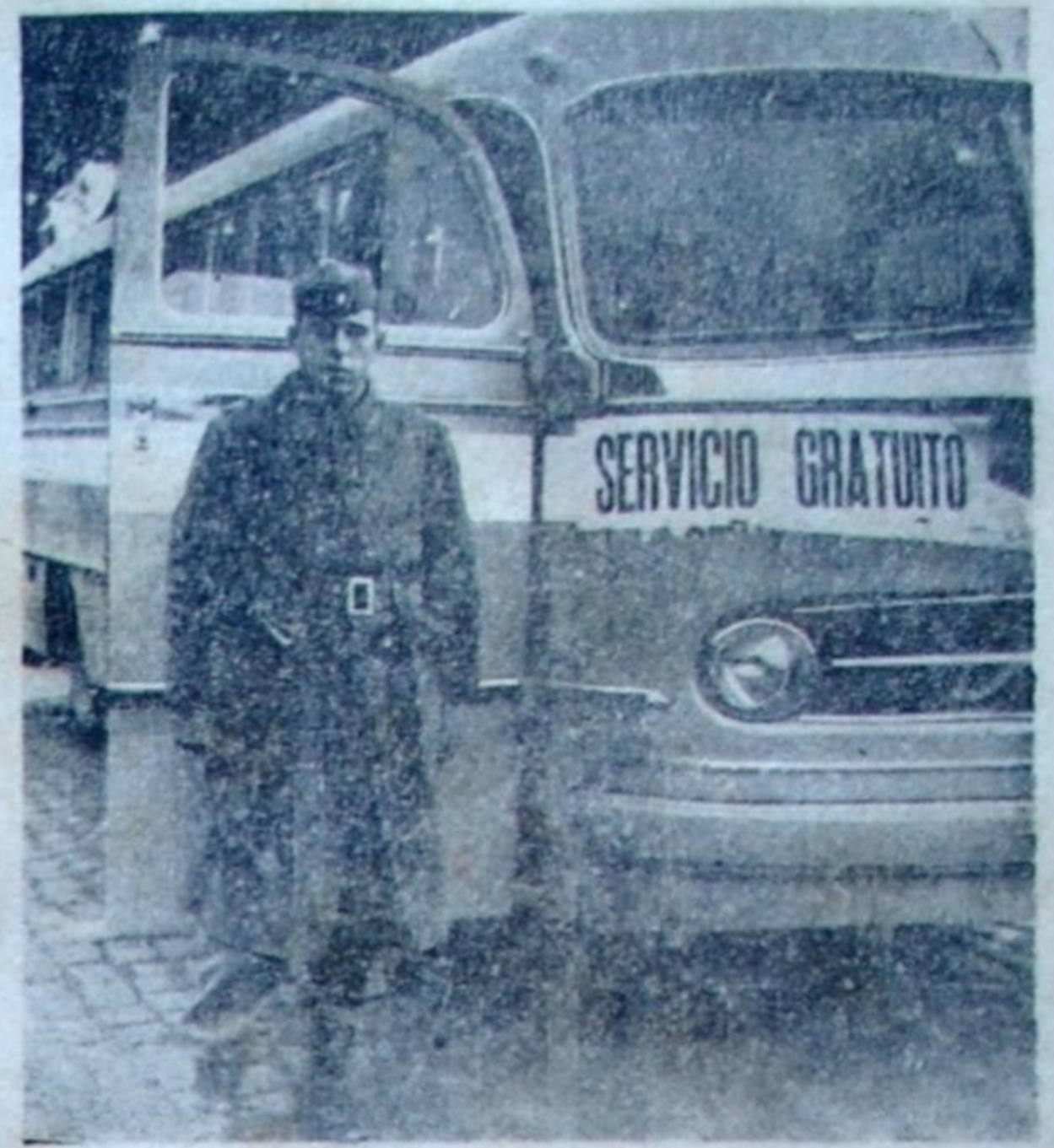
SERVICIO GRATUITO... SIN PASAJEROS EL PUEBLO NO SE DEJA ENGAÑAR.