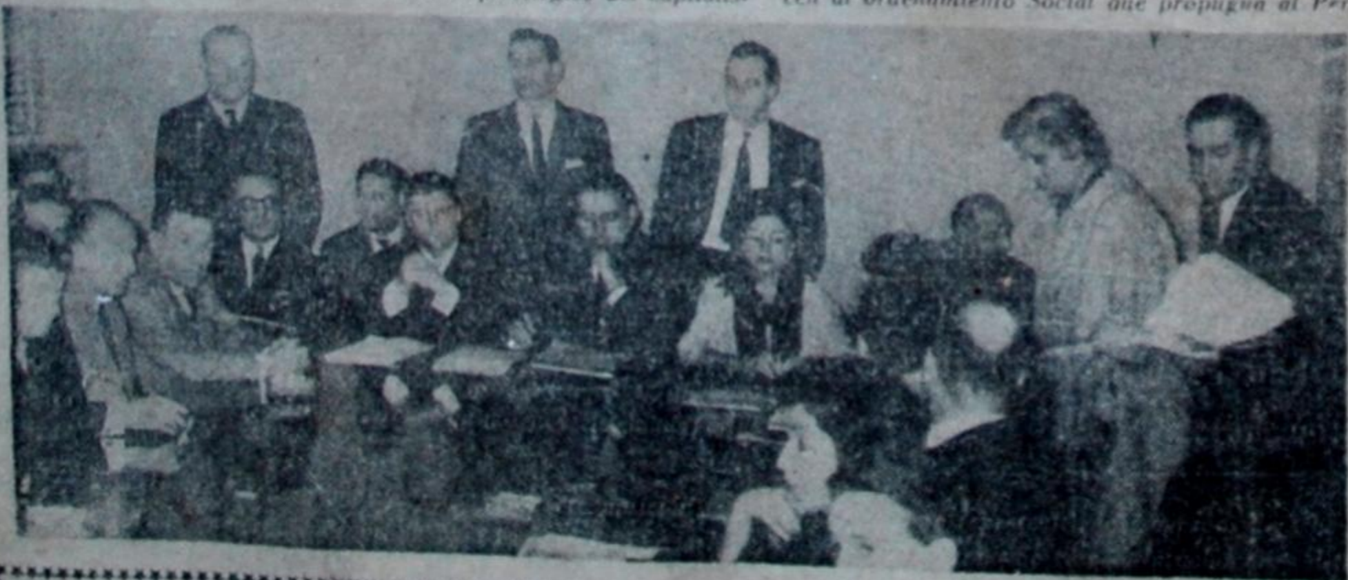
Aspecto parcial de la reunión efectuada por los miembros del Consejo Nacional Peronista, ante la cual se efectuaron trascendentes resoluciones.

SOY UN GENERAL QUE, POR LO MENOS, NO HA HECHO DERRAMAR LAGRIMAS A SU PATRIA. Gral. José de San Martín