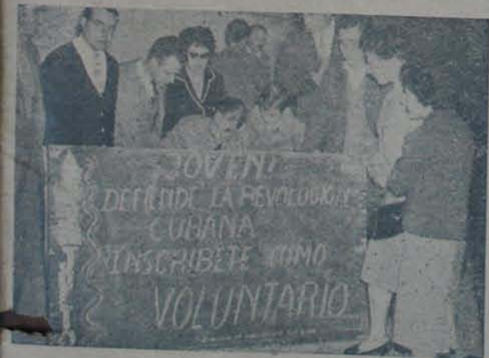
LA AFLUENCIA DE VOLUNTARIOS. — Dependiente de la Comisión Argentina de Solidaridad con la Revolución Cubana se ha establecido un registro donde permanentemente se inscriben voluntarios, hombres y mujeres, para constituir las milicias latinoamericanas que han de defender la revolución cubana.