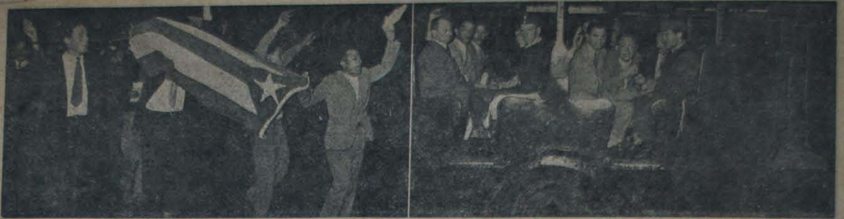
NO OCURRIO EN CUBA NI EN LOS DIAS DE BATISTA.—La presencia de una bandera cubana sostenida por brazos juveniles no debe inducir al error de pensar que se trata de algo ocurrido en la Perla de las Antillas en la época de la feroz tiranía. Las fotos fueron tomadas en la noche del 22 de abril en las calles céntricas de Buenos Aires, y son expresiones de la protesta popular por la clausura del Luna Park y la prohibición del festival artístico que se había organizado en homenaje y solidaridad con la revolución cubana. La policía disparó abundantes cantidades de bombas lacrimógenas, hizo funcionar sus carros "Neptuno" que arrojan violentos chorros de agua, y detuvo a 53 personas como se ve en la segunda nota gráfica.