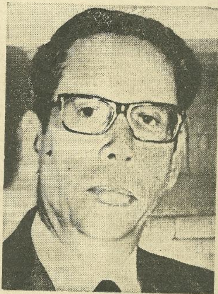
Licenciado Gustavo Díaz Ordaz: debe responder las preguntas del pueblo. . . .