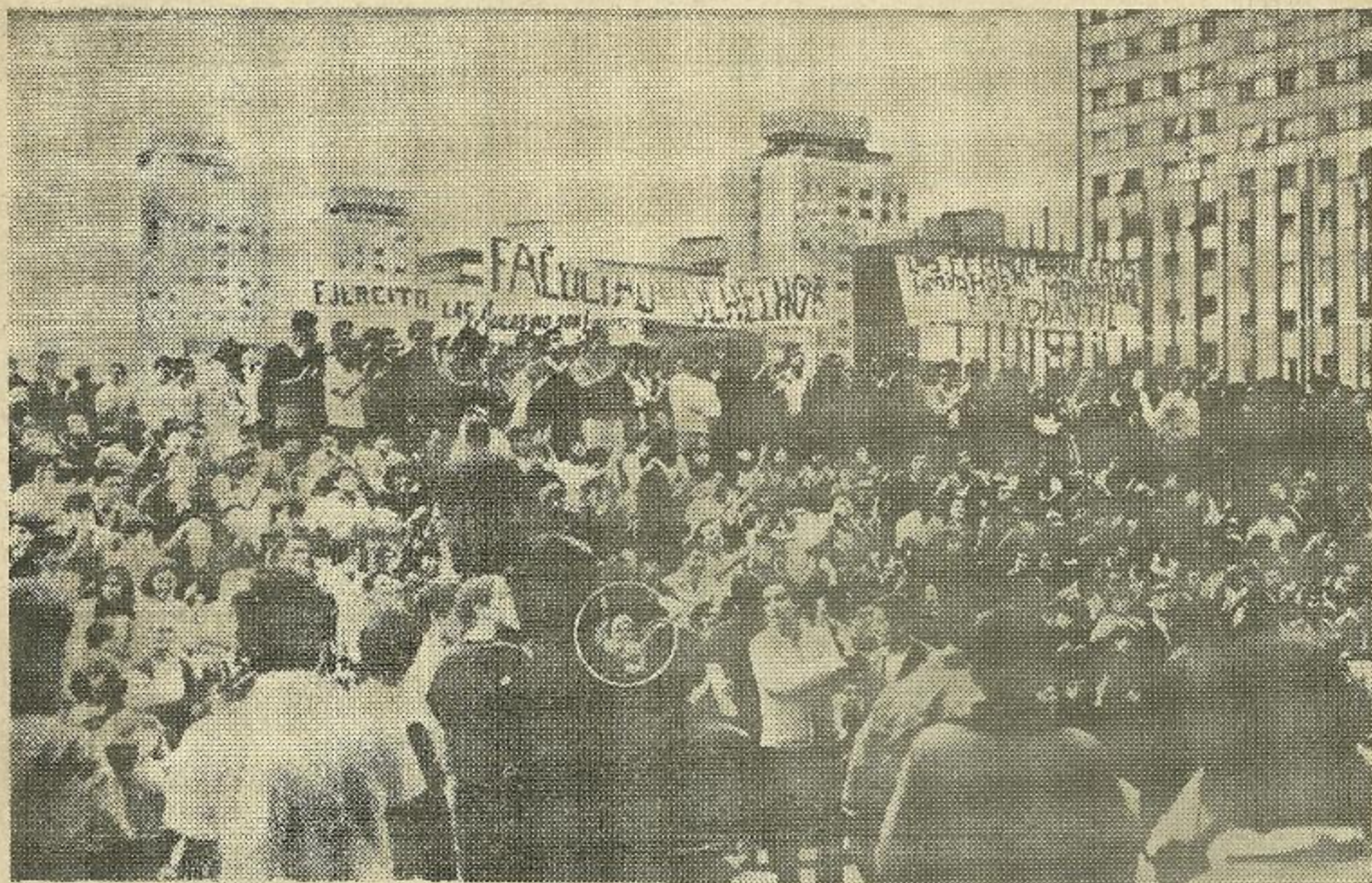
Fue una matanza inútil, urdida por mentes enfermas: los "genizaros" abrieron fuego hasta contra las madres que tenían niños en los brazos

México sin permitir oposición e invocando, como mescalina adormecedora, el santo nombre de una revolución que tuvo su último respiro de renovación a comienzos de la década del 40. Este año, se pensaba coronar la fábula con el júbilo de los Juegos Olímpicos, supuesta demostración de que México anda bien. En la ruta de la gran maratón olímpica está la calle San Juan de Letrán, que es donde han derramado su sangre una decena de estudiantes muertos y muchos otros más que quedaron heridos. Los predios centrales de la zona olímpica están rodeados de tanques y vehículos militares. El gobierno no ahorró en poderío: tan sólo para capturar el Politécnico, heroicamente defendido por los estudiantes, recurrió a 400 carros blindados.