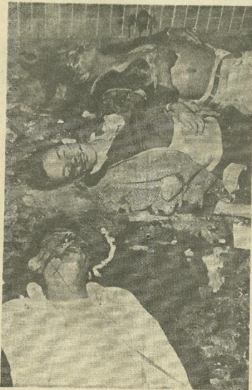
Elocuencia fotográfica: asesinada juventud representativa de la esperanza de México.

al gobierno y al PRI mantener al país bajo un control caprichoso.