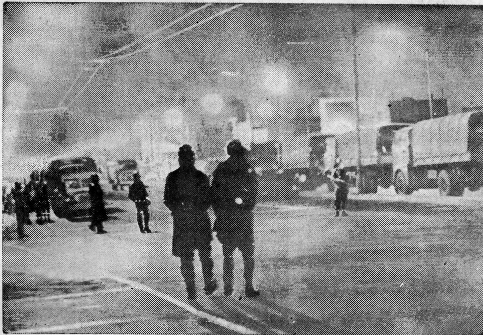
Los camiones del ejército forman barricadas en las calles adyacentes a la Universidad, en tanto fuerzas de seguridad patrullan en previsión de tiroteos

del tránsito movilizó a 350 motociclistas, setenta patrullas y jeeps con dos agentes cada uno y a la totalidad de oficiales y jefes" en apoyo a los granaderos.