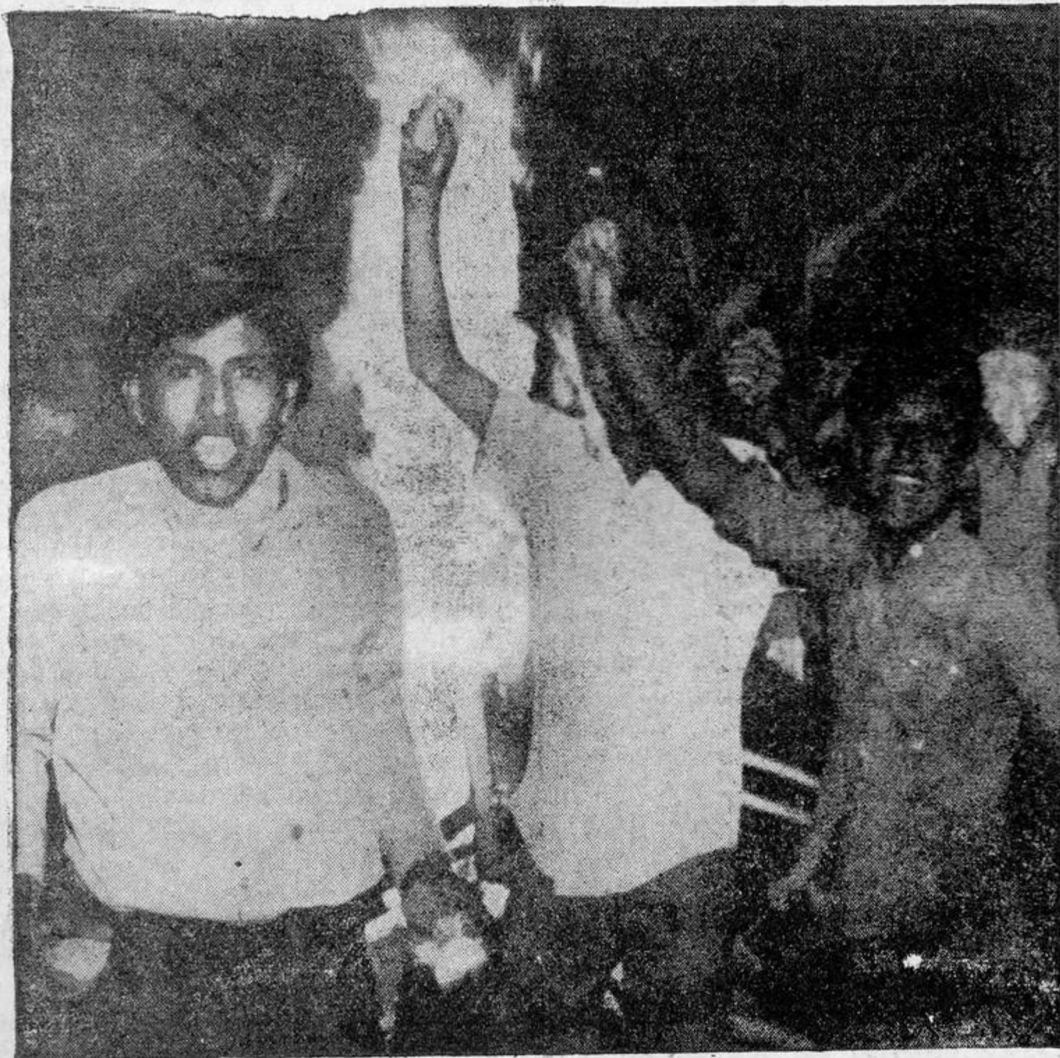
Grupos de jóvenes desprendidos de multitudinarias manifestaciones se defienden de los soldados que los acorralan

A las pocas cuerdas de marcha conjunta se produjeron los primeros choques con los granaderos, que se habían apostado en el camino a Palacio. Según reportó "El Universal" hubo refriegas "durante varias horas entre los alborotadores y los granaderos, que a macanazos los dispersaron, cundiendo el pánico entre las personas que transitaban por la zona". El despliegue de las demostraciones y la persecución consiguiente por todo el centro de la ciudad devino en batalla campal. El mismo diario señaló que "además de dos mil agentes de crucero, la policía