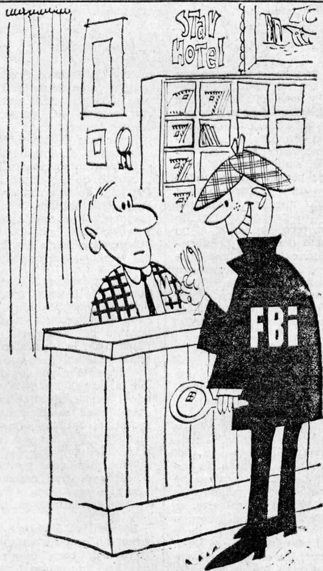
¿Tengo que acercarme más, doctor? No alcanzo a ver nada... Myers, en The Evening News (Londres)