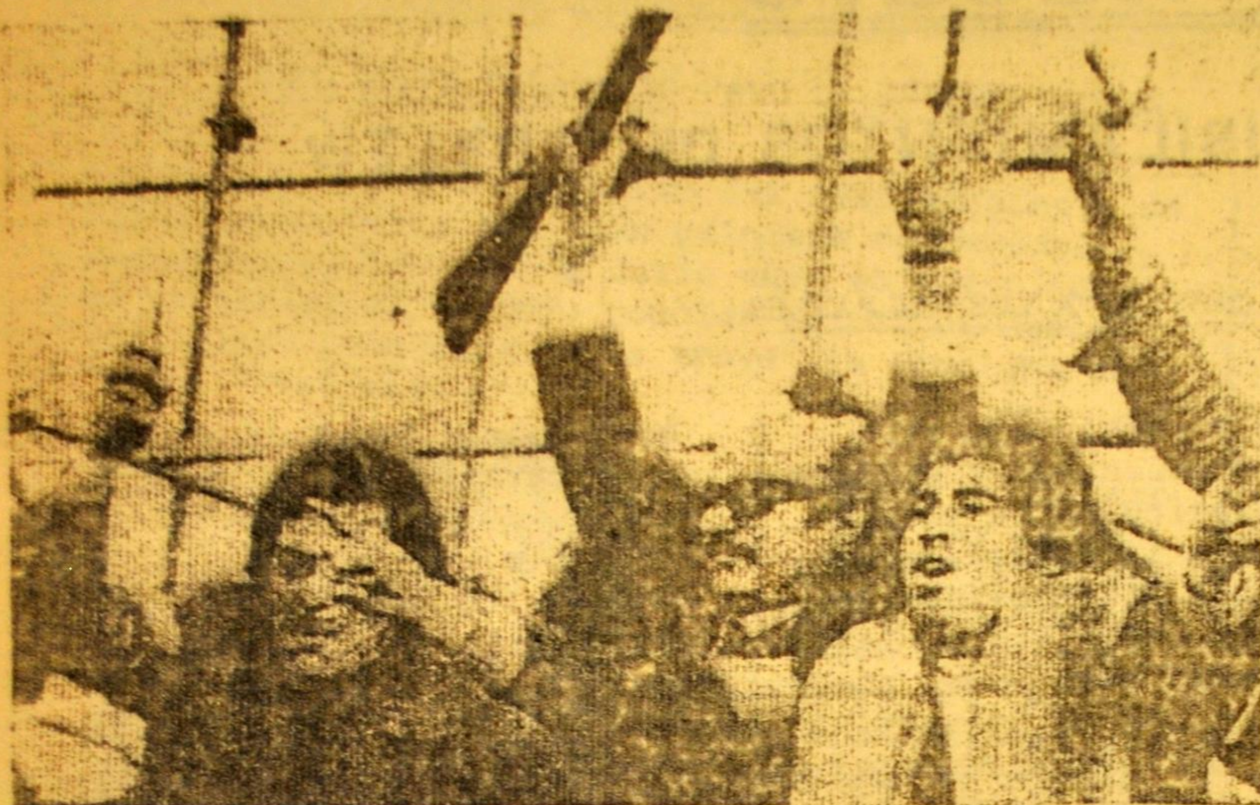
Las bandas armadas en el palco de Ezeiza.

Como vemos, algunos de los puntos del pedido de informe, por sí solos, "justificaban" la defenestración del Ministro del Interior. ¿No es así López Rega y Cía?