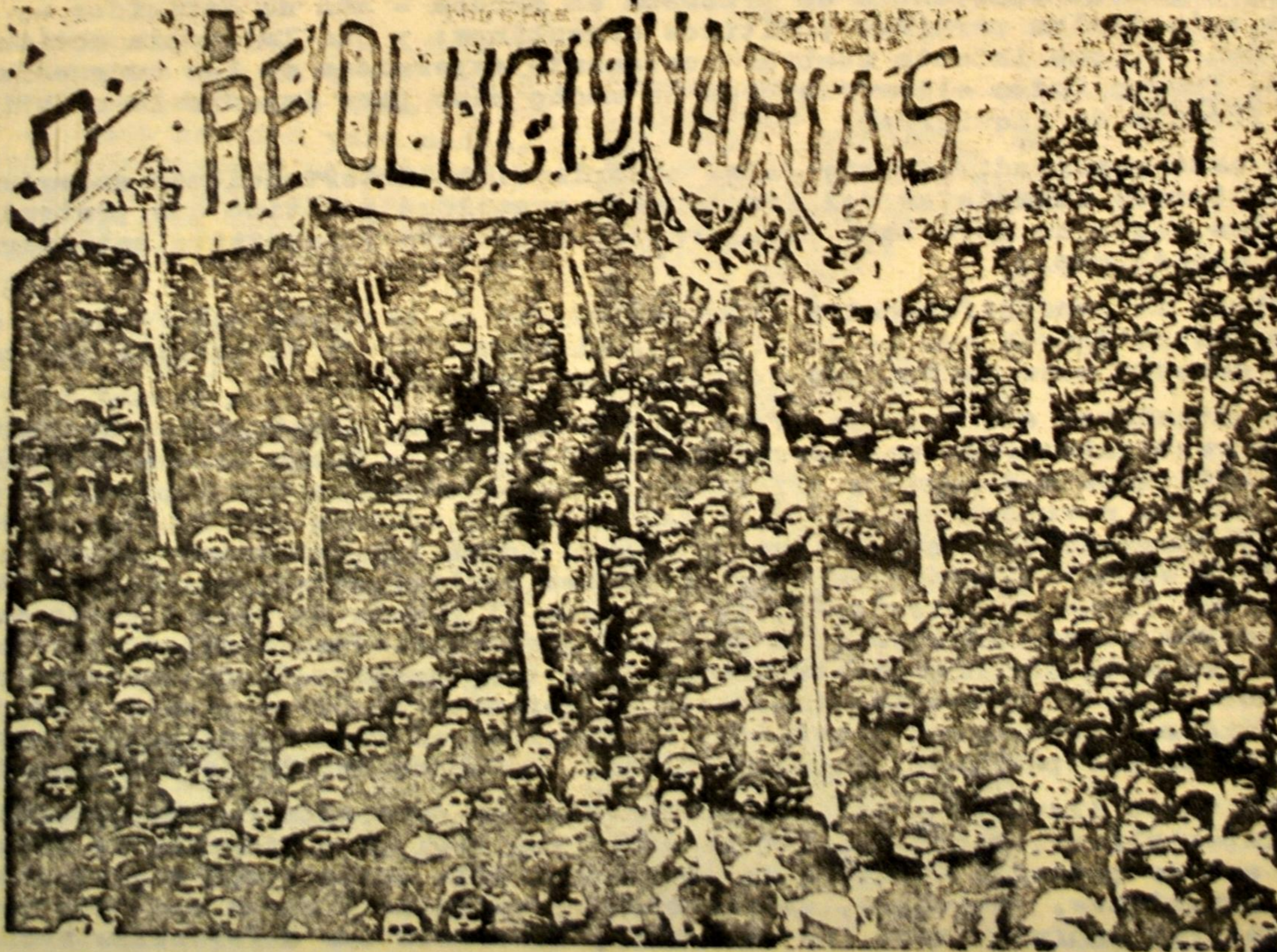
con los trabajadores...

Nosotros quisiéramos creer, por respeto a los compañeros peronistas que desde hace tantos años vienen luchando por una Argentina sin explotadores ni explotados, en las explicaciones que dan algunos peronistas para justificar las actitudes del Gral. que avalan a la burocracia y a la derecha, y que olvidan la explotación, la miseria, el hambre, el analfabetismo, las torturas y asesinatos desatados contra el pueblo por los mismos burócratas, por los mismos políticos burgueses, por iguales generales reaccionarios que hoy son aliados del General. Pero tales explicaciones, que nos hablan de "cercos" a Perón, del "secuestro" a manos de la burocracia,