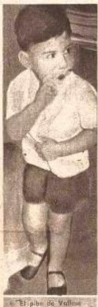
El niño de Vallese.