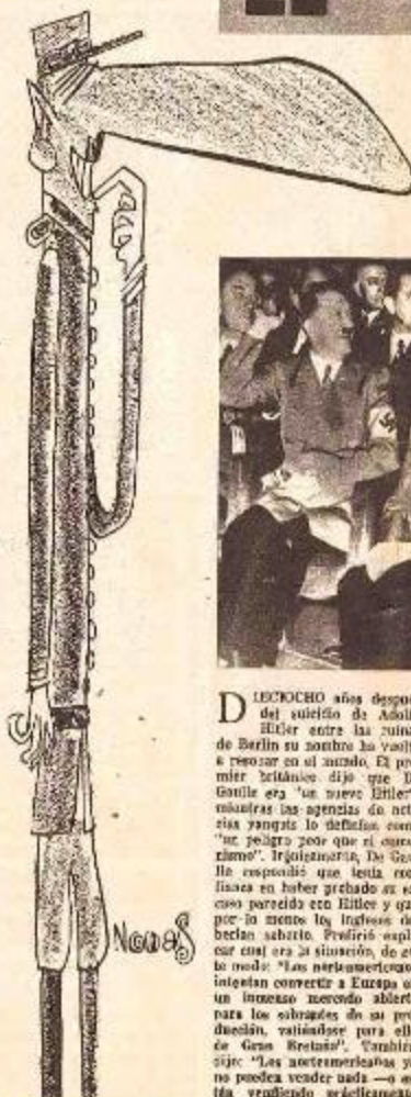
Al enfrentarse De Gaulle, EE.UU. trata de mostrarlo como "un nuevo Hitler"

del viejo estallido francés, sin embargo, para confirmar a los argelinos en un test: De Gaulle es "el nuevo Hitler"