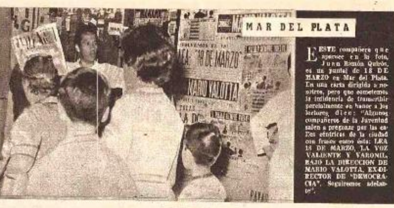
MAR DEL PLATA

¿Se admisión la hipótesis de que el Gen. ... se marginó voluntariamente de la política?