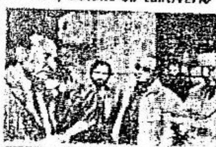
LOS COMUNICADOS DEL ERP