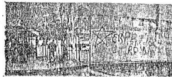
El grupo de 62 que se enfrentó a la guardia de la empresa Petrolquímica Sudamericana S.A. ubicada en Olmos (Pcia. de Bs. As.) en el 19 y 185.

De 18 a 20 individuos fuertemente armados coparon el puesto de seguridad de calle 44 y, tras reducir al personal, robaron armas.