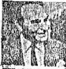
Semana de definiciones

Apareció sano y salvo en plena centro esta madrugada y en conferencia de prensa exigida por el grupo que lo secuestró, detalló su cautiverio