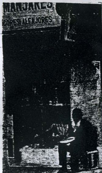
La publicidad nos pinta un mundo de maravillas; la realidad es otra...