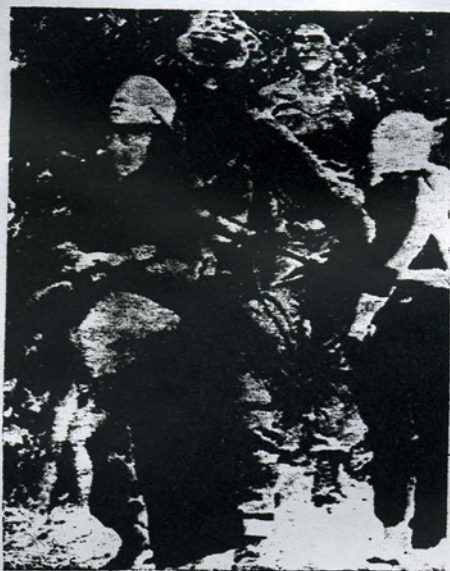
... niños, mujeres, ancianos, a los "boys" de Nixon no le quedan altas ya. Hay un pueblo que lucha por su libertad.

La poderosa ofensiva de las fuerzas revolucionarias del Frente de Liberación Nacional del Vietnam, que consiguieron poner bajo su control a mas de las dos terceras partes del territorio y la población del Vietnam del Sur, lograron hacer que las fuerzas enemigas se estrecharan en las ciudades mas importantes, lo que contribuyó a arrastrar a los norteamericanos a las negociaciones de paz en París.