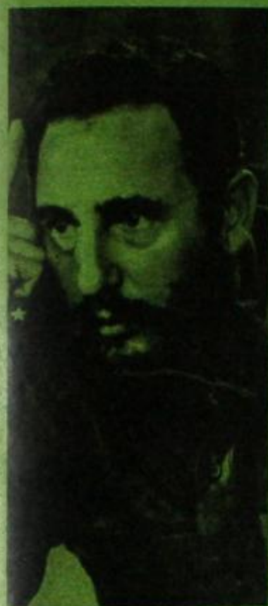
Fidel Castro: La justicia está en manos del pueblo.