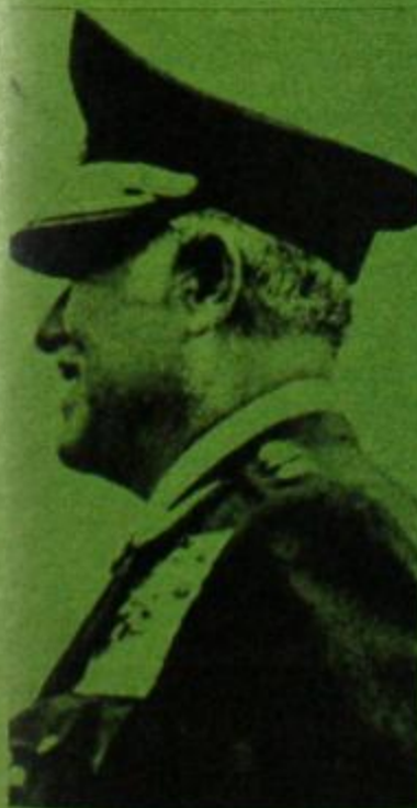
Ya hay guerrillas contra los "militares progresistas" del Perú.