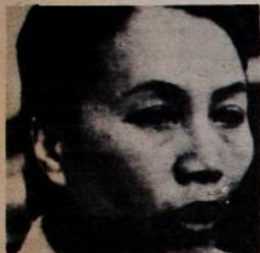
NGUYEN THI BINH

A CONTINUACION, NH TRANSCRIBE LOS DISCURSOS PRO NUNCIADOS POR LOS JEFES DE LAS DELEGACIONES DE VIETNAM DEL SUR, LA CANCELLER NGUYEN THI BINH Y DE VIETNAM DEL NORTE, LE DUAN, EN EL TRANSCURSO DEL 25º CONGRESO DEL PARTIDO COMUNISTA DE LA UNION SOVIETICA.