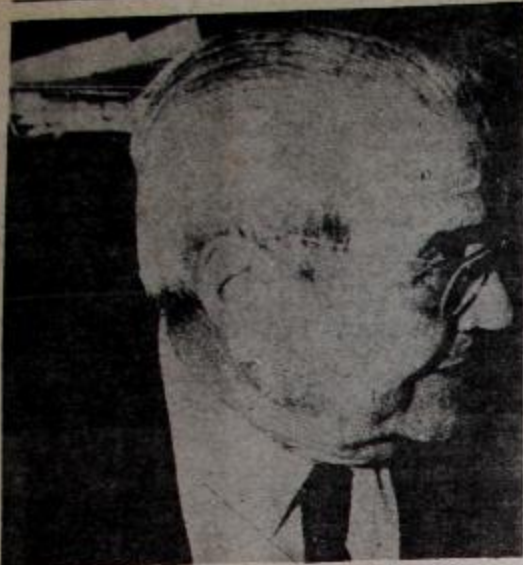
De Ricardo Balbín: "Exigir juego limpio"

UNA DECLARACION DE RECONOCIDOS LUCHADORES DEL PERONISMO, LA PROPUESTA DE UN ACTO PUBLICO LANZADA POR LA COORDINADORA DE JUVENTUDES POLITICAS, UNA IMPORTANTE REUNION MULTIPARTIDARIA, LOS VAIVENES DE LOS SECTORES QUE RODEAN A HECTOR CAMPORA, Y EL PLENARIO DEL PARTIDO INTRANSIGENTE PRESIDIDO POR OSCAR ALENDE CONSTITUYEN LAS MANIFESTACIONES EN LAS ESTRUCTURAS POLITICAS DE UN PROCESO DE UNIFICACION DEL CAMPO POPULAR QUE SE REFLEJA TAMBIEN EN LAS CRECIENTES MOVILIZACIONES OBRERAS Y POPULARES, QUE CON EJES ECONOMICOS Y POLITICOS, MUESTRAN LA VIABILIDAD DE LA PROPUESTA FRENTISTA. NUEVO HOMBRE, CONTRIBUYENDO CON ESTE OBJETIVO RESEÑA LAS PRINCIPALES MANIFESTACIONES EN ESTA DIRECCION.