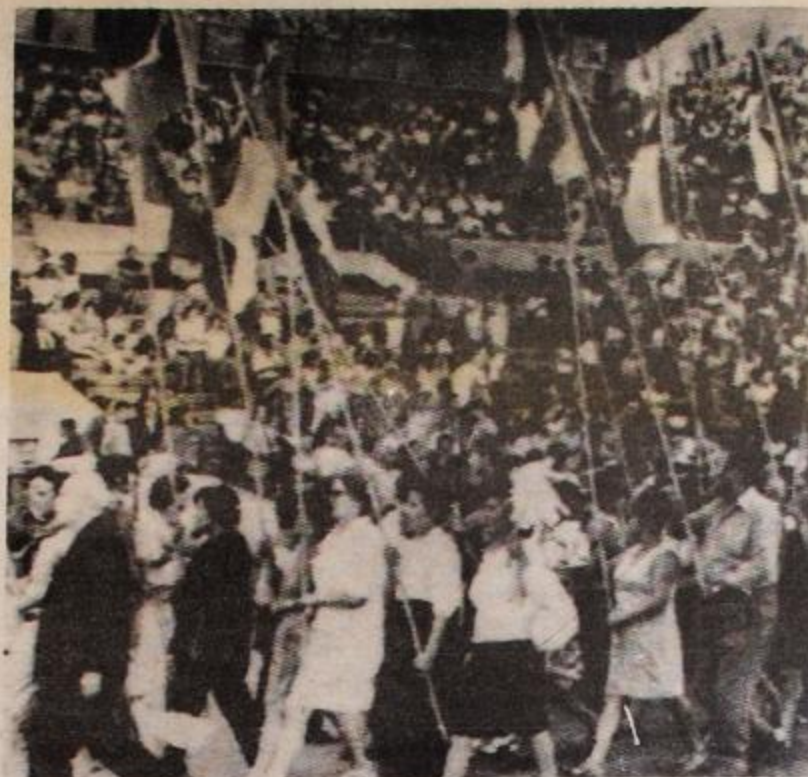
Estadio Nacional de Chile. Deporte - manifestaciones - presos - ¿Deporte?