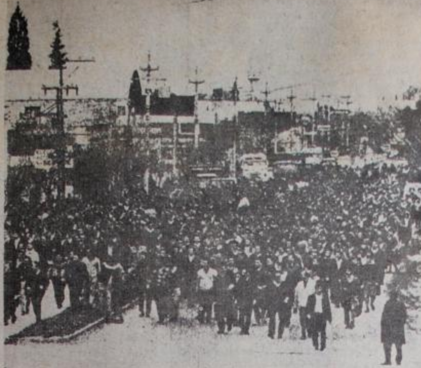
Cuando el pueblo gana la calle

Como siempre sucede, sectores democráticos opositores a Yrigoyen que en un primer momento auspiciaron la "solución militar", también fueron perseguidos por los militares golpistas. Pero, por supuesto, como siempre sucede, el grueso de la represión la sufrió la clase trabajadora. Un caso entre muchos: el 10 de octubre de