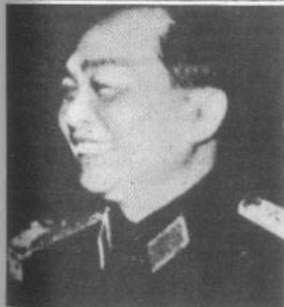
El general Vo Nguyen Giap.

Las tratativas de la Conferencia de París han entrado en un nuevo impa-